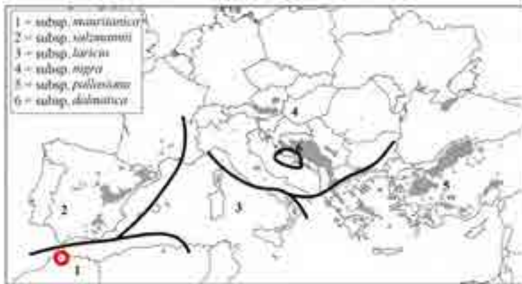
Figura 1. Distribución geográfica de las poblaciones naturales de Pinus nigra de acuerdo a EUFORGEN (2009). Se muestran las distintas subespecies según Quézel & Médail (2003). Se señala en rojo la zona de estudio.