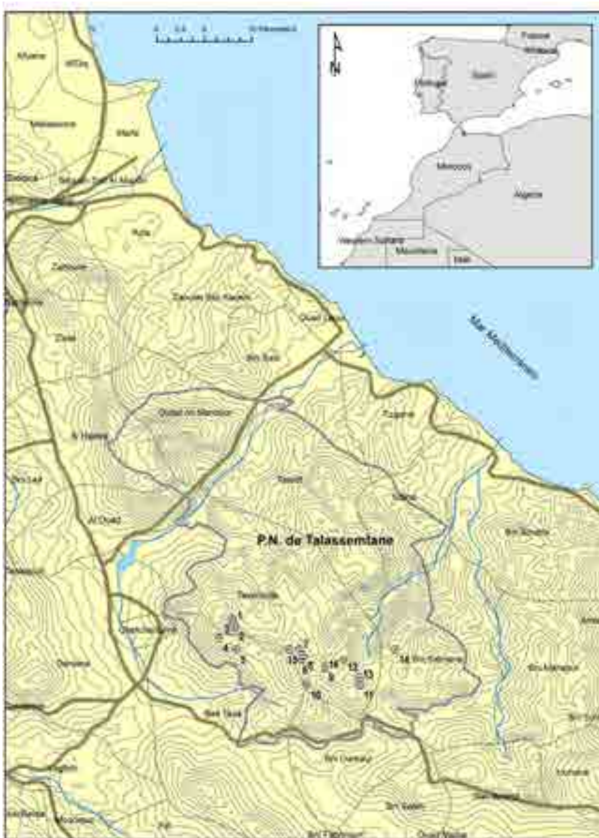
Lámina 1: 1. Asseska I. 2. Asseska II. 3. Azilan. 4. Jbel Tissouka. 5. Bab Taza I. 6. Plaza de los Españoles. 7. Amazzar Talassemiane. 8. Madisuka. 9. Beni M'Hamed. 10. Jbel Lakraa. 11. Bab Taza II. 12. Collado de Adeldal. 13. Jbel Taloussisse. 14. Jbel Fahs d'Adeldal. 15. Hauta-el-Kasdir. 16. Jbel Talassemiane.