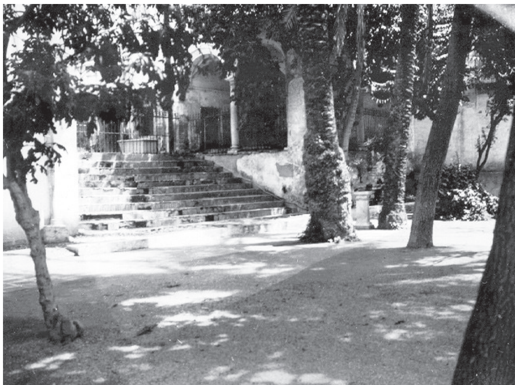
Fig. 2. Vista del jardín a mediados del siglo XX.

Aragoncillo era zoólogo y en Orense ya reunió una colección entomológica notoria. En Málaga amplió y desarrollo con gran acierto el Gabinete de Historia Natural y en la Memoria del Instituto de 1873 se habla de que los Gabinetes merecen: los elogios de las personas inteligentes y de los muchos extranjeros que nos honran con visitarlos 15 .