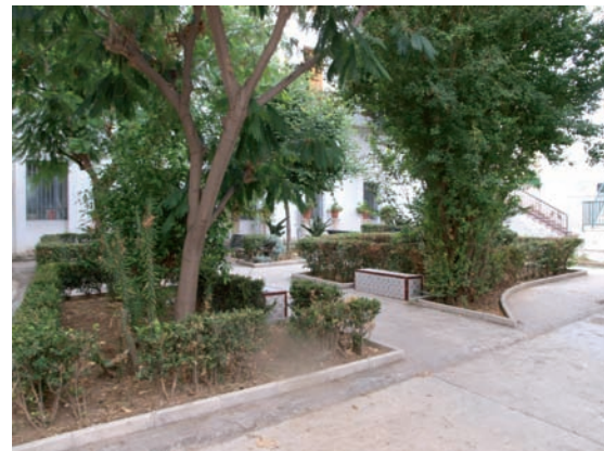
Fig. 4. Imagen actual de los restos del Jardín Botánico

Esta riqueza en plantas llegó a incrementarse de forma notable, según el comentario de MERCIER & DE LA CERDA (1866) en la obra Guía de Málaga y su provincia: El Jardín Botánico cuenta con setecientas plantas clasificadas y colocadas por familias con su correspondiente invernadero . La situación actual dista mucho de aquellos momentos de esplendor y hoy día apenas se conservan algunas especies de aquella época (Fig. 4).