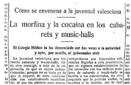
Titulares de Las Provincias (5 julio 1921).

Nada de esto debe extrañarnos, pues desde que en 1921 el doctor José Sanchís Bergón, presidente del Colegio de Médicos de Valencia, y el diario Las Provincias llevaron a cabo una campaña de prensa conjunta contra el envenenamiento de la juventud valenciana en los cabarets y music-halls , este tipo de establecimientos de ocio nocturno habían quedado definitivamente vinculados a la venta y uso de cocaína y morfina 19 . De hecho, tal era el estigma a esas alturas que algunos medios al referirse a estas sustancias utilizaban la terminología “drogas de cabaret” 20 .