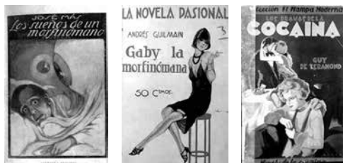
Novelas Los sueños de un morfinómano (1921), Gaby la morfinómana (1926) y Los dramas de la cocaína (1929).

Ante tal situación, el directorio civil encabezado por el general Primo de Rivera decidió tomar el control del tema, decretando las bases sobre las que habría de asentarse un futuro monopolio estatal en la distribución y venta de estupefacientes que pusiera fin a aquel fenómeno relativamente nuevo, que ya estaba considerado como una de las principales plagas sociales contemporáneas 1 . El organismo que a finalmente había de gestionar aquel monopolio se denominó Servicio de Restricción de Estupefacientes 2 .