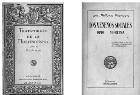
Libros Tratamiento de la morfinomanía (1920) y Los venenos sociales (1923).

Desde que el 1 de marzo de 1918 el gobierno español quiso poner coto al abuso de las drogas consideradas eufóricas, con la promulgación de una Real orden, el incremento de la circulación de cocaína, morfina, opio y otras sustancias psicoactivas había ido en claro aumento. De nada servían las numerosas detenciones de consumidores y traficantes, incluidos no pocos médicos y farmacéuticos. La incautación de pequeñas partidas —cada vez más adulteradas— y el decomiso de grandes alijos no surtían el efecto deseado. Poca utilidad había demostrado la experiencia transmitida por el neuropsiquiatra César Juarros en su libro Tratamiento de la morfinomanía (1920), así como los conocimientos vertidos por el doctor Antonio Pagador en su obra Los venenos sociales. Opio. Morfina (1923). La curación rápida y sin sufrimiento anunciada por los doctores Peribáñez, Rodríguez de Vera y otros especialistas en las páginas de periódicos de gran tirada semejaba un simple parche. Y los resultados de la labor preventiva de la Asociación contra la Toxicomanía, fundada en Barcelona en 1926, eran más que dudosos, pues ni siquiera el ministro de la Gobernación, general Martínez Anido, se había librado de tener una hija morfinómana.