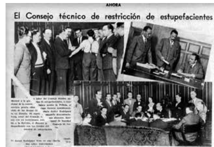
El Consejo Técnico Nacional para la Restricción de Estupefacientes al completo.

multa por posesión de cada gramo de sustancia podrá elevarse hasta 500 pesetas, y si el acto ilícito se hubiera realizado en su establecimiento, podrá ser éste clausurado temporalmente. Las mismas sanciones se impondrán a los responsables de mera tenencia o consumo ilícito [...]” 23