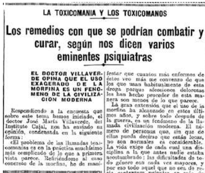
Heraldo de Madrid (27 marzo 1928).

dio químico anormal”, comparándolo con la morfina, y el doctor Villaverde también lo comparaba con la morfina, diciendo que “todas las personas no equilibradas con grandes amarguras, decepciones, dificultades de todo género, etcétera”, encontraban en ambas sustancias “un medio que momentáneamente les hace olvidar lo que les imposibilita la vida”.