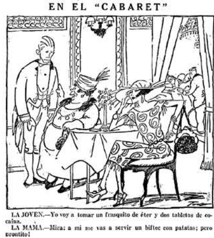
Viñeta de Manuel Tovar Siles publicada en La Voz (21 septiembre 1922).

Estas personas frecuentan los diversos lugares que abundan tanto en las grandes ciudades modernas: «bares», «cabarets», «dancings», «music-halls», etc.; y en estos lugares es donde se debe ejercer la más estrecha vigilancia para evitar la diseminación de tan perjudiciales costumbres.