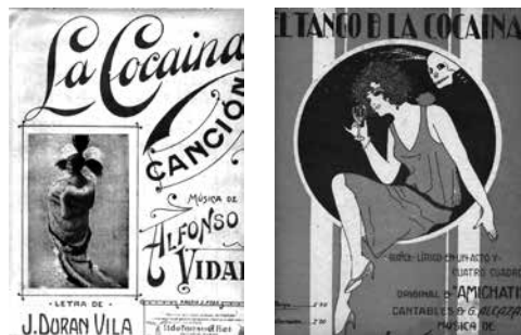
Libretos de La cocaína (1920) y El tango de la cocaína (1926).

Las drogas impregnaban páginas enteras de novelas y periódicos, así como las letras de cuplés, tangos y otras melodías de gran éxito, mientras el goteo incesante de intoxicaciones agudas y muertes por sobredosis —no tanto accidentales como suicidios— era aireado y amplificado por la prensa generalista. De tal manera, podríamos decir, sin incurrir en exageración alguna, que a mediados de los años 20 las drogas ya estaban plenamente incorporadas en la cultura popular española.