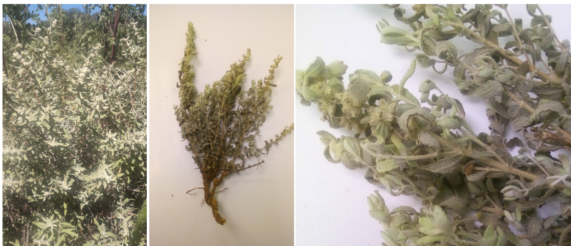
■ Figura 1. Planta silvestre de Buddleja scordioides Kunth.

Figure 1. Wild plant of Buddleja scordioides Kunth.