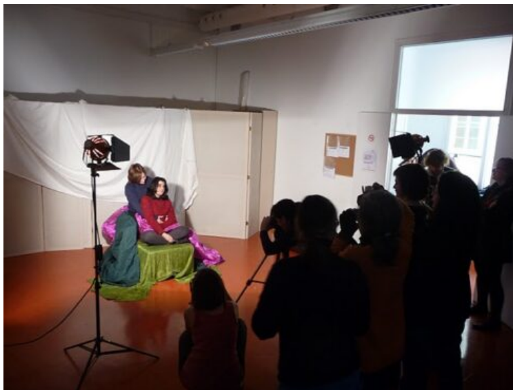
Imatge: Plató fotogràfic al taller “La pintura”, a cura de Cori Mercadé, al Centre de Cultura de Dones Francesca Bonnemaison, 12 de febrer de 2010.

mestres ja havien participat en els anteriors i hi tornaven perquè l'experiència els havia resultat profitosa i plaent. Començàvem doncs a fer xarxa. També en aquesta ocasió, en comptes de dinar en un restaurant proper, vam fer-ho en un espai preciós del mateix centre, preparat acuradament, com el dinar, per les dones del sindicat de treballadores de la llar Sindillar . Malauradament, van començar les retallades pressupostàries, que van afectar especialment tant els espais educatius com els espais de dones i Entremestres no va poder tenir continuïtat en aquell context i àmbit.