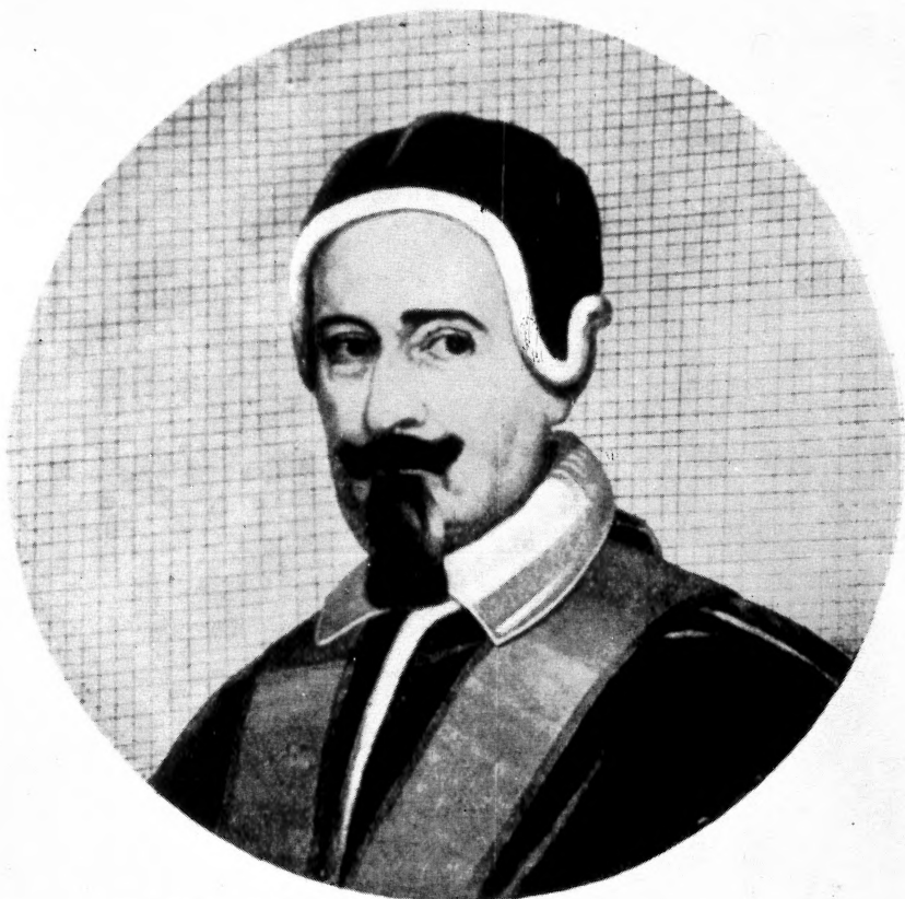
ALEXANDER PP. VII (CHIGI) (1655 -1667)