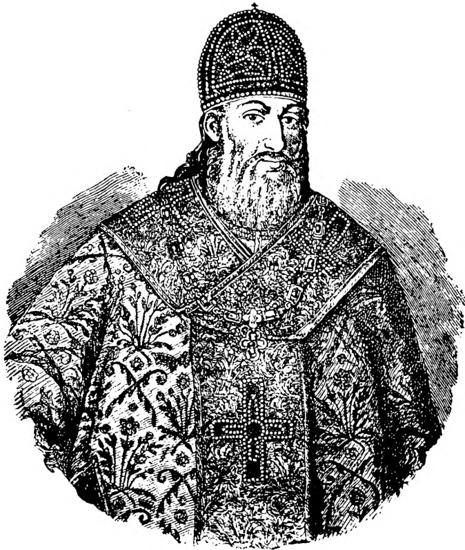
PETRUS MOHYLA - METROPOLITA KIOVIENSIS (1633 - 1647)