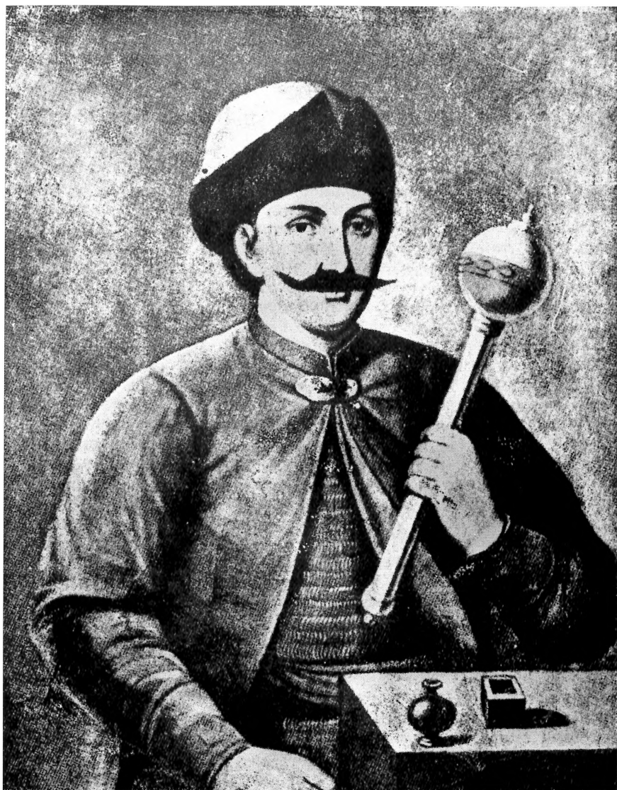
JOANNES VYHOVSKYJ - DUX COSACORUM (1657 - 1659)