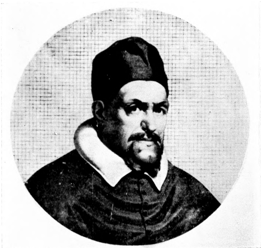
INNOCENTIUS PP. X (PAMPHILJ) (1644 - 1655)