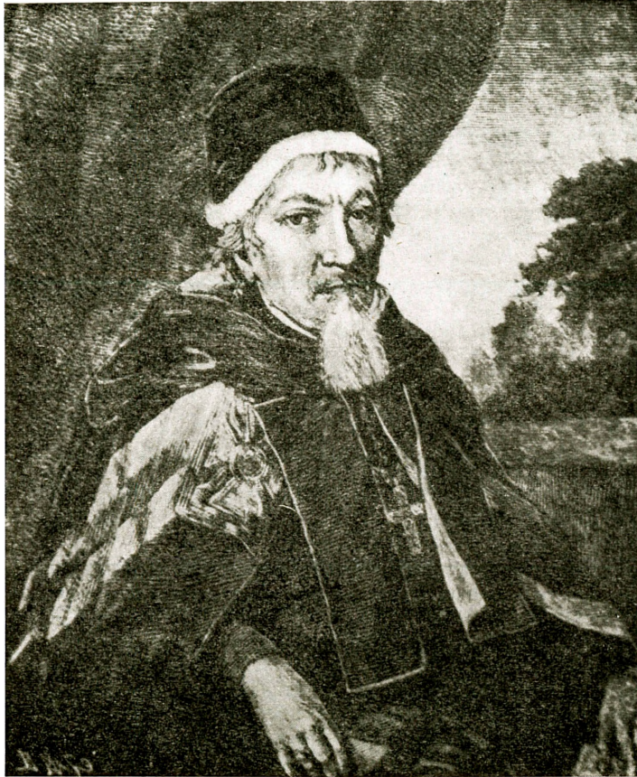
FLORIANUS HREBNYCKYJ, METROPOLITA KIOVIENSIS