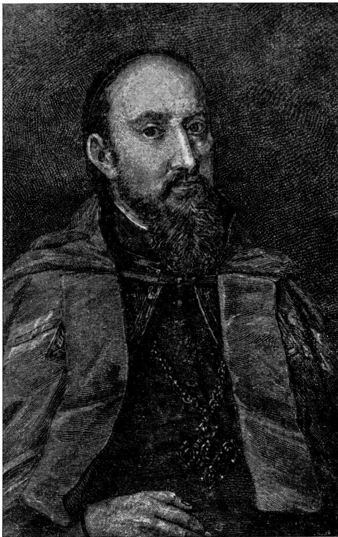
ATHANASIVS SZEPTYCKYJ, METROPOLITA KIOVIENSIS