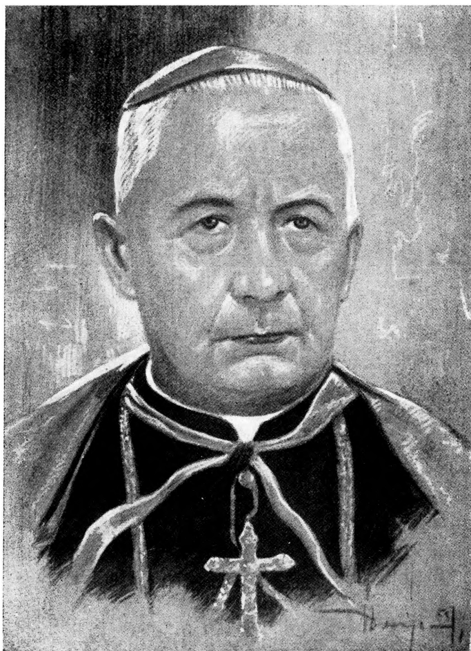
GREGORIUS CHOMYŠYN - EPISCOPUS STANISLAOPOLITANUS

( * 1867 - ord. 1893 - cons. 1904 - † 1946 )