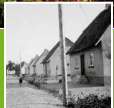
Nachkriegszeit: Katholische Flüchtlinge bauen eigenen Stadtteil