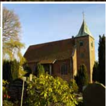
400 Jahre Dreifaltigkeitskirche