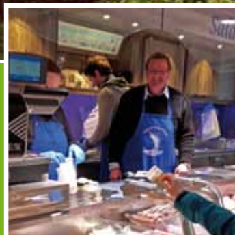
Vom Dreher zum Fischhändler