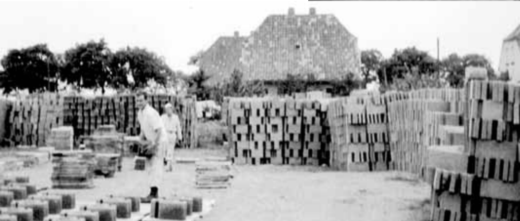
Die ersten Siedlungshäuser (oben) und der „Steinplatz“ (links), auf dem die Steine aus Kostengründen in Eigenleistung hergestellt wurden.