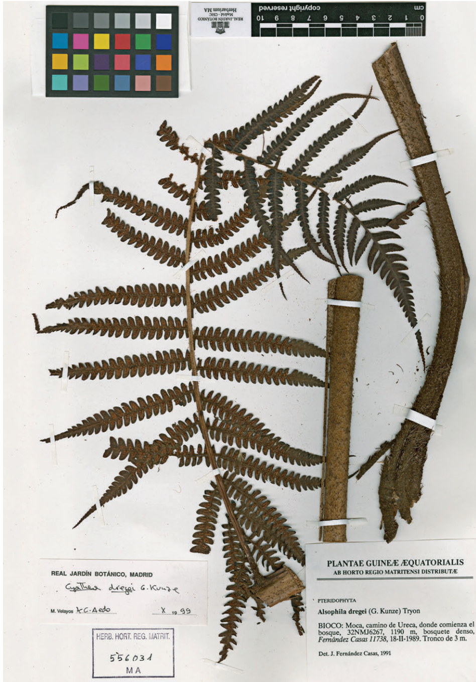
Fig. 64. Cyathea dregei