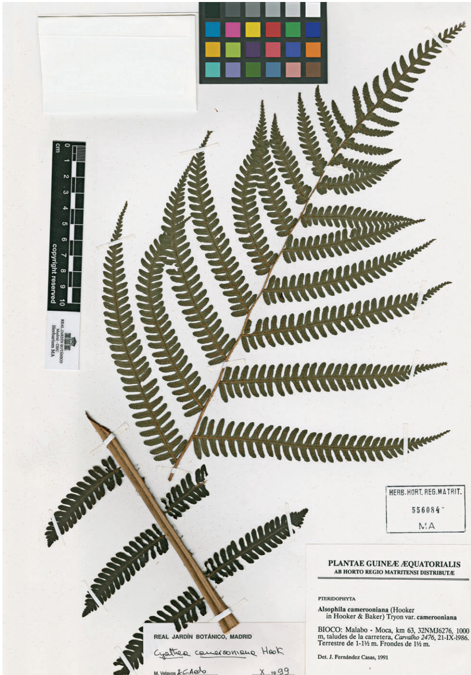
Fig. 63. Cyathea camerooniana