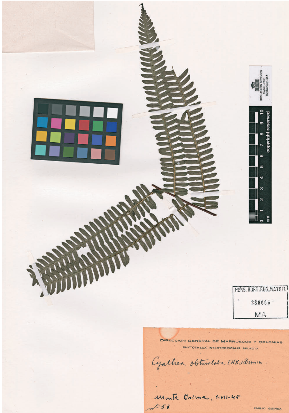
Fig. 66. Cyathea obtusiloba