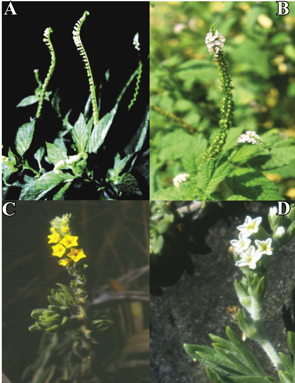
Figura 2. A- Heliotropium angiospermum Murray; B- Heliotropium indicum L.; C- Heliotropium salicioides Cham.; D- Heliotropium ternatum Vahl. (Fotografías: A- J. L. Fernández-A, pliego F. Barajas s.n. , de Pescadero; B- R. Galindo-T. et al. 1384, C y D- R. Galindo-T., de Los Santos).