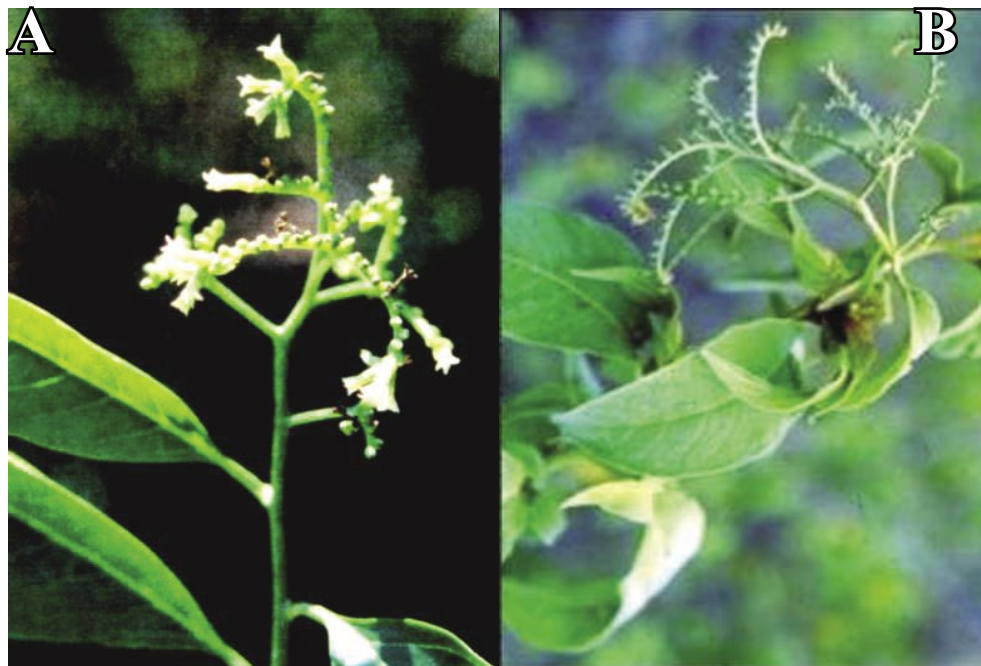
Figura 3. A- Tournefortia angustiflora Ruiz & Pav.; B- Tournefortia volubilis L. (Fotografías J. L. Fernández-A.: A J.L. Fernández 21489, de San José de Suaita y B- : J. L. Fernández 22234, de Los Santos).