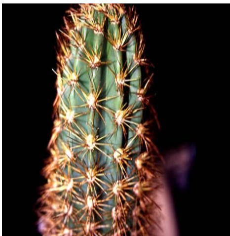
Browningia hernandezii . Detalle de las costillas, areolas y espinas en la parte apical de un eje (a partir de J.L. Fernández-Alonso & al. 23877).

Browningia fue descrito como género nuevo de la tribu Cereeae, subtribu Cereinae por Britton & Rose en 1920 y posteriormente ubicado en la tribu independiente Browningieae por F. Buxbaum, tribu que en los años 90 incluía además a los géneros Armatocereus Backeb., Calymmanthium F. Ritter, Jasminocereus Britton & Rose, Neoraimondia Britton & Rose y Stetsonia Britton & Rose (Barthlott & Hunt 1993). Browningia cuenta en la actualidad con una docena de especies de los Andes Centrales (en su mayoría peruanas), y a grandes rasgos podemos caracterizarlo por ser plantas arbustivas o arborescentes con tallos cilíndricos provistos de 6-30 costillas, con areolas espinosas o muy espinosas en sus partes vegetativas y en algunas especies, con areolas inermes en los ejes fértiles; flores tubular-infundibuliformes, nocturnas, con hipantos recubiertos de conspicuas escamas imbricadas y con las areolas desprovistas de pelos o espinas; con piezas petaloideas numerosas, generalmente blancas, cortas y agudas en el ápice. Frutos de depreso-globosos a ovoides, generalmente carnosos y recubiertos de escamas carnosas, imbricadas. Semillas negras o marrones, reniformes, finamente tuberculadas o ruminadas.