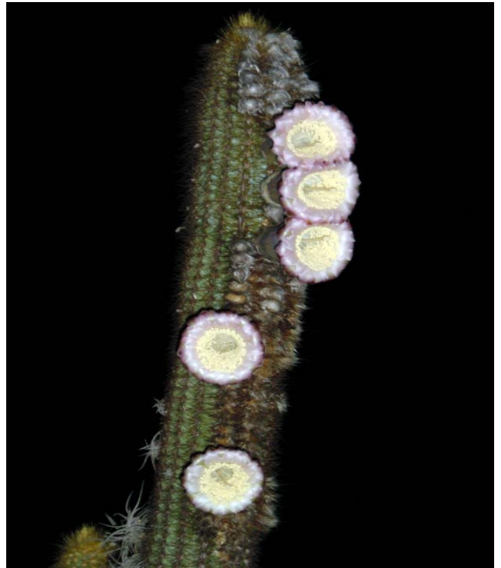
Rama de Pilosocereus tillianus en floración. Las flores presentan antesis nocturna, los tépalos son blancos y los numerosos estambres producen abundante polen que cubre la cabeza de los murciélagos que las polinizan.

Carmen Julia Figueredo Urbina Departamento de Biología, Facultad de Ciencias, Universidad de los Andes. Apartado Postal 5101, Mérida, Venezuela. Correo-e: figueredocarmen@ula.ve