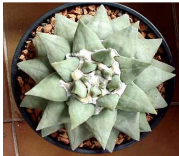
Ariocarpus retusus (Foto: Eufemia Morales).