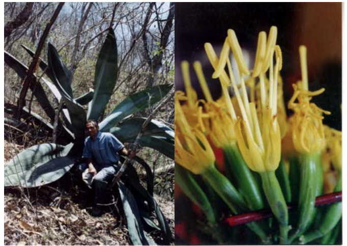
Agave valenciana en referencia al tamaño de una persona (izq.) y flores en antesis, mostrando los estambres (der.).

Plantas perennes, solitarias, no forman hijuelos, 5-7 m altura, rosetas 1,7–2,2 m de altura, hasta 4 m de diámetro, tallo corto, hojas de 7 a 15, hojas maduras de 1,5-2,3 m de largo, 37-60 cm de ancho en la parte media, hasta 30 cm de ancho y 15 cm de grueso en la base, anchamente lanceoladas, ascendentes, cóncavas, verde oscuras, ligeramente glaucas, lisas en el haz y envés, con bandas transversales en ambos lados, márgenes frecuentemente ondulados, distintamente crenados en la mitad a estrechamente dentados en parte superior, con mamas de 4-6 x 5-19 mm, dientes mayormente de 2-5, café oscuros a rojo-café, dientes intersticiales pocos o ninguno, espina 10-15 mm largo, robustas y cónicas, café oscura a rojo-café, panículas 5,7 m alto, escapo floral 12 a 35 cm de diámetro en la base, con 25 a 35 umbelas difusas, en la mitad superior del escapo, brácteas triangulares, agudas en el ápice, espiralmente colocadas, escariosas, flores 50-70 mm largo, amarillo brillante, protandras, ovario 18-27 x 4-5 mm, verde claro, el cuello 3-5 mm de largo, inconstricto, tubo 5-7 mm de largo, 10 mm ancho, algo infundibuliforme, tépalos 10-13 x 4-5 mm, lineares, carnosos, el ápice galeado, amarillos, filamentos 35-38 mm largo, amarillos, anteras 10-17 mm largo, céntricas, amarillas, cápsulas oblongoides 23-29 x 10-13 mm, estipitadas, un corto pico terminal, semillas de contorno triangular, pero cur-