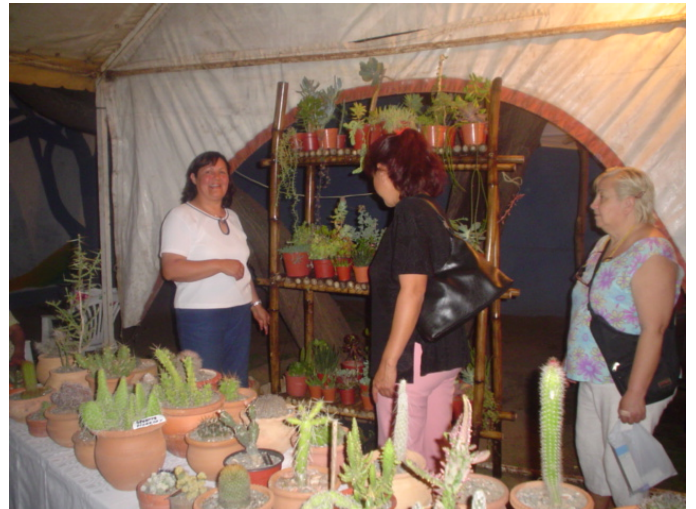
Stand de exposición del Círculo de Coleccionistas de Cactus y Crasas de Catamarca, en la EXPOCACTUS 2005.