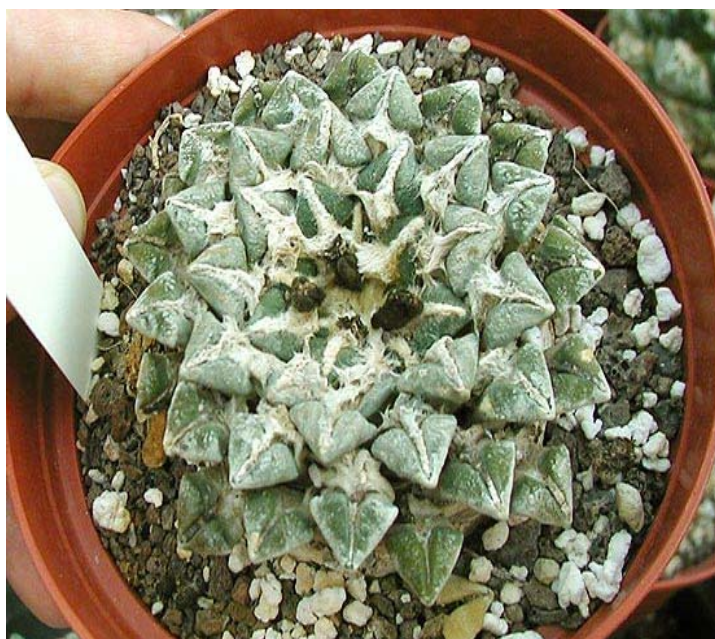
Ariocarpus kotschobeyanus.

Las pruebas coloridas no indican la presencia de esteroides y triterpenos en ninguno de los extractos, mientras que las saponinas solo están presentes en la parte aérea