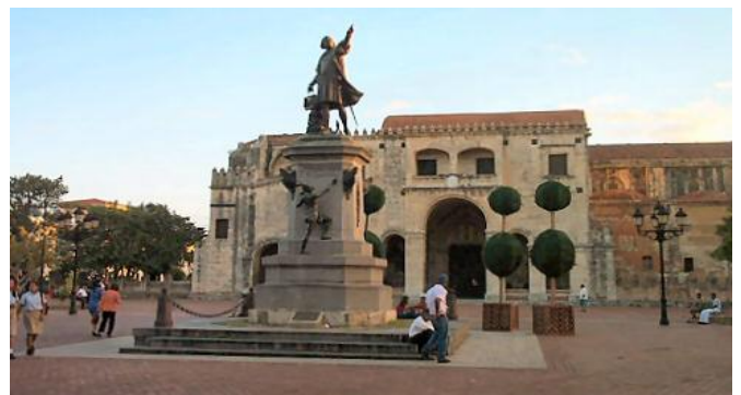
Plaza Colón, Sto. Domingo, República Dominicana.

Esperamos que este evento despierte el interés científico de las nuevas generaciones de botánicos que asistan al congreso. ¡Nos vemos en Sto. Domingo! ●