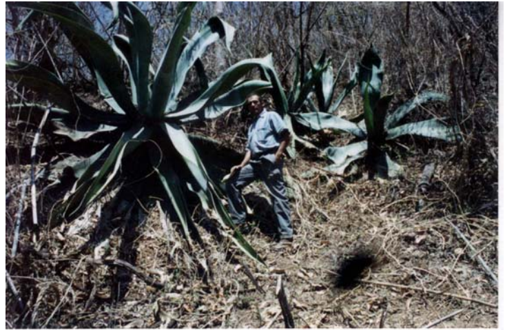
Agave valenciana , nueva especie de agave para el Edo. de Jalisco, México. (Foto: Patricia H. de Cházaro).

La Bacanora es un producto artesanal elaborado de plantas silvestres, tanto de Agave angustifolia como de A. palmeri Engelm., no A. yaquiana Trel., como aseveró Martínez (2004), que es uno de entre una veintena de