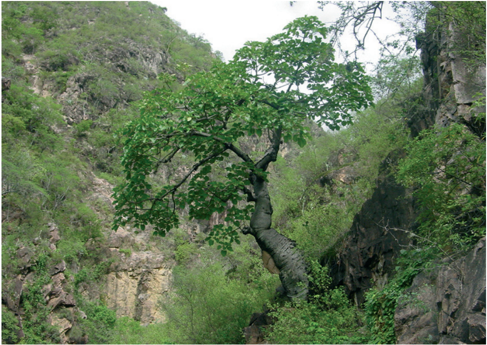
Figura 1. Cavanillesia chicamochae Fern. Alonso en los escarpes de la quebrada “Chinavega”, Piedecuesta, Santander, Colombia.