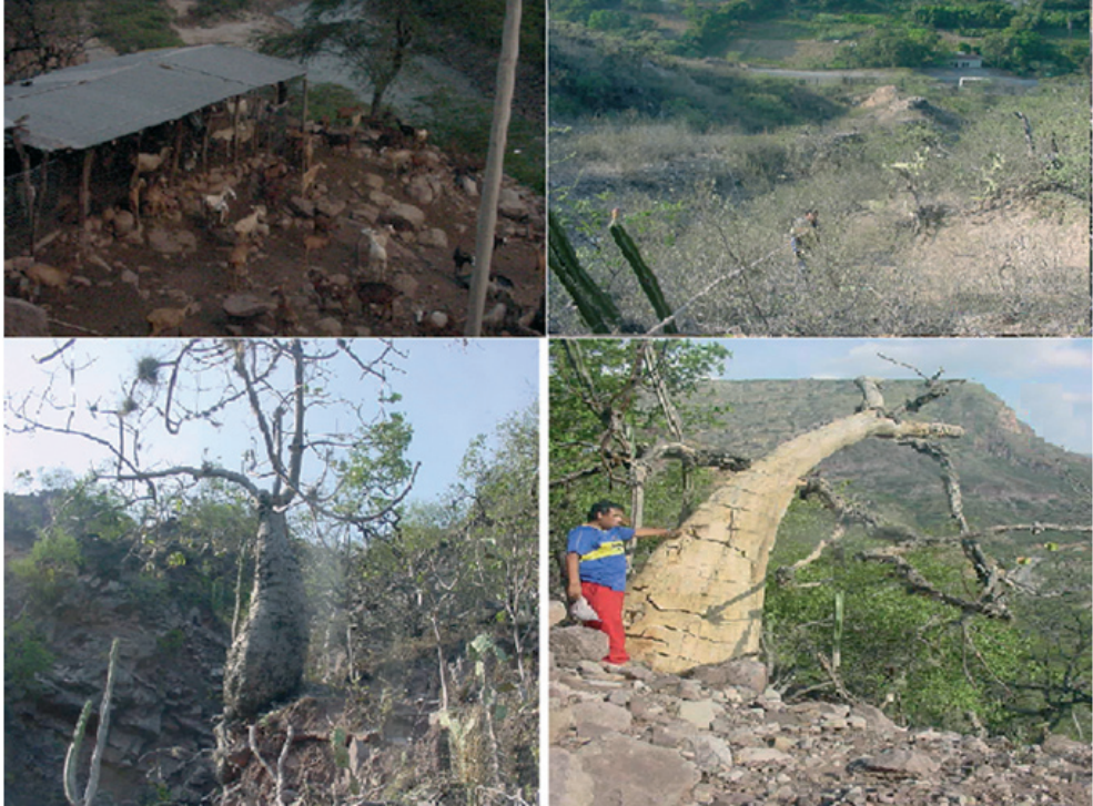
Figura 4. Principales factores de amenaza que afectan a Cavanillesia chicamochae Fern. Alonso. A. Ganadería caprina. B. Incremento de los cultivos y extracción por coleccionistas. C. Inestabilidad del terreno en las pendientes. D. Individuo afectado (fractura) por las rocas de un derrumbe o corrimiento de masa.