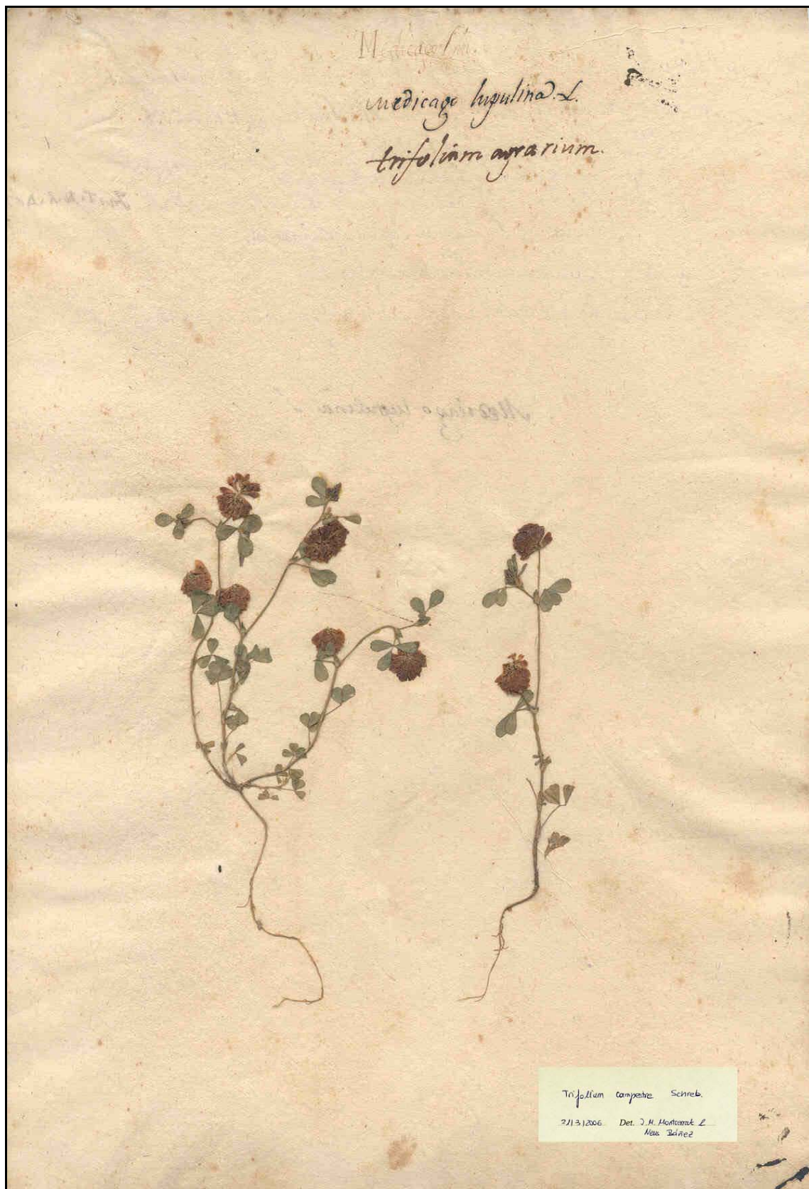
Figura 29. Plec de Trifolium campestre L. amb determinació de Pavón (BC-Bernades-144)