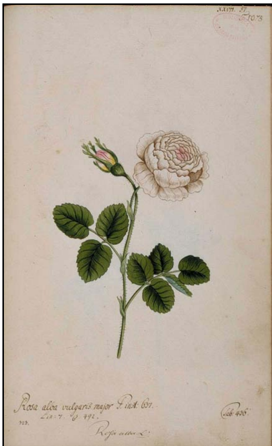
Figura 25. Dibuix de Rosa alba L. conservat a l' Herbarium pictum (volum 5, T. 1073, arxius del Real Jardín Botánico de Madrid)

Assenyalem finalment que Armada & San Pio (2002) publicaren els tretze dibuixos de roses que apareixen al volum cinqué d'aquesta obra, que corresponen a vuit espècies diferents. La identificació original d'aquests dibuixos correspon a la transició al sistema de nomenclatura linneà: tres dibuixos estan determinats amb un binomen però deu ho són segons la nomenclatura prelinneana (vegeu figures 25 i 26).