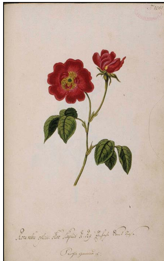
Figura 26. Dibuix de Rosa gallica L. conservat a l' Herbarium Pictum (volum 5, T. 1081, arxius del Real Jardín Botánico de Madrid)