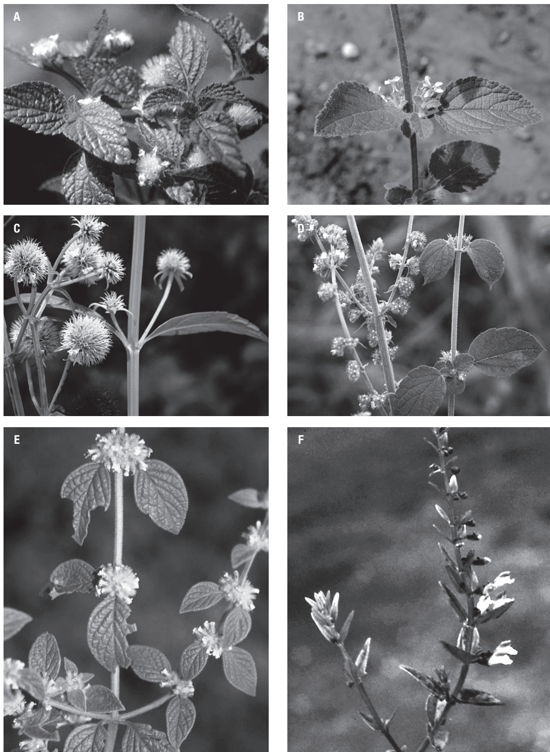
Fig. 3- Imágenes de alguna de las especies americanas tratadas. A: Hyptis atrorubens Poit. B: Hyptis suaveolens (L.) Poit. C: Hyptis savannarum Briq. D: Hyptis pectinata (L.) Poit. E: Minthostachys mollis (Kunth) Griseb. F: Scutellaria racemosa Pers.