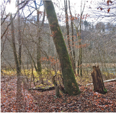
Abb. 3. Lebensraum von Neckera smithii an der Saane (Kt. FR).