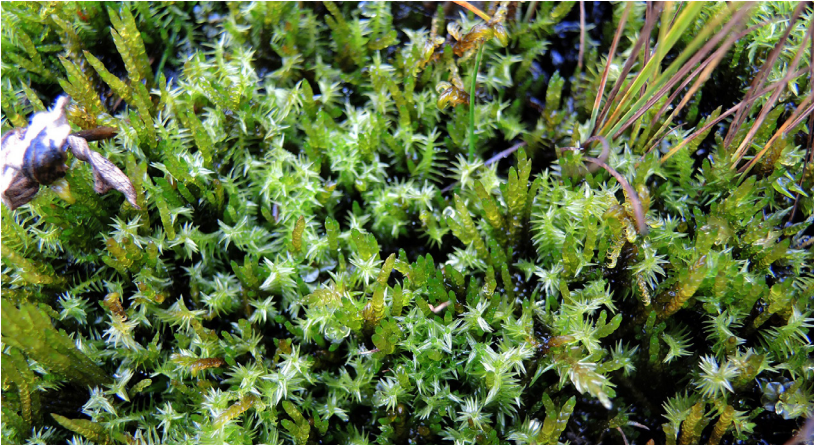
Abb. 5. Meesia triquetra (L.) Ångstr. mit der typischen schraubigen, dreizeiligen Beblätterung, hier zusammen mit Drepanocladus trifarius (F.Weber & D.Mohr) Paris.

Odontoschisma francisci (Hook.) L.Söderstr. & Váňa Rote Liste-Status: VU Melder: Senta Stix, Niklaus Müller, Norbert Schnyder