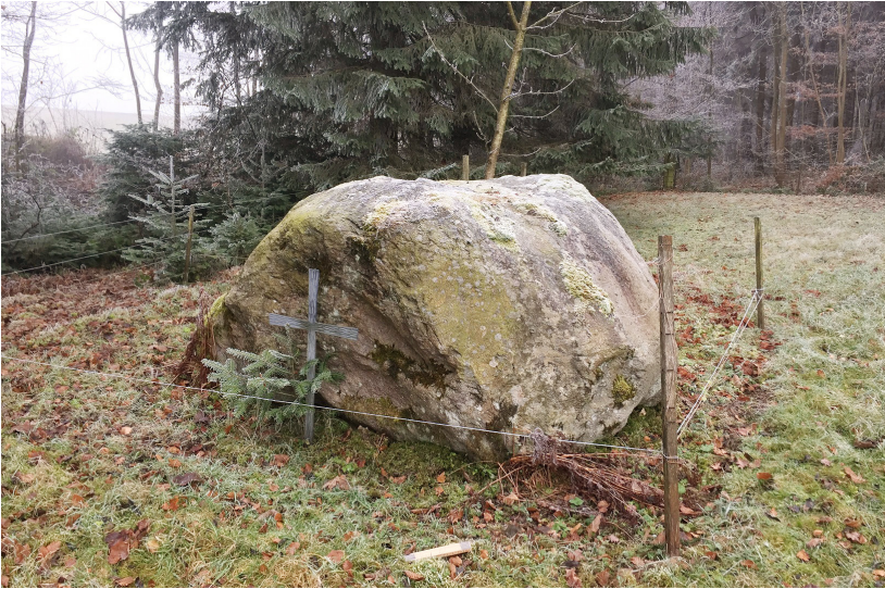
Abb. 7. Dieser Verrucano-Findling in Küsnacht (ZH) beherbergt den Erstfund von Racomitrium microcarpon im Mittelland sowie fünf weitere bemerkenswerte Moosarten.

Schistidium confusum H.H.Blom Melder: Thomas Kiebacher