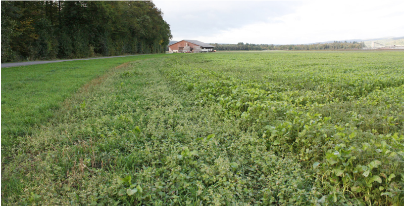
Abb. 6. Ackerschonstreifen bei Rafz mit Protobryum bryoides.

Der Standort scheint relativ trocken, zum einen wegen der relativ geringen Niederschläge im Rafzerfeld, zum anderen wegen der vorherrschenden, gut drainieren Schotterböden, sowie durch Windeinfluss und direkte Sonnenexposition der ebenen Landwirtschaftsflächen. Eine gut ausgeprägte Ackermooseflora kann sich nur an von Feldgehölzen beschatteten Randbereichen etablieren. Die für die begleitenden Ackermoose eher ungünstigen Verhältnisse sind für P. bryoides jedoch ein Glücksfall, da die Art an eher trockenen Standorten aufkommt (Preussig et al. 2010). Die Pionierart wächst in subatlantischem Klima auf basen- bis kalkreichen Böden und kommt in Osteuropa auch in lückigem Grasland mit leicht salzhaltigen Böden vor (Papp et al. 2016). Im Norden Europas wächst sie vor allem auf anthropogen beeinflussten Flächen, wie Acker- und Wegrändern oder an Gräben (Jukoniené 2008; Atherton et al. 2010). In der Schweiz findet man die Art sowohl an offenerdigen, stark anthropogen beeinflussten Standorten, wie auch in Trockenrasen und ähnlichen Habitaten (Bergamini 2011).