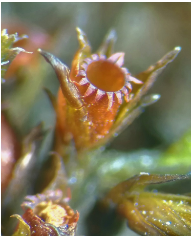
Abb. 8. Die Farbe der Blätter, die Stellung der Perichaetialblätter und das Peristom mit den zurückgeschlagenen Zähnen von Schistidium confusum haben Ähnlichkeit zu S. dupretii.

In der Europäischen Roten Liste wurde S. confusum als ungefährdet (LC) klassifiziert, die Art ist aber bislang nur aus wenigen nord-, ost- und zentraleuropäischen Ländern bekannt (Hodgetts et al. 2019b). Aus den Nachbarländern der Schweiz fehlen noch Nachweise in Lichtenstein und Italien (Hodgetts et al. , im Druck).