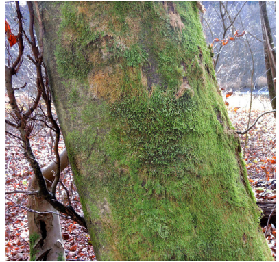
Abb. 4. Nahaufnahme des Buchenstamms mit Neckera smithii in der Bildmitte und reichlich Hypnum cupressiforme.

Neckera smithii ist vermutlich eine der Arten, die in unserer Region von der Klimaerwärmung profitiert und sich weiter Richtung Norden ausbreitet. Sie wächst in der Schweiz an Kalk- und Gneisfelsen und wurde gemäss den Angaben in der Datenbank von Swissbryophytes epiphytisch an verschiedenen Baumarten gefunden: Quercus ilex , Populus sp., Morus alba , Celtis australis , Castanea sativa , Corylus avellana , Ulmus sp. und nun auch das erste Mal an Fagus sylvatica .