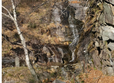
Abb. 2. Fundort von Diplophyllum obtusatum oberhalb von Cavigliano. Die Art wächst in Ritzen der Gneisfelsen am rechten Bildrand.

Neckera (Leptodon) smithii (Hedw.) Müll.Hall. Melderin: Heike Hofmann