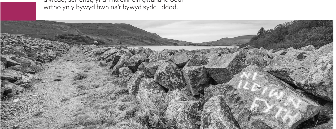
Ger Llyn Celyn By the shores of Llyn Celyn

The Christian hope is that at the end of the age we will find ourselves in the presence of an eternally just but also eternally loving Father. This allows us to face death differently, turning our passing from a matter of fear into a matter of preparing to be with the one who is our source and our destination, Christ from whom we cannot be parted in this life or the next.