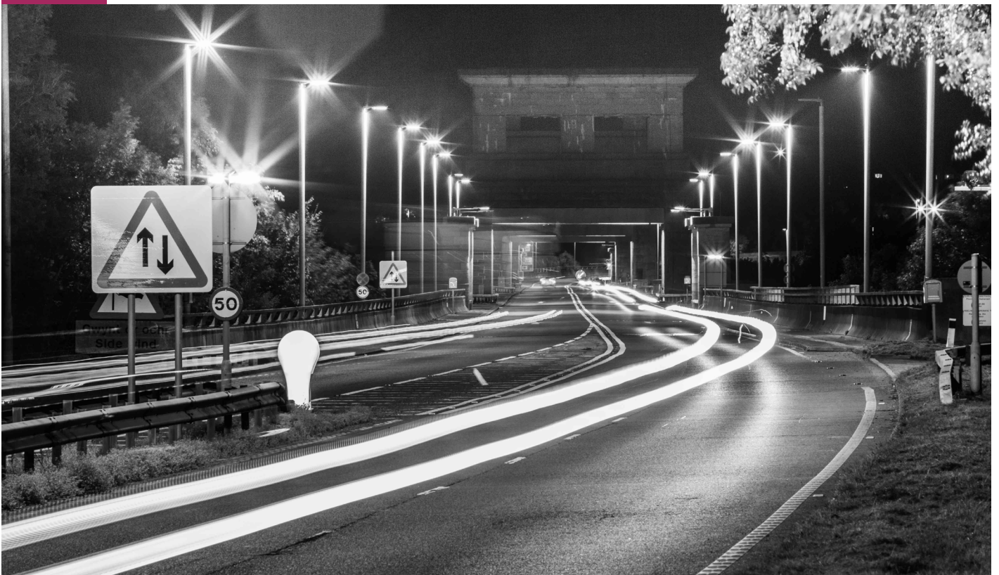
Yr A55 dros Bont Britannia The A55 over Britannia Bridge

At the same time, the A55 emphatically divides the island in a way that the old A5 did not. Thomas Telford's engineering masterpiece, completed with the Menai Bridge in 1826, allowed mail and stagecoaches to make a fast journey to the Dublin crossing, but communities were still joined, rather than bypassed, by the route. As traffic increased, new road schemes improved the quality of life for many villages but loss of footfall for local businesses was often the result. Thanks to the A55, though, employment