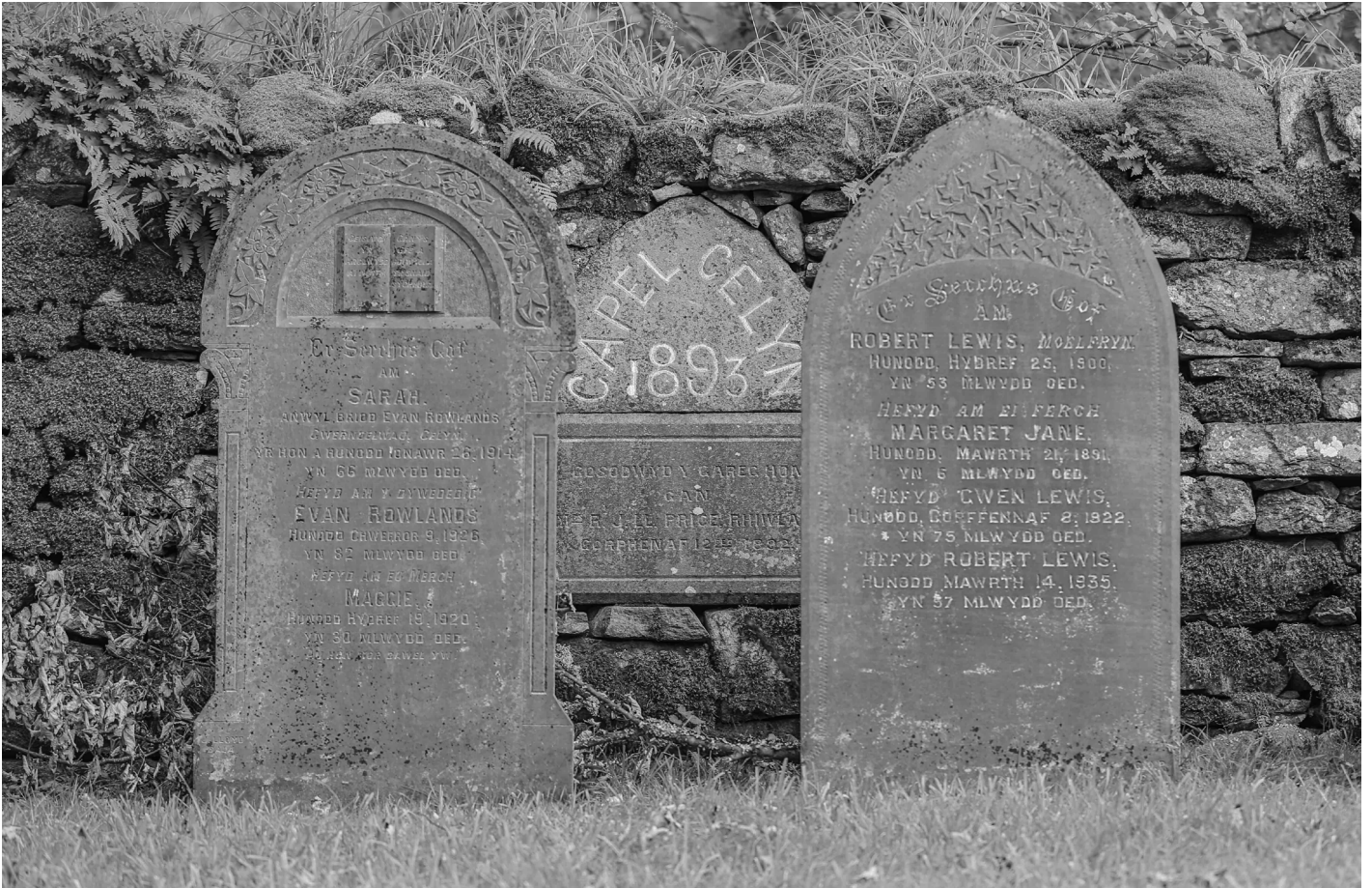
Cerrig beddau Capel Celyn | The gravestones of Capel Celyn