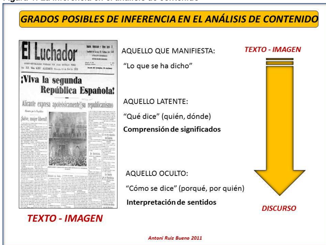
Figura-1: La inferencia en el análisis de contenido

Como resumen, en la Figura-1 se plasma de forma global los grados de inferencia que, según la RAE, se define como “llevar consigo, ocasionar, conducir a un resultado”, o bien, “sacar una consecuencia o deducir algo de otra cosa” esta cosa son los datos-textos a análisis que se pueden presentar en cualquier análisis de contenido.