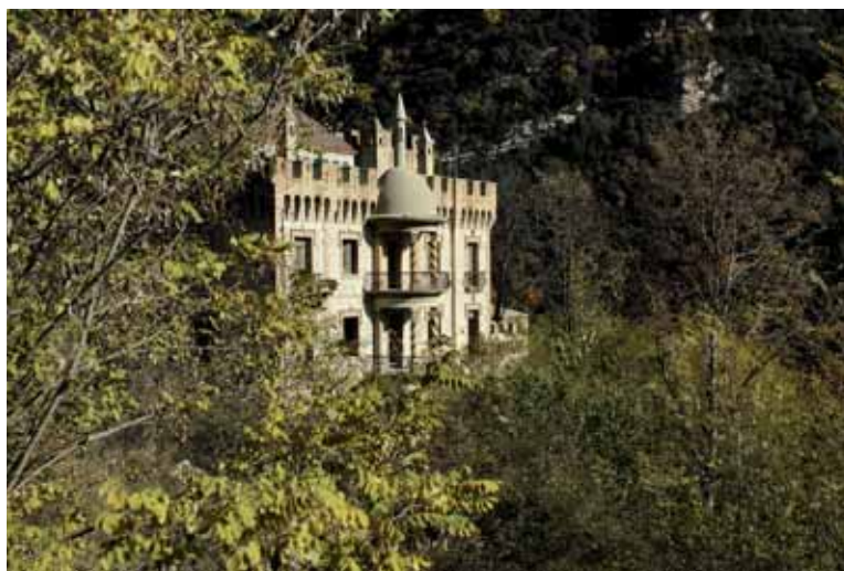
Una imatge del castell del comte de Figols

L’escàndol urbanístic més sonat que va viure el Berguedà va ser el que va amenaçar el poble de Peguera, un llogarret abandonat situat en un paratge natural bell i remot, a 1.700 metres d’altitud. És allà on va néixer el maqui Ramon Vila Caracremada . Ja es fa tard i no tenim temps d’arribar-hi, però Jordi Vall ens explica la història de l’indret: formava part dels latifundis del comte Olano i va ser propietat dels hereus del cacic fins que, l’any 2003, Butti Bin Maktoum, membre de la família governant dels Emirats Àrabs Units, va comprar el poble sencer. L’intermediari va ser el promotor local Pep Graus, amo de la immobiliària Pirineu 2000. El xec volia convertir Peguera en una urbanització residencial elitista, amb un hotel de cinc estrelles, pistes de tennis, hípica... El Pla d’Ordenació Urbanística Municipal (POUM) de 2009 va requalificar els terrenys per impulsar el projecte del multimilionari, malgrat l’oposició de certs sectors. “Per sort, finalment, el xec es va fer enrere perquè no estava disposat a invertir si no trobava un soci d’aquí. Però el mal ja està fet. Ara, els terrenys són urbanitzables: amb el