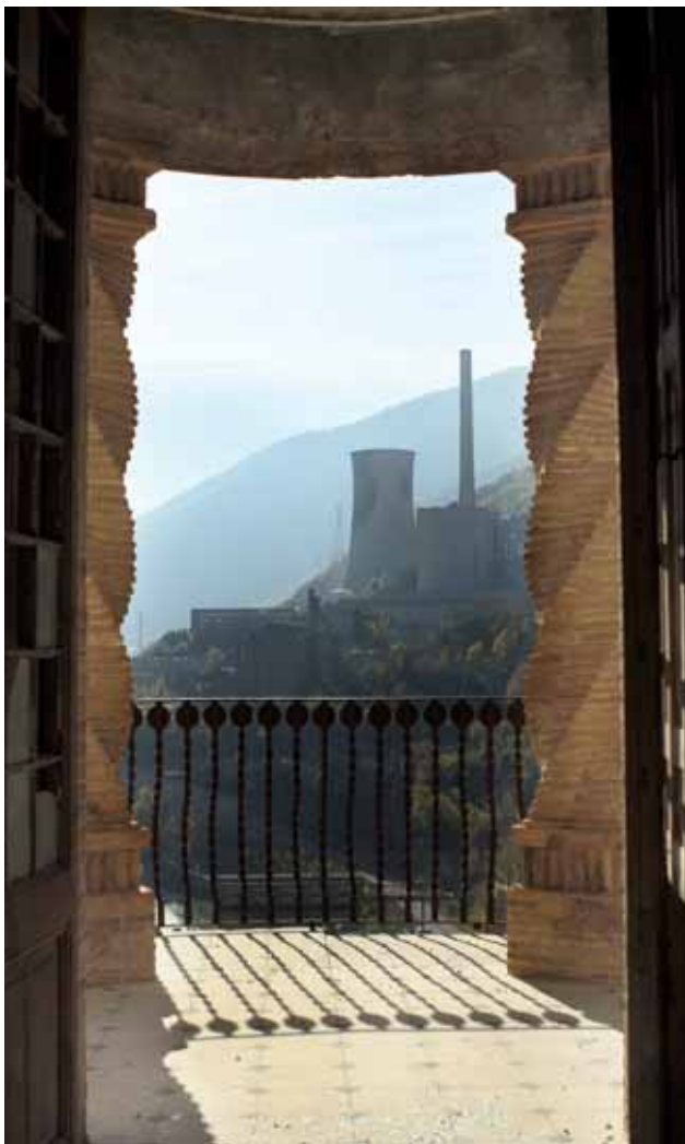
Xemeneia de l'antiga central tèrmica de Cercs

Placa commemorativa dels tres assassinats per col·laborar amb la guerrilla, a la plaça de les Fonts de Berga