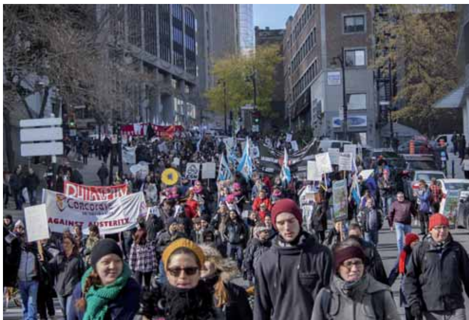
Les veus antimilitaristes es van alçar el passat mes d'octubre, barrejades amb les demandes d'un augment de la despesa pública

El complex armamentístic canadenc també estén els seus tentacles sobre altres àmbits de la societat com l'educació superior. Col·lectius d'alumnes com Demilitarize McGill denuncien que "les universitats juguen un paper clau en el complex industrial-militar". Per exemple, aquest grup ha denunciat que la universitat mont-realera de McGill, una de les més importants del país, "no solament ajuda els contractistes militars a desenvolupar tecnologia armamentística o de propulsió de míssils, sinó que, gràcies als salaris baixos dels estudiants, a la pràctica, assegura uns costos laborals molt reduïts a les empreses". El març passat, les activistes van bloquejar un laboratori de la universitat durant quatre hores. L'acció va tenir lloc després que es fes públic que, durant la darrera dècada, el seu equip investigador havia treballat en contractes militars valorats en mig milió de dòlars.