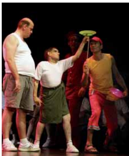
Representació amb persones que tenen diversitat funcional a l'Ateneu Popular de 9 Barris

Alejandro Zambra esguarda les petges de la dictadura pinochetista a la novel·la 'Formas de volver a casa'