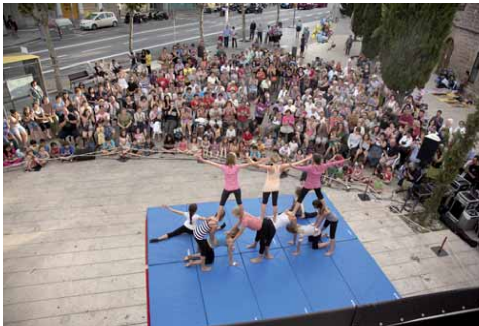
Un taller de circ de l'Ateneu de 9 Barris, a la Trinitat Nova / CARLES CALERO

Joves actuant a la plaça de Can Basté / LUIS MONTERO