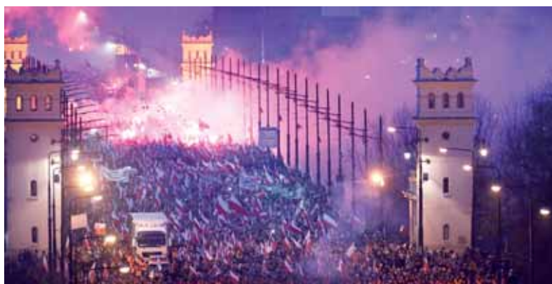
El 2013, 40.000 ultrases van participar a la manifestació

A la marxa neofeixista d'enguany, RN va convidar diferents formacions ultrases europees com Força Nova -de l'històric terrorista italià Roberto Fiore-, Jobbik, Renouveau Français, Joventut Nòrdica o el Partit Radical Serbi del criminal de guerra Vojislav Šešelj. També van participar a l'acte