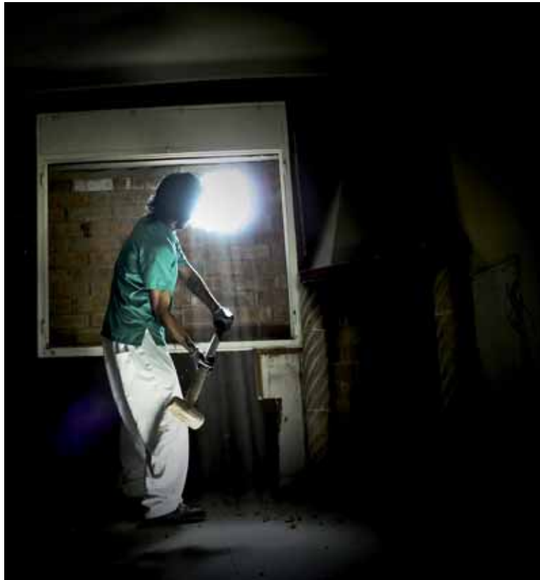
Moment de l'entrada a una de les cases del projecte Sis Claus