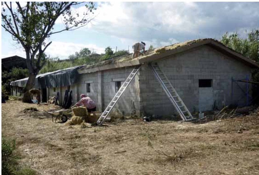
Treballs d'aïllament i condicionament de Can Tonal