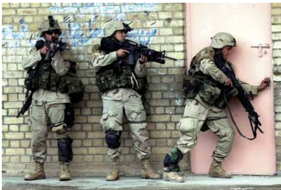
Tropes estatunidenses entren a un edifici a Fallujah el 9 de novembre de 2004 / JOHAN CHARLES VAN BOERS