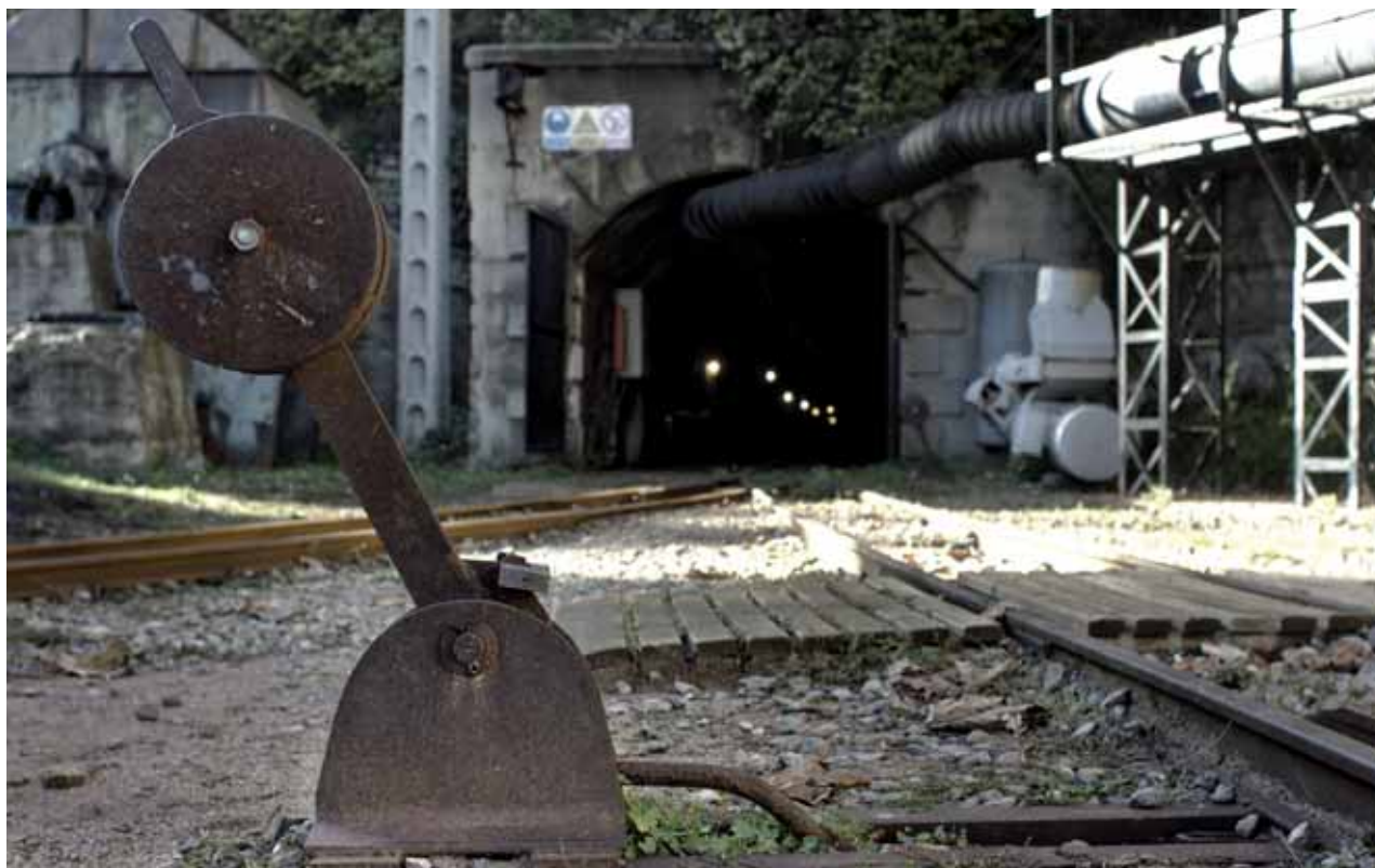
L'entrada d'una mina a l'antiga colònia de Sant Corneli (Cercs)

seva versió més crua. Les colònies fabrils agrupaven en un sol complex la fàbrica, els habitatges del personal i tots els recursos i serveis considerats necessaris per la vida del proletariat. Les pèssimes condicions de treball i els salaris de misèria es combinaven amb el control absolut sobre la vida de les obreres i els obrers, que havien de consumir, formar-se i gaudir del poc temps lliure de què disposaven sota l'ull i la butxaca omnipresents del patró. La col·laboració de l'Església, sobretot pel que fa a l'educació, era imprescindible. La concentració física de les treballadores facilitava, a més de la vigilància quotidiana, la repressió armada d'eventuals revoltes.