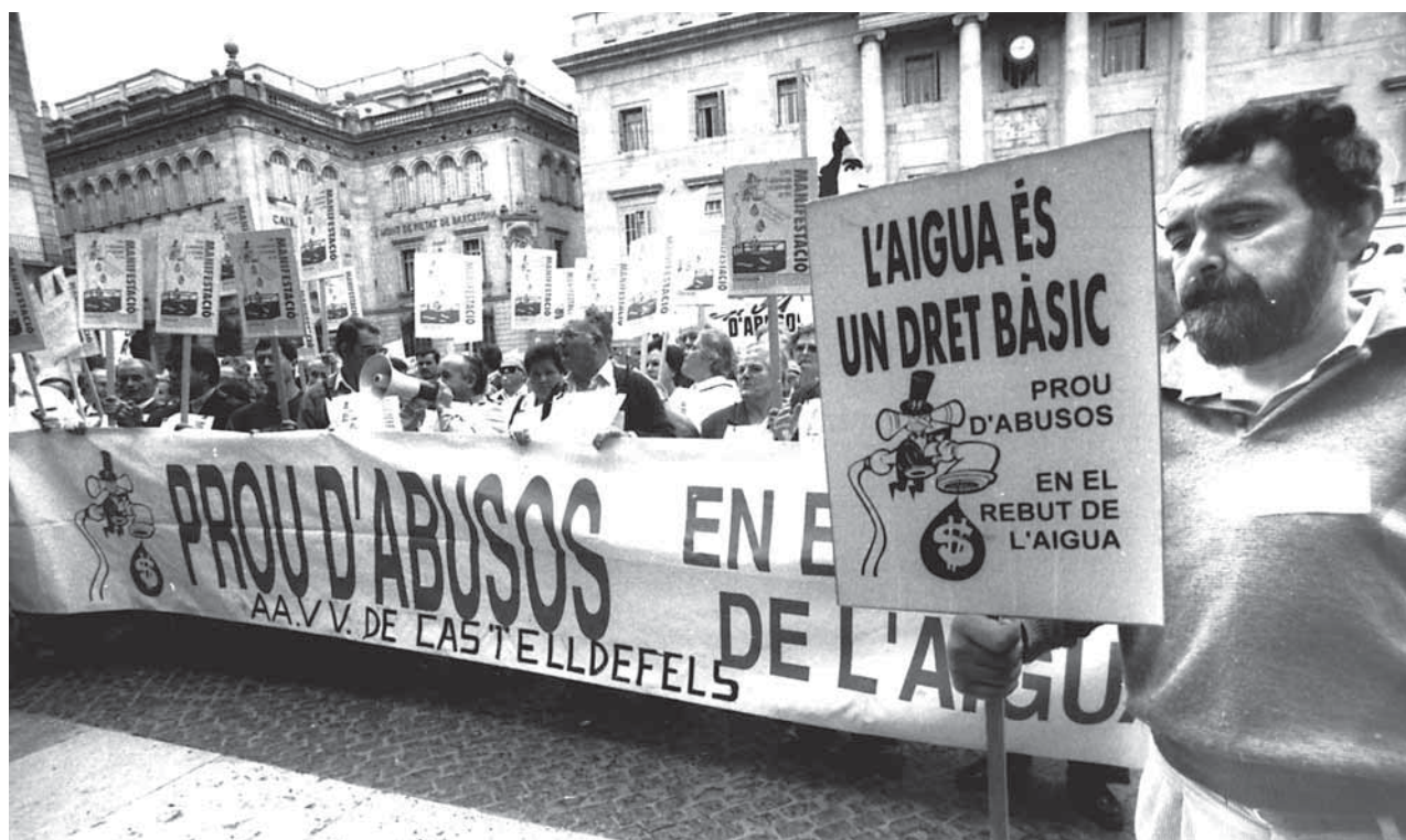
Manifestació del 5 de novembre de 1995