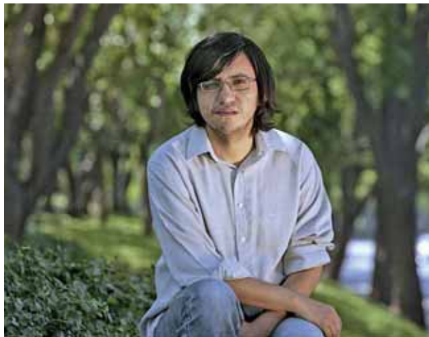
El xilè representa la generació post-Bolaño / MABEL MALDONADO

Fons i forma es fonen en la novel·la, que funciona com l'eco de la història nacional sobre un individu. Algunes escenes i diàlegs del llibre es repeteixen en la mateixa mesura que es repeteix l'obsessió pel passat immediat que té el seu personatge principal. En aquest sentit, l'obra és rodona i digna de ser ressenyada. Però no tot és positiu en la novel·la de Zambra. Alguns fragments pequen de sentimentals; les reflexions sobre la lectura i la memòria són poètiques i estimulants, però la descripció de les seves relacions amb les dones -Claudia i Eme, l'exnòvia que volia aparèixer en una novel·la- és rebuscada, innecessàriament filosòfica. Tot i que la transcripció de la seva ruptura amb Eme forma part del procés psicològic del protagonista i de la llista de passats que cal digerir, l'autor no ha aconseguit que l'anècdota d'aquesta noia m'interessi. La literatura i la història personal de Bolaño formen part del gènere d'acció, estan carregades d'emocions fortes i aventures. Zambra és lector de Bolaño -vegeu Roberto Bolaño o la escritura como tauromaquia (2002)- i és més reflexiu, tendeix més a pensar en el pas del temps assegut sota una olivera. Bolaño ens fa somiar i Zambra ens obliga a tocar tristament de peus a terra. Però tots dos són justos i necessaris perquè, al capdavant, cadascú de nosaltres s'ha de limitar a escriure la pròpia història. ◀