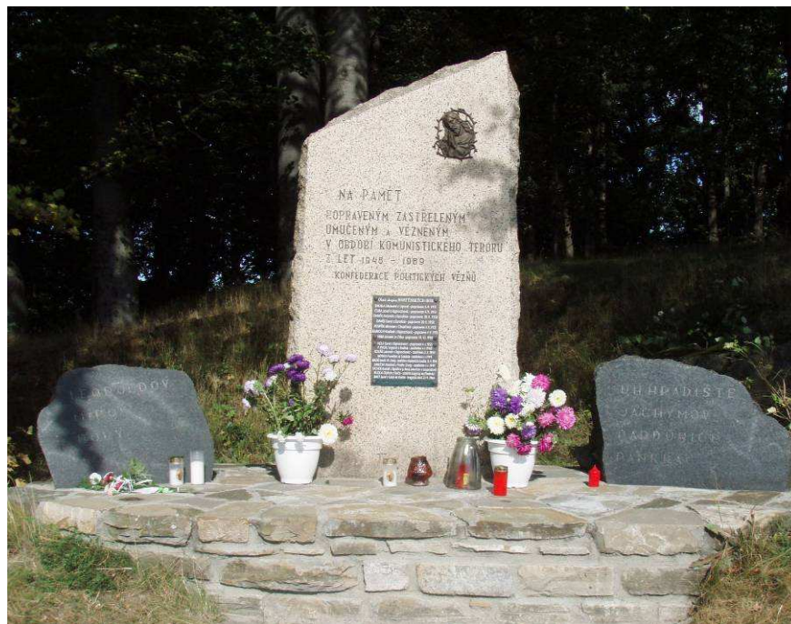
Památník obětí komunismu před pietním aktem, Svatý Hostýn 6. září 2008