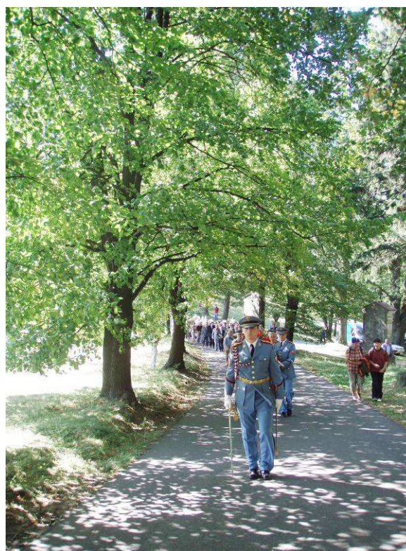
slavnostní průvod k památníku obětem komunismu, Svatý Hostýn 6. září 2008