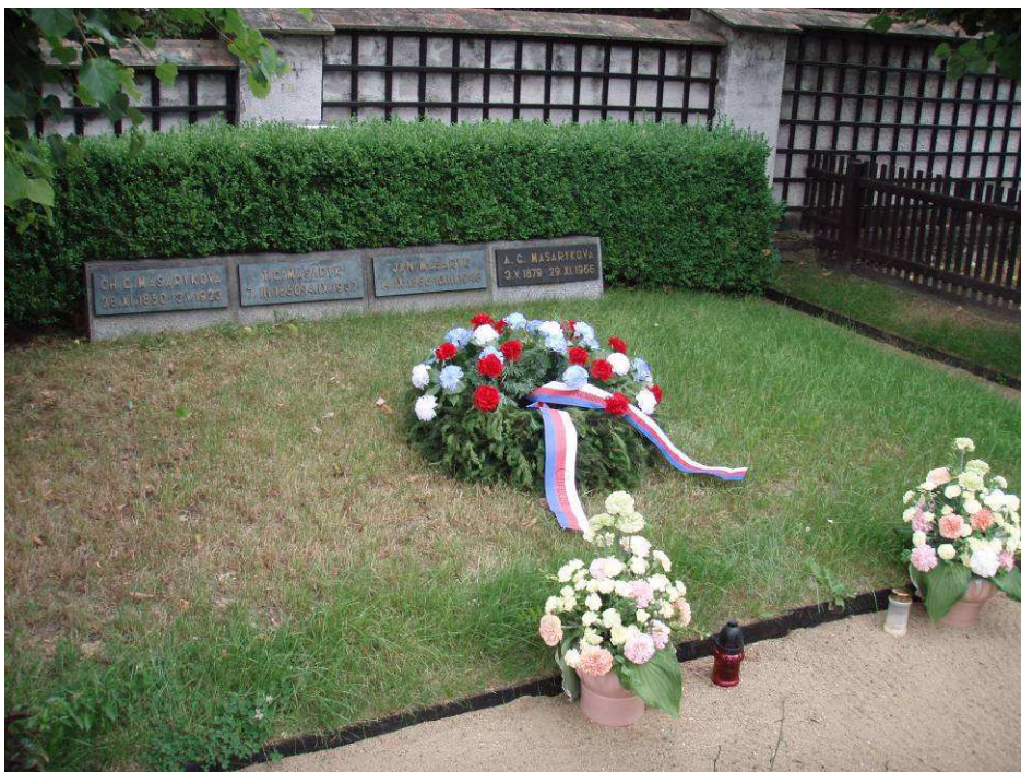
Zdroj: Autorčin domácí archiv, Lány 2008 – položení věnce na rodinnou hrobku Masaryků