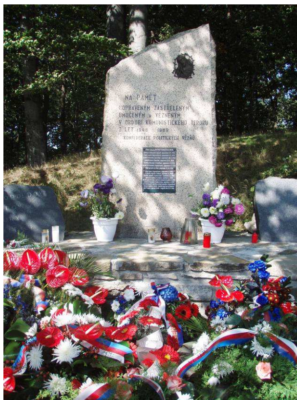
Památník obětí komunismu po pietním aktu, Svatý Hostýn 6. září 2008