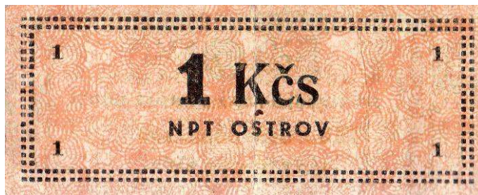
Lícová strana peněz, kterými se platilo v nápravném pracovním táboře Svatopluk na Jáchymovsku (skutečná velikost)