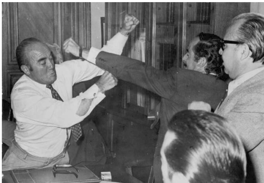
Jorge Insunza y Juan Acevedo peleando con el diputado del Partido Nacional Fernando Maturana, a la izquierda, en una sesión de la Comisión Investigadora del Cobre de la Cámara de Diputados, en 1971.