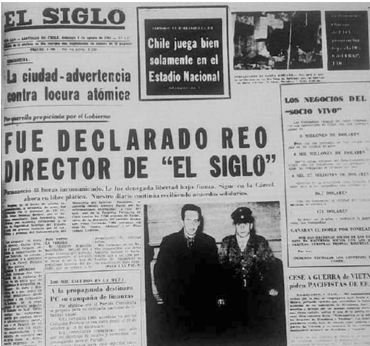
Portada de “El Siglo” del 8 de agosto de 1965, informando la detención y encaratoria de reo de Jorge Insunza por una querrella por Ley de Seguridad Interior del Estado interpuesta por el Gobierno Frei Montalva, por las denuncias del diario contra la represión a trabajadores portuarios de Valparaíso, a pobladores de Santa Andriana y las revelaciones del Plan Camelot.