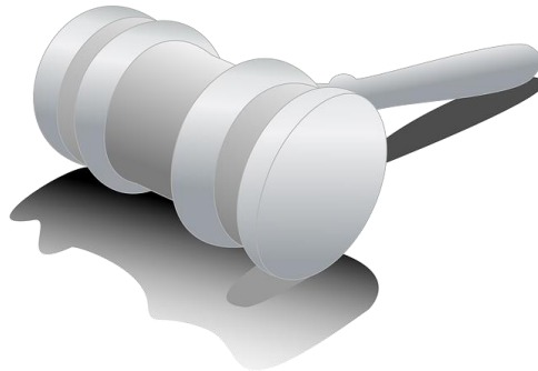
Responsabilidad penal y punibilidad

El nuevo Código Nacional Procesal Penal incorpora en nuestro derecho un modelo acusatorio, garantista y con rasgos adversariales. Ello, más que un cambio normativo implica un cambio cultural, porque se reemplaza la totalidad de paradigmas existentes en materia de administración de justicia penal.