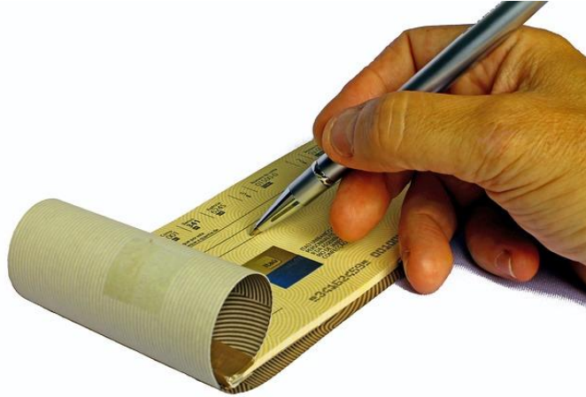
Títulos de crédito

Dentro de los tipos de obligaciones que se generan con la realización de determinados actos jurídicos, encontramos en el Derecho Mercantil el título de crédito. En esta sesión, entenderás que la calidad especial que éste entraña deviene no sólo de su denominación, sino del entendimiento de dos cuestiones fundamentales: el derecho literal que se consigna y la ejecución aparejada que trae el título.