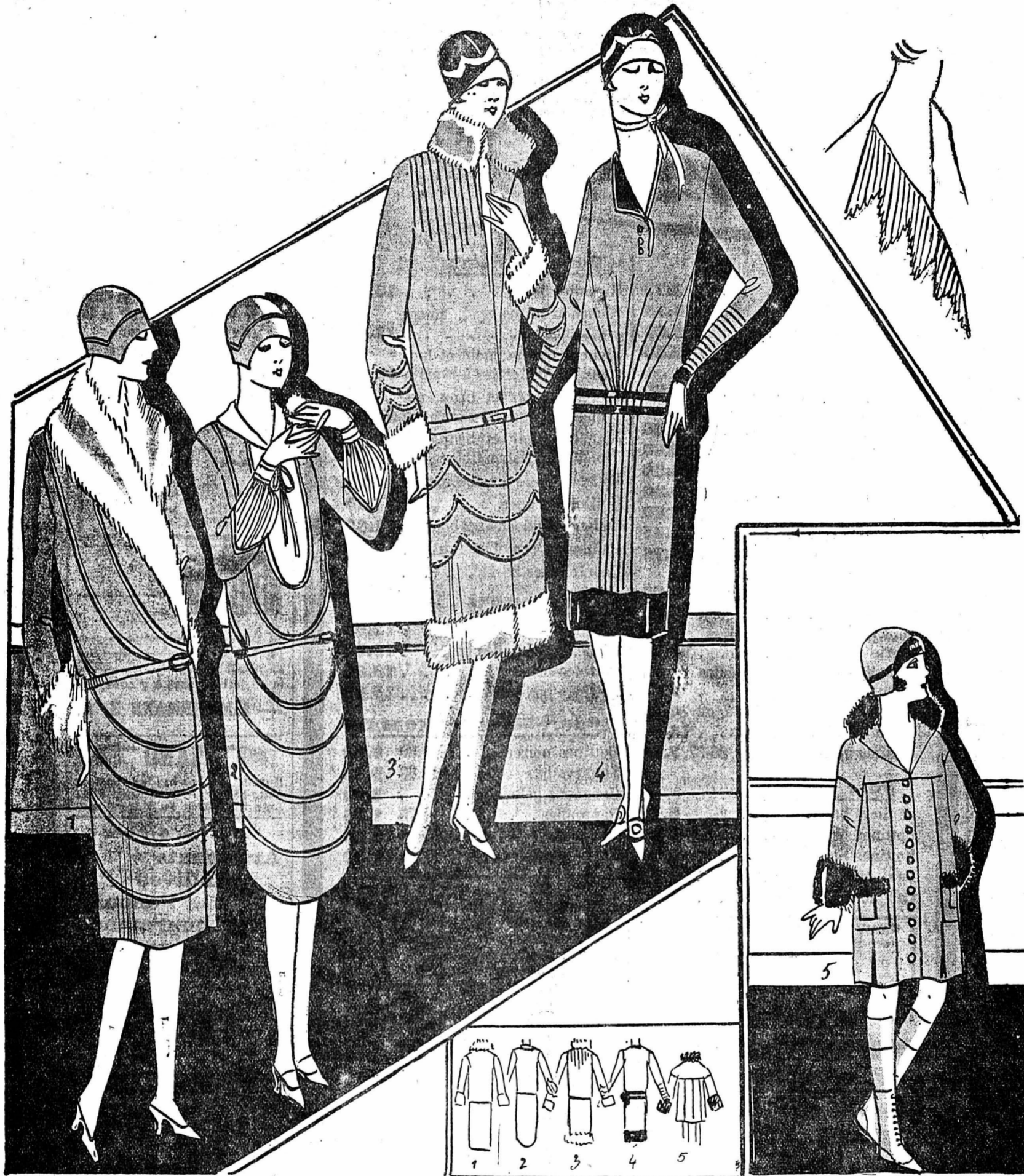
PANORAMA TOILETTES. — 1. et 2. Robe et manteau de drap beige garnis de nervures. Métrage manteau 3 m. 50 en 130. Robe 3 m. en 130. 3. Manteau crêpe marocain bleu marine et fourrure beige. Métrage 3 m. 80 en 1 m. 4. Robe crêpe de Chine marine ou beige garnie de satin noir et de broderie de chaînette noire. Métrage 3 m. 70 en 1 m. 5. Manteau de drap fraise garni de loutre. Métrage 2 m. 50 en 140 cm.

Même en vendant très cher, beaucoup de couturiers, ne s'y retrouvent plus. La Parisienne a déserté leurs salons, emmenant souvent avec elle ses amies étrangères, et le commissionnaire, l'acheteur américain ne trouvant dans ces salons déserts que des robes, ou quelconques, ou trop coûteuses, aisément récupérables, et à des prix astronomiques, s'abstient à son tour et s'en va à Berlin ou à Vienne en acheter les adroites recopies. Paul-Louis de GIAFFERRI.