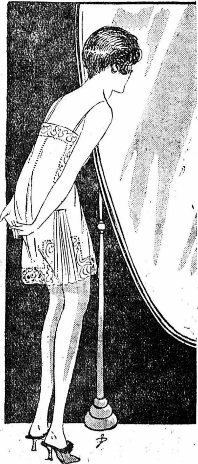
CHEMISE-JUPON. — Très pratique, cette chemise-jupon, placée sur la ceinture et le pantalon, est en crêpe de Chine paille, encadré de dentelle du même ton. L'ampleur des côtés est donnée par des volants incrustés plissés fin.