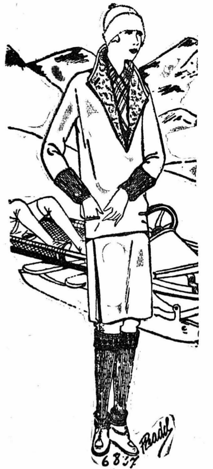
COSTUME DE SPORT. — Ce costume se compose de la veste en cuir blanc, s'enfilant par la tête et doublé de mouflon blanc, et d'une culotte de drap blanc sur laquelle on posera une courte jupe de drap, fendue sur les côtés.

Sous la veste, on glissera une écharpe aux couleurs vives assorties aux bas. Le bonnet et les gants sont en laine blanche.