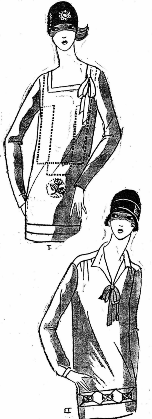
DEUX BLOUSES. — 1. En toile de soie crème garnie de jours à fils tirés et d'un motif de broderie de couleur. — 2. Chine vert pâle brodé de deux tons de vert.

Sous la veste, on glissera une écharpe aux couleurs vives assorties aux bas. Le bonnet et les gants sont en laine blanche.