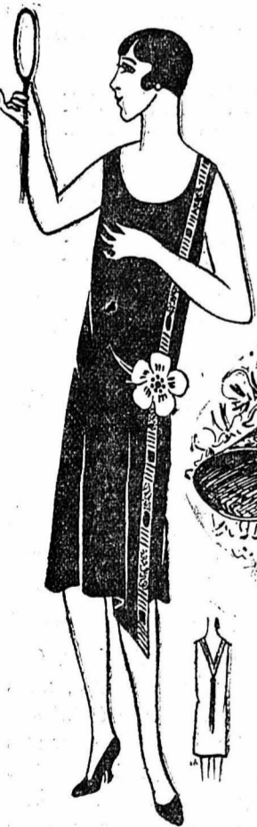
ROBE. — Robe en velours vert foncé. Joli galon perlé formant la fermeture de la robe. Gracieuse fleur en lamé argent.