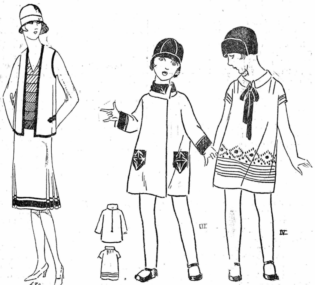
COSTUME. — Costume en soie blanche orné de cuir rouge en bandes ; la jupe est à godets sur les côtés. Le corsage est en bandes dégradées allant du rouge au blanc.