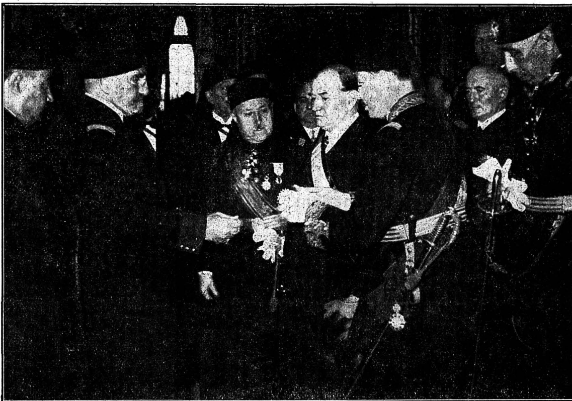
Le bey, de Tunis (à gauche) s'entretient avec M. Daladier au cours de la réception offerte au président du conseil

Quinze mille hommes défilèrent à Ain-Tounine. A cette troupe régulière du sud, il faudrait demain ajouter les milliers de fusils de ces tribus qui saluèrent le chef du gouvernement, qui lui apportèrent par