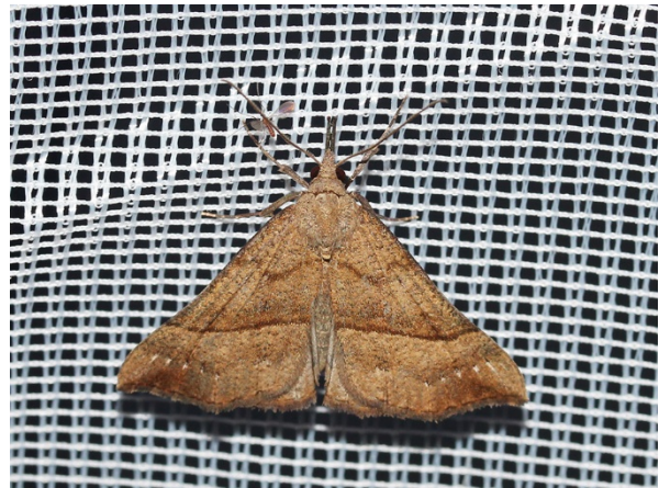
Abb. 10: Nessel-Schnabeule ( Hypena proboscidalis) am Leuchtturm. Nachtfalter, dessen Raupe ausschließlich an Brennnessel frisst (02.06.2020, Bochum-Laer,).