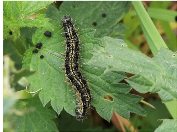
Abb. 8: Kleiner Fuchs ( Aglais urticae), Raupe auf Großer Brennnessel (13.05.2021, Bochum-Laer,).