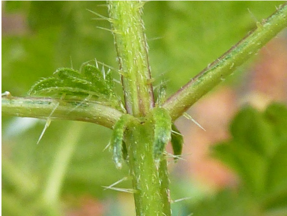
Abb. 15: Große Brennnessel, Nebenblätter (26.10.2014, Bochum,).