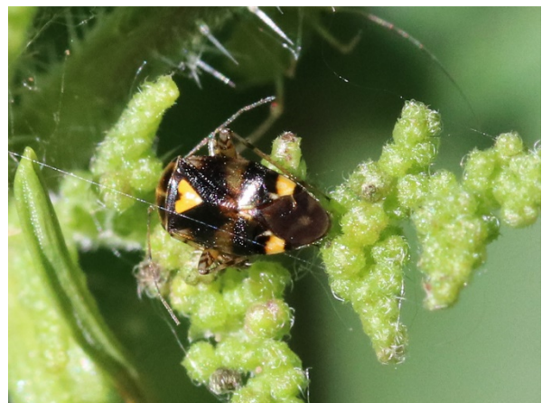
Abb. 12: Gepunktete Nesselwanze ( Liocoris tripustulatus) auf Großer Brennnessel. Eine Wanzenart, die sich wahrscheinlich ausschließlich von Pflanzensäften der Brennnessel ernährt (08.06.2019, Bochum-Laer,).