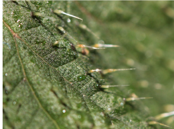
Abb. 16: Große Brennnessel, Blattoberseite mit Brennhaaren (23.01.2016,).