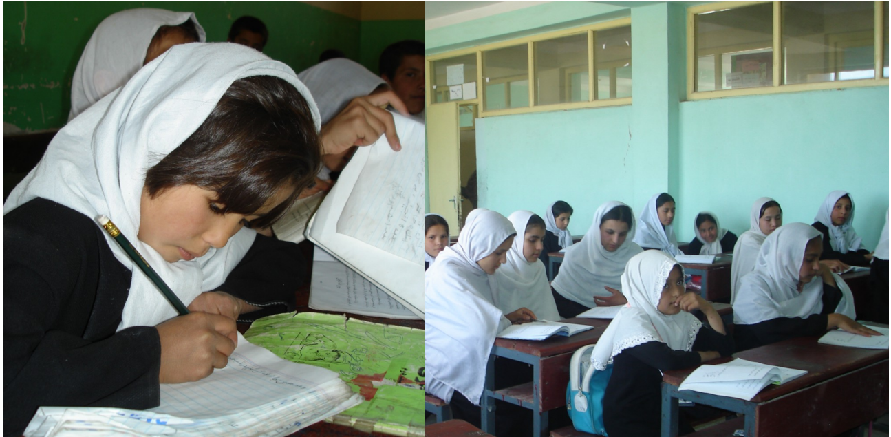
افغانی نجونې په ټولګی کې.