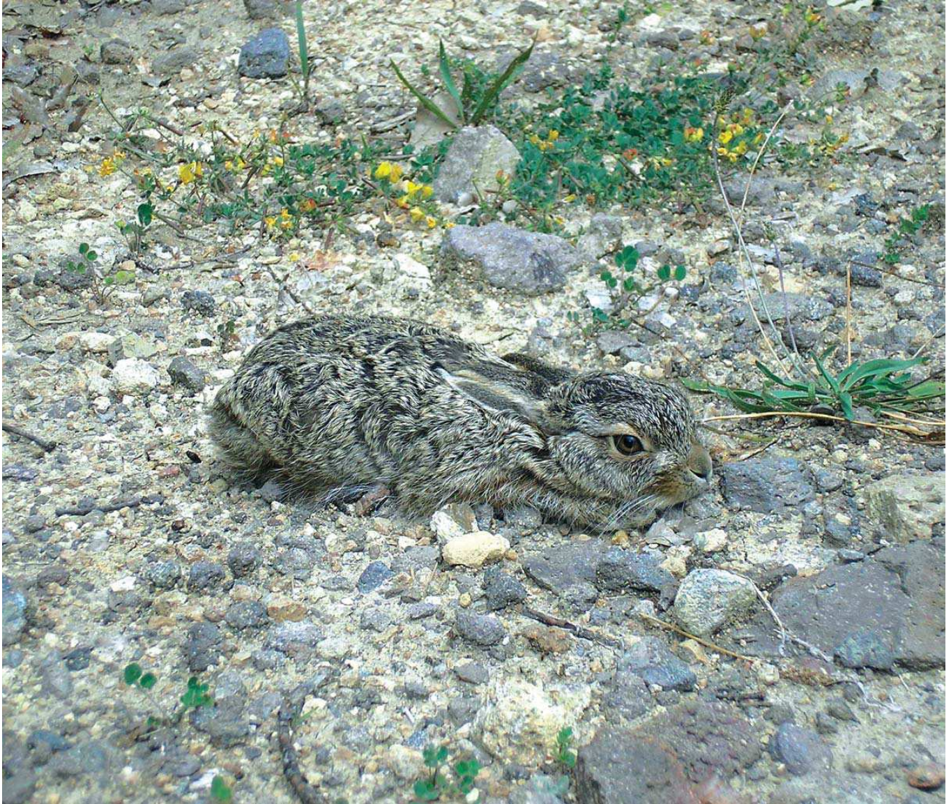
Yaban tavşanı ( Lepus europaeus )