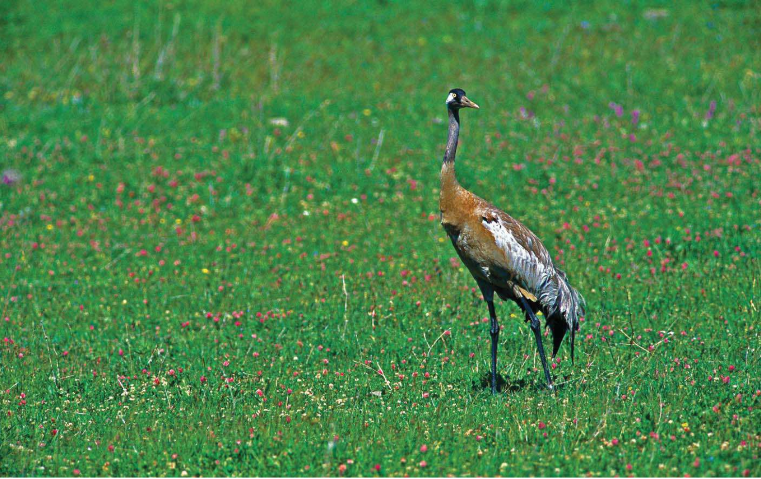
Turna ( Grus grus )

Yüzölçümü : 4240 ha Boylam : 42,90°D Enlem : 39,04°K Koruma Statüleri : Yok Yükseklik : 1780 m - 1840 m İl(ler) : Ağrı İlçe(ler) : Patnos