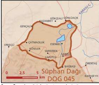
Sarısu Ovası önemli doğa alanı topografya haritası