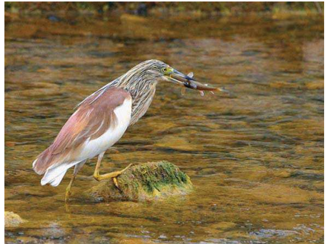
Alaca balıkçıl ( Ardeola ralloides )

■ Koruma Çalışmaları : Bilinen bir koruma çalışması yoktur.