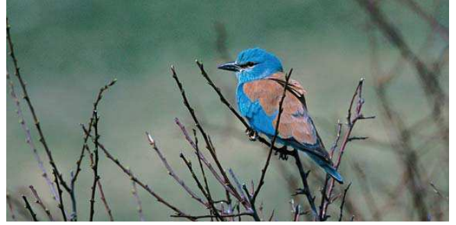
Gökkuzgun ( Coracias garrulus )