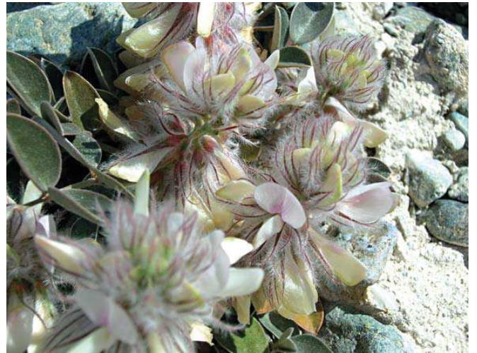
Hedysarum cappadocicum

■ Koruma Çalışmaları : Alan, 1986 yılından beri milli park statüsüne sahiptir.