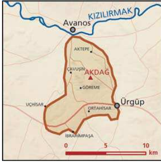
Göreme önemli doğa alanı topografya haritası