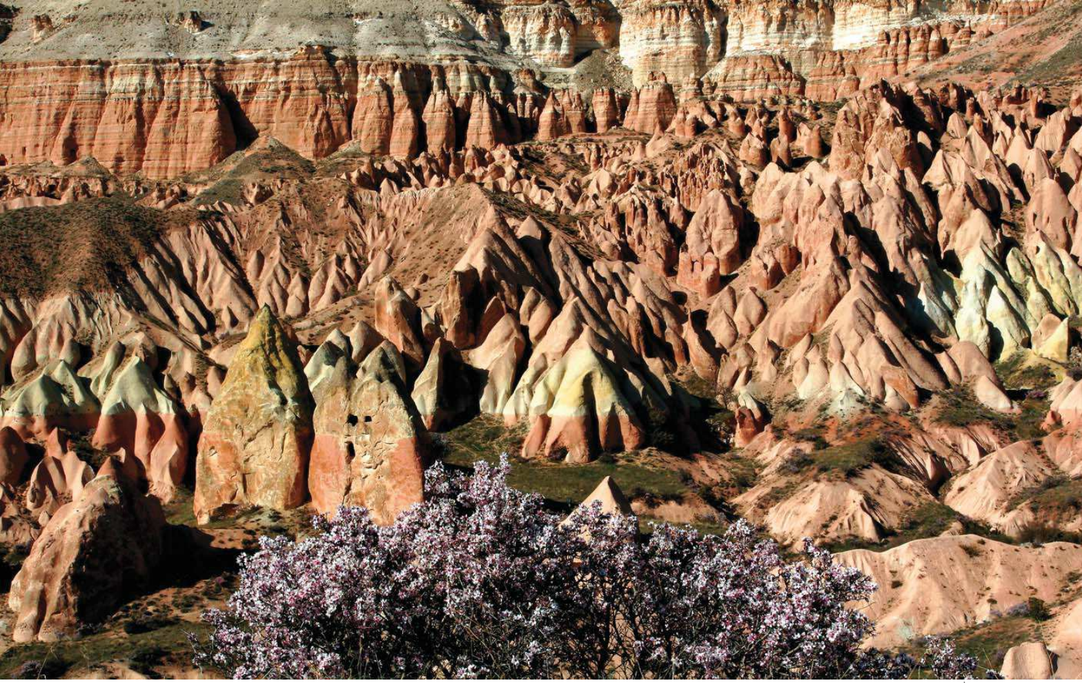
Kızılçukur © Ali İhsan Gökçen

Yüzölçümü : 6871 ha Boylam : 34,86°D Enlem : 38,65°K Koruma Statüleri : Milli park Yükseklik : 935 m - 1320 m il(ler) : Nevşehir İlçe(ler) : Nevşehir merkez, Avanos, Ürgüp