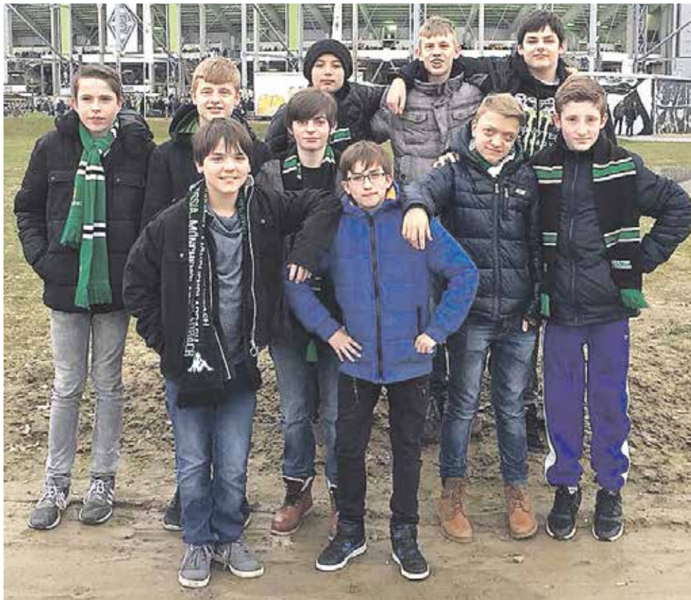
Wir möchten uns beim Fanclub Generation Borussia für die Unterstützung und die tolle Fahrt zum Bundesligaspiel gegen den FC Schalke 04 bedanken. Es war ein super Erlebnis für uns und wir haben ein klasse Spiel mit vielen Toren gesehen. Wir drücken Euch die Daumen für das Weiterkommen in der Euro-Parade – die Jungs der Klasse 8a der St. Felicitas-Schule!