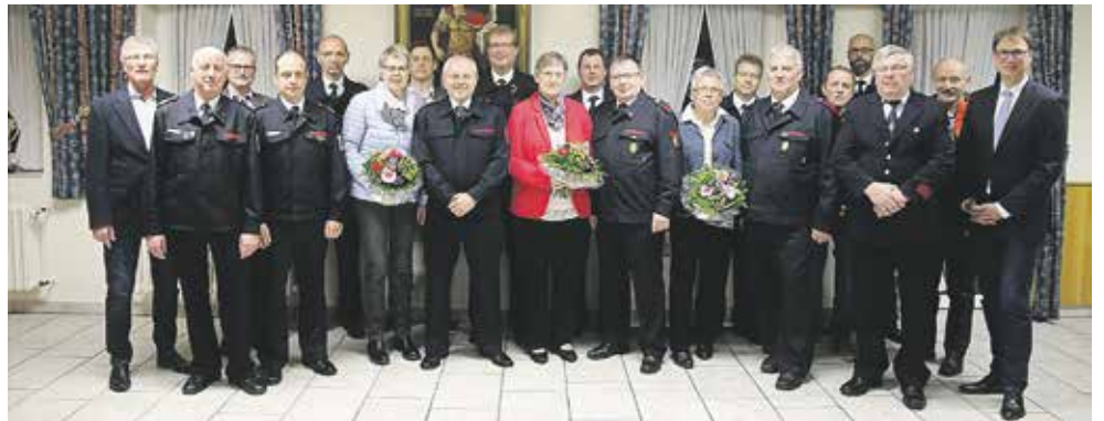
Übertritt aus dem aktiven Dienst in die Ehrenabteilung