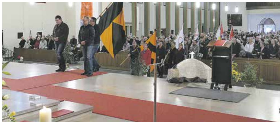
Zahlreiche Bannerabordnungen nahmen am Gottesdienst teil