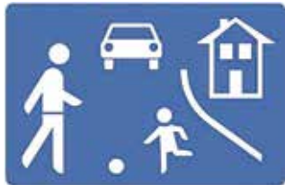
Verkehrszeichen 325.1 Beginn eines verkehrsberuhigten Bereichs

In letzter Zeit häufen sich die Beschwerden von Anwohnern, dass in den verkehrsberuhigten Bereichen (Spielstraßen) vermehrt außerhalb der gekennzeichneten Parkflächen geparkt wird.