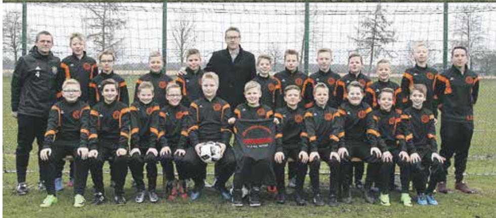
Die D-Jugend der Jugendspielgemeinschaft Lünten/Ammeloe kann mit neuen Trikots und neuen Trainingsanzügen in die Rückrunde starten. Ein herzliches Dankeschön möchten Mannschaft, Trainer und Betreuer an Sport Niehuis und die STRABAG AG für die großzügigen Spenden richten.