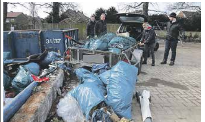
Aktion „Saubere Landschaft“

kräftig bei dieser Aktion mit anzufassen. Kinder unter 12 Jahren dürfen leider nur in Begleitung Erwachsener mitmachen. Schön wäre es, wenn an diesem Wochenende auch die Vredener Gewerbetreibenden ihre Gewerbegrundstücke und Anlieger von roten Wegen, Spielplätzen oder Grünflächen diese von herumliegendem Müll befreien würden.