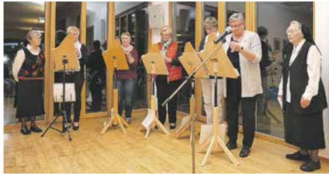
Die Schwestern und die Vehharfengruppe