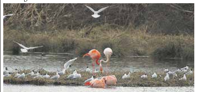
Im Zwillbrocker Venn sind die ersten Flamingos sowie die Lachmöwen wieder eingetroffen