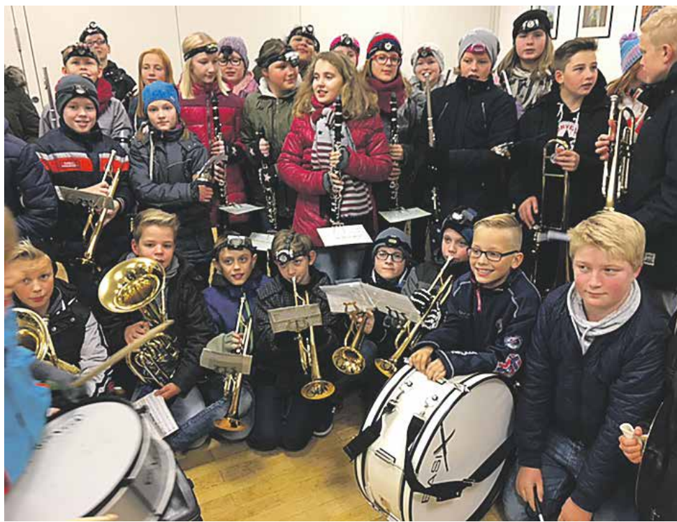
Drumband/Bläser Klasse der Sekundarschule in Vreden führt musikalisch durch das Programm

bietungen bei Kaffee und Kuchen freuen. Kuchenspenden sind herzlichst willkommen und können ab 10.00 Uhr in der Schützenhalle abgegeben werden.