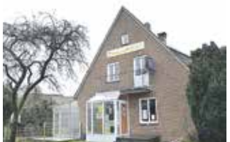
Der jetzige Standort des 4U in der Gartenstraße

vorschlag erarbeiten. Das Ergebnis wird Ende April in einer gemeinsamen Sitzung des Bau-, Planungs- und Umweltausschusses, des Bildungs-, Sport- und Kulturausschusses und des Ausschusses für Soziales, Generationen und Ehrenamt präsentiert werden. Die Möglichkeit eine Landesförderung zu erhalten, erfordert eine zeitnahe Lösung, denn Projektanträge für das neu aufgelegte Städtebauförderprogramm „Investitionspakt Soziale Integration im Quartier NRW 2017“ müssen bis Mittwoch, den 3. Mai 2017, eingereicht werden. Die endgültige Beschlussfassung obliegt dem Haupt- und Finanzausschuss am Donnerstag, dem 27. April 2017.