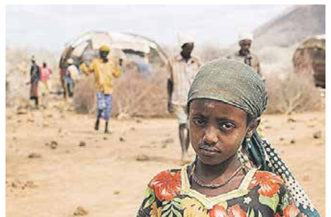
Im Norden Kenias hat es seit Monaten nicht mehr geregnet.

Osten des afrikanischen Kontinents sind vom Hungertod bedroht. Kinder und alte Menschen leiden besonders unter der Nahrungsmittelknappheit, auch Wasser ist zu einem wahren Luxusgut geworden. Caritas international arbeitet schon seit vielen Jahren mit seinen Partnern in der Region zusammen. Gemeinsam wird versucht, die Menschen in der Region dabei zu unterstützen, sich auf die langen Trockenperioden vorzubereiten.