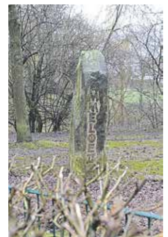
Gedenkstein zur Flurbereinigung

E instimmig haben die Mitglieder des Bau-, Planungs- und Umweltausschusses die Versetzung des Gedenkstein um nur wenige Meter auf die andere Seite des Weges beschlossen. Derzeit steht der Gedenkstein innerhalb der Hundeauslaufläche an der Berkel in Höhe des Friedhofes und ist durch eine Zaunanlage und Hecke vom Weg getrennt und wird somit kaum wahrgenommen. Die Schriftzüge und Motive beziehen sich auf die Flurbereinigung von Vreden und Ammeloe. Am neuen Standort wird der Gedenkstein rundum begehbar sein.