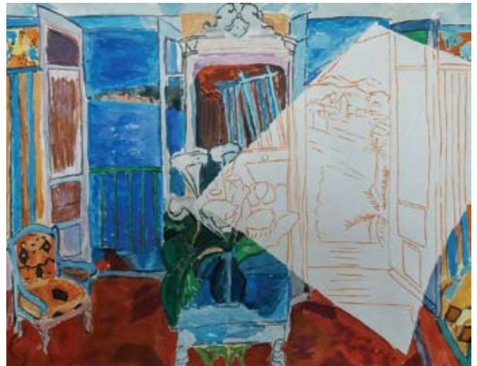
Lenasi Svetlana, Reinterpretacija + dekonstrukcija slike (Raoul Dufy)