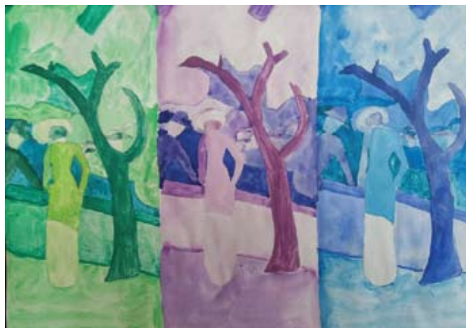
Ida Obučina, Detalj, repeticija, izbor palete (August Moke)