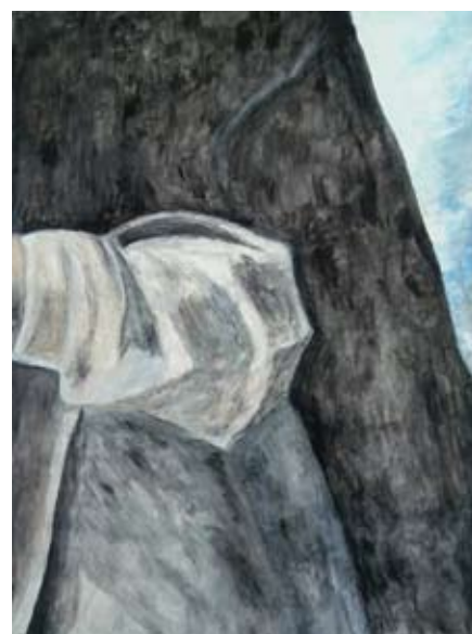
Miroslav Medurić, Detalj, uvećanje (El Greko)

video, skulpture, ambient, inštalacije, fotografije).