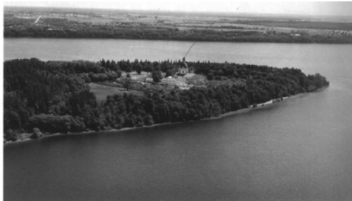
Surfote: panoramo de Pažaislis, vd.DTI

Fine de julio kaj komence de aŭgusto en Litovio estas kutime varme (+20-25 C). Kelkfoje pluvas. Sed, oni devas ne forgesi, ke la proksimiĝanta aŭtuno jam estas sentebla kaj la vesperoj estas sufiĉe malvarmaj. Do, ne forgesu kunporti puloveron kaj palton (precipe, se vi intencas viziti la marbordon).