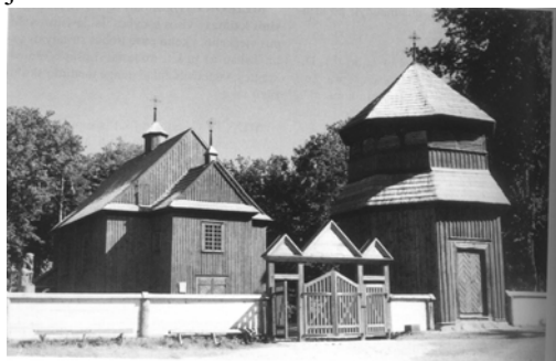
(Preĝejo en Palūšė)

7. Ĉiu vendado de varoj en ILEI-Konferenco bezonas antaŭan aprobon de la Estraro, kiu starigas la kondiĉojn. Skriba peto pri tia agado estu liverita al la Estrarano pri Konferencoj nepre antaŭ la 30-a de junio de la konferenca jaro."