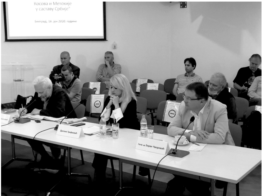
Округли сто – избори и КИМ, јун 2020. године