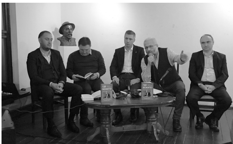
Представљање књиге Бошка Обрадовића „Где бежите“ 23. 12. 2019, Београд, Скадарлија