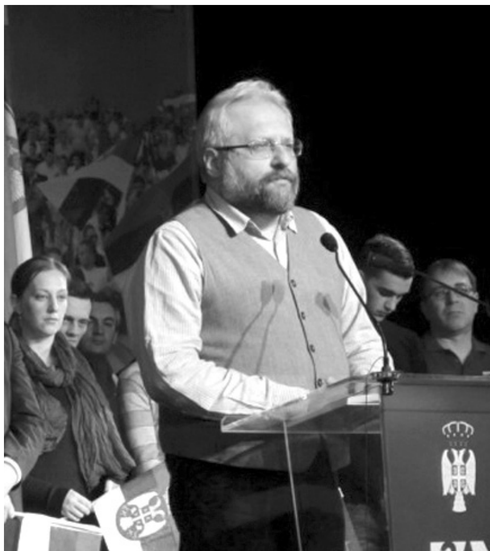
Говор на Сабору Двери