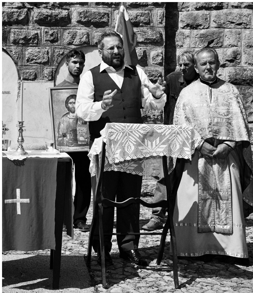
Говор на Сабору у Орашцу