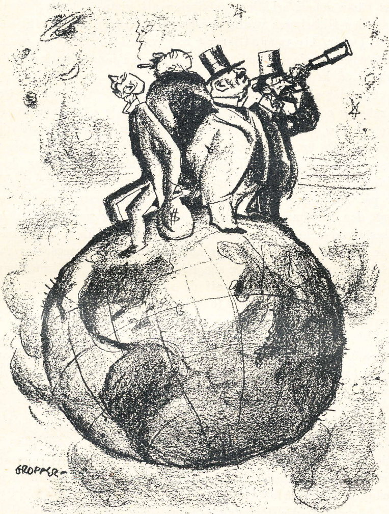
Kapitalismen utan avsättning, söker undvika handel med Sovjetryssland. (Liberator.)

organiserad byråkrati, en stark domstolsapparat, en stark polis- makt samt slutligen armén och flottan. Värnplikt finns icke; där- för är armén rekryterad av frivilliga, som är inlogerade i ka- serner och står främmande för folket. Marinen, den härskande klassens stolthet, står måhända i ännu högre grad isolerad från folkets massor. Det är blott sällan, som matroserna, arbetarklas-