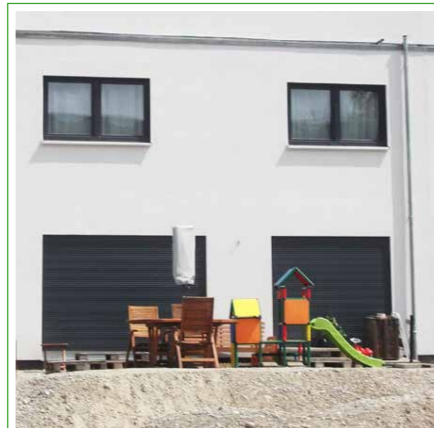
Ist der Spielplatz noch so klein, das Häuschen jedoch ist mein.

Wie will ich leben? - Kreativ-Seminar: Sa., 25.6.22, v. 13 – 18 Uhr