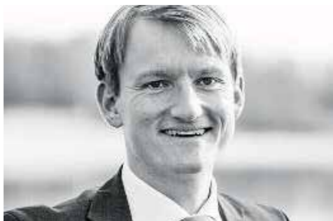
Sebastian Thaler | Bürgermeister

Gemeinde Eching, Bürgerplatz 1, 85386 Eching, Telefon: 089 / 319000-0, Telefax: 089 / 319000-1099, E-Mail: gemeinde@eching.de