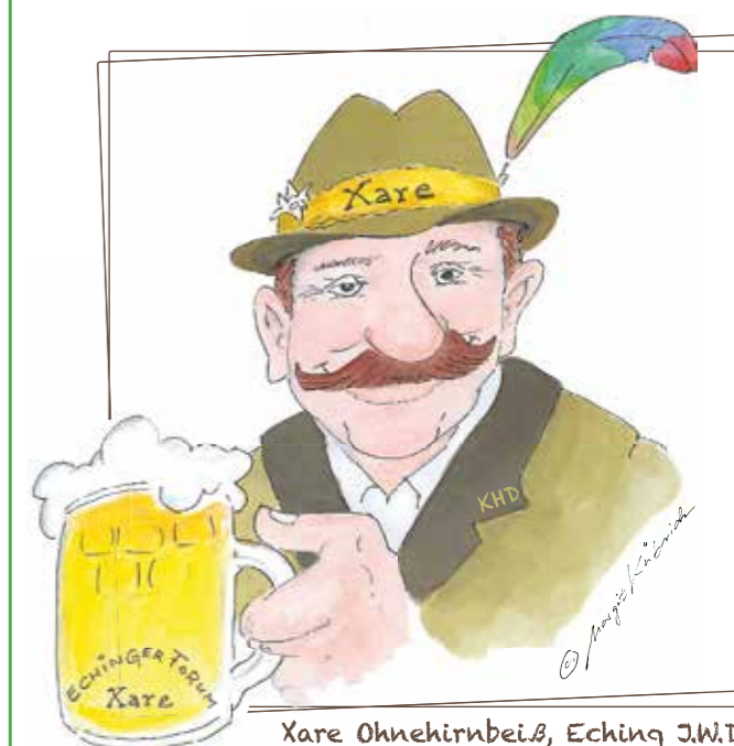
Xare Ohnehirnbeiß, Eching J.W.D.