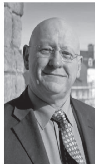
Hywel Williams Aelod Seneddol Etholaeth Arfon

Os oes gennych fater yr hoffech ei drafod gyda'ch AS mewn cymhorthfa, yna cysylltwch ag ef yn ei swyddfa yng Nghaernarfon neu ym Mangor