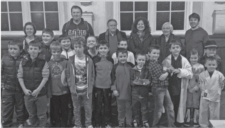
Y cystadleuwyr, y trefnwyr a'r beirniad.

Syniad bechgyn ifanc dosbarth hynaf yr Ysgol Sul unedig yng Nghapel Coch, Llanberis oedd cynnal 'Capel Got Talent' er mwyn codi arian at Apêl Guatemala Eglwys Bresbyteriaidd Cymru a Chymorth Cristnogol.