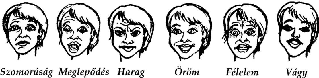
A nő érzelmi megnyilvánulásai