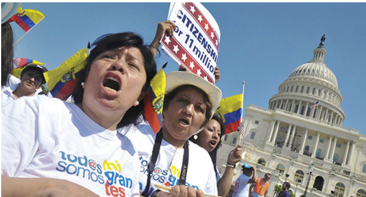
Una march en California a favor de la legalización de todos los indocumentados en EE.UU. A march in California in support of the legalization of all undocumented immigrants in the U.S.