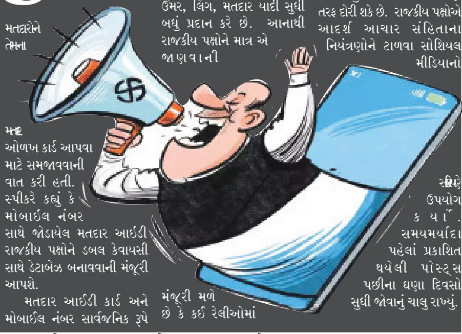
ઉપલબ્ધ મતદાર યાદી સાથે સંકલિત, નામ, સરનામું, સ્થાન, ઉંમર, લિંગ, મતદાર યાદી સુધી બધું પ્રદાન કરે છે. આનાથી રાજકીય પક્ષોને માત્ર એ જાણવાની સ્ક્રીન ઉપયોગ કરવાની સમયમર્યાદા પહેલાં પ્રકાશિત થયેલી પોસ્ટ્સ પછીના ઘણા દિવસો સુધી જોવાનું ચાલુ રાખ્યું.

અહીં શું, ત્યાં શું... વધુ સારી, ઝડપી અને સસ્તા સાધનો સાથે ખોટી માહિતી પેદા કરવાની અને ફેલાવવાની ક્ષમતામાં સુધારો થયો છે. કાલ્પનિક, આર્ટિફિશિયલ ઇન્ટેલિજન્સ ખોટા પ્રમાણપત્રો, એટિલાસિક રેકોર્ડની હેરફેર, નકલી મતદાન ડેટા અને વિશ્લેષણ, સિન્થેટિક સમાચાર લેખો અને નકલી દસ્તાવેજો ચૂંટણી અધિકારીઓના હોવાનો ઢોંગ કરતા વીડિયોની અપેક્ષા રાખો. વોટિંગના થોડા દિવસો પહેલા જ રીલીઝ કરવામાં આવેલ સુવ્યવસ્થિત, લક્ષ્યાંકિત, દૂષિત ઓડિયો અને ડીપફેક વિડીયોનો સામનો કરવા માટેનું સૌથી મુશ્કેલ પાસું હશે. વર્ષ ૨૦૨૪ એ લોકસભા ચૂંટણીનું વર્ષ છે. ૭૦ થી વધુ લોકશાહી એવા સમયે ચૂંટણીઓ યોજશે ન્યારે સામાન્ય એઆઈ સુલભ અને લોકપ્રિય છે, અને ડીપફેક વધુને વધુ અત્યાધુનિક બની રહ્યા છે એક દાખા પહેલા, ગુજરાતના તત્કાલિન મુખ્યમંત્રીના ચૂંટણી પ્રચારના મુખ્ય વ્યૂહરચનાકારે ભાજપને સંદેશ તરફ