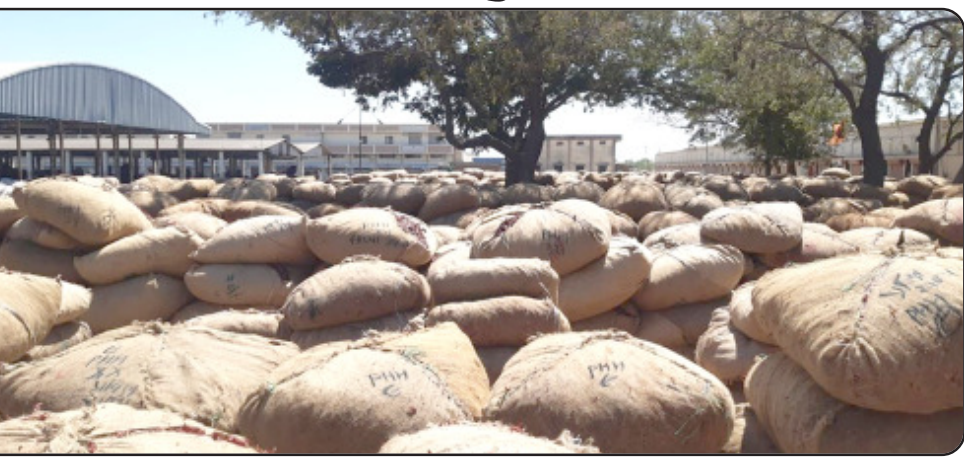
મરચાની ૧૦,૦૦૦ ભારીની જ ખેડૂતો ૨૦૫ વાલનમાં મરચા આવક થઈ હતી. વહેલી સવારથી ભરીને આવેલ હતા. જેને લઈને રવિવાર બપોરના ૧૨:૦૦ વાગ્યાથી નવી જોડેરાત ન થાય ત્યાં

સુધી મરચાની આવક બંધ કરવાની ફરજ પડી છે. જ્યાં સહિતના પ્રશ્નો ઉભા થતાં મરચાની આવક બંધ રાખવા અંગે નિર્ણય લેવામાં આવ્યો છે. હાલ મરચાની સિઝનને લઈ અને જામનગર ચાર્ડમાં છેલ્લા કેટલાક દિવસની સરખામણીએ ૧૫૦૦ રૂપિયાથી માંડી ૫૦૦૦ રૂપિયા સુધીના મણદીઠ મરચાના ભાવ મળી રહ્યા છે. જેને લઈને ખેડૂતો આ સારા ભાવને લઈ આકર્ષાય રહ્યા છે અને તેઓ પોતાનો પાક વેચવા માટે આવી રહ્યા છે. પરિણામે જામનગર ચાર્ડમાં મરચાની સારી એવી આવક નોંધાઈ રહી છે.