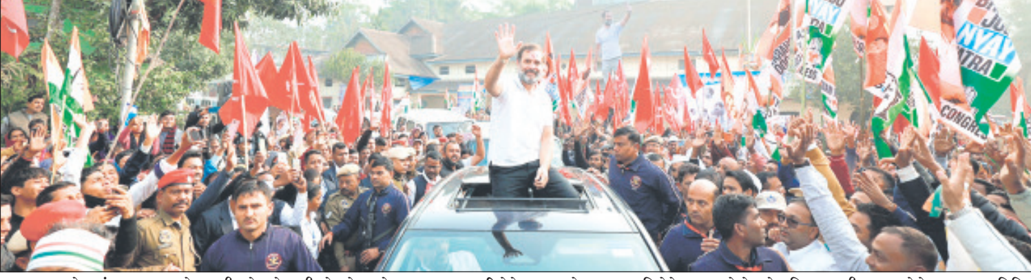
લુ.સમગ્ર દેશમાં ભાજપા જે રહી છે જેનાથી દેશને મુક્તિ મળી શકે તેવા મુદ્દાઓને લઈને આગમન કરી શકે તેવા મુદ્દાઓ, જેટલો, તમામ નાગરિકોને ન્યાય મળે ખાસ કરીને યુવાનો, મહિલાઓ, બેઝલ્ટો, શ્રમિકોને ન્યાય મળે તે માટે મણિપુર થી મુંબઈ સુધીની ૬૭૦૦ કિ.મી. ની ભારત જોડો ન્યાય યાત્રા વિવિધ રાજ્યોમાંથી પસાર થઈ રહી છે ત્યારે,

અખતક, રાજકોટ કોંગ્રેસના યુવા નેતા રાહુલ ગાંધીની ભારત જોડો ન્યાય યાત્રા ગુજરાતમાં ૭મી માર્ચના રોજ બપોરે ૩ કલાકે દાહોદ જીલ્લાના અલોદ ખાતે પ્રવેશ કરી રહી છે. ગુજરાત રાજ્યમાં ભારત જોડો ન્યાય યાત્રા ૭ જિલ્લાઓમાંથી પસાર થશે. ભારત જોડો ન્યાય યાત્રા ગુજરાત રાજ્યમાં ૪૪૫ કિ.મી.નો પ્રવાસ કરશે અને ૫ થી વધુ લોકસભા ક્ષેત્રો આવી લેવામાં આવશે. તેમ જ રાજકોટ શહેર કોંગ્રેસ સમિતિના પ્રમુખ અતુલ રાજાણીએ જણાવ્યું