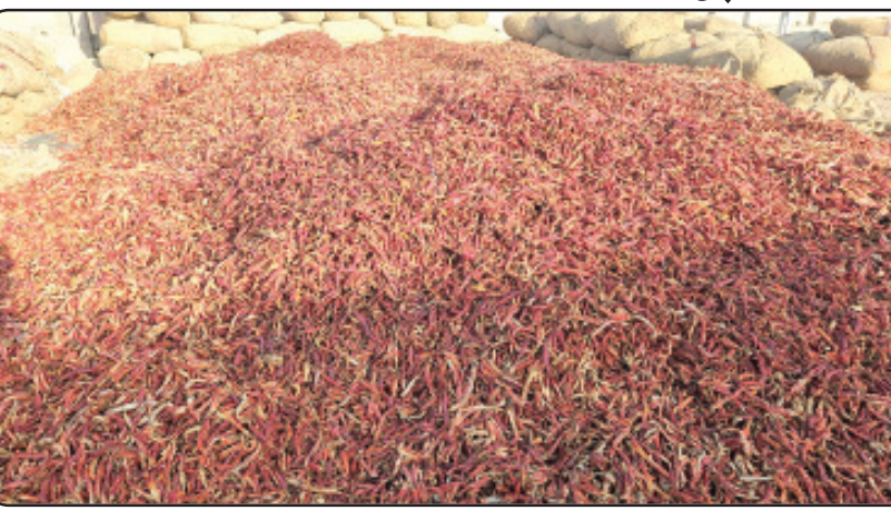
ચાર્ડમાં મરચાની આવક બંધ કરાઈ હતી. પરંતુ હવે માવઠાની મોકાણા હટતાં આવક શરૂ કરાય છે. જેને લઈને આજે મરચાની જંગી આવક નોંધાઈ હતી.

અખતક, જામનગર જામનગર જિલ્લાના સૌથી મોટા હાપા માર્કેટિંગ ચાર્ડમાં સિઝનની માફક જુદી જુદી જણસોની આવક થતી હોય છે. ત્યારે હાલ જીરુ અને કપાસની જંગી આવક જોવા મળી રહી છે. તેવામાં આજે જામનગર ચાર્ડમાં સુકા મરચાની જબરદસ્ત આવક થતા મરચાની આવક બંધ રાખવાની નોબત આવી છે. મહત્વનું છે કે હાલ સૌરાષ્ટ્રના કેટલાક વિસ્તારોમાં હવામાન વિભાગ દ્વારા માવઠાની આગાહી કરવામાં આવી હતી. જેના આગમચેતીના ભાગરૂપે જામનગર