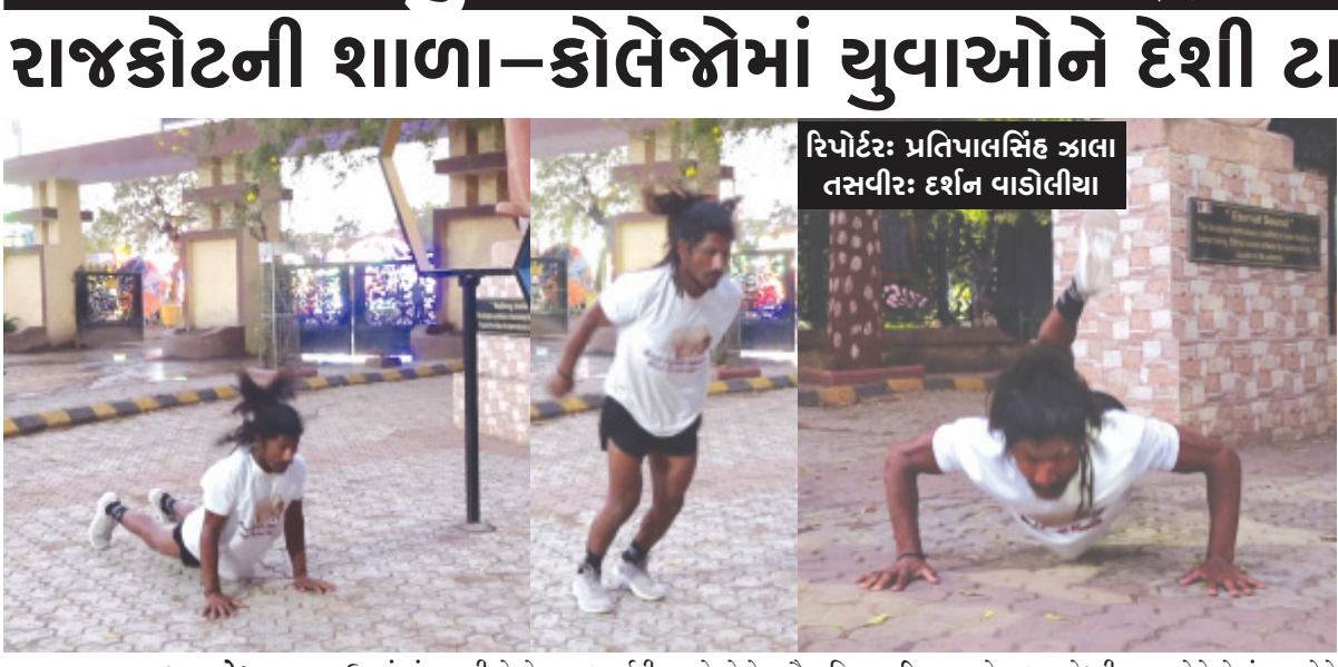
રિપોર્ટર: પ્રતિપાલસિંહ ઝાલા