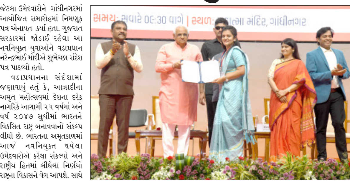
સમય: સવારે ૦૯:૩૦ વાગે | સ્થળ: લોકસભા મંદિર, ગાંધીનગર

રાજ્ય સરકારના વિવિધ વિભાગોમાં નવનિયુક્ત ૧૯૯૦ ઉમેદવારોને નિમણૂક પત્ર એનાયત અખતક, રાજકોટ મુખ્યમંત્રી ભુપેન્દ્ર પટેલે રાજ્ય સરકારના વિવિધ વિભાગોમાં સીધી ભરતીથી ૧૯૯૦ પસંદગી પામેલા કુલ ૧૯૯૦