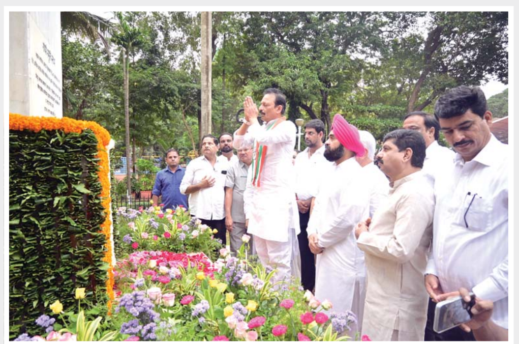
શ્રદ્ધાંજલિ: બુધવારે ઓગસ્ટ ક્રાંતિ દિન નિમિત્તે ભાજપ અને એનસીપીના નેતાઓએ ગોવાલિયા ટેમ્પલ મેદાન ખાતે ઓગસ્ટ ક્રાંતિ સ્મારકને શ્રદ્ધાંજલિ આપી હતી.