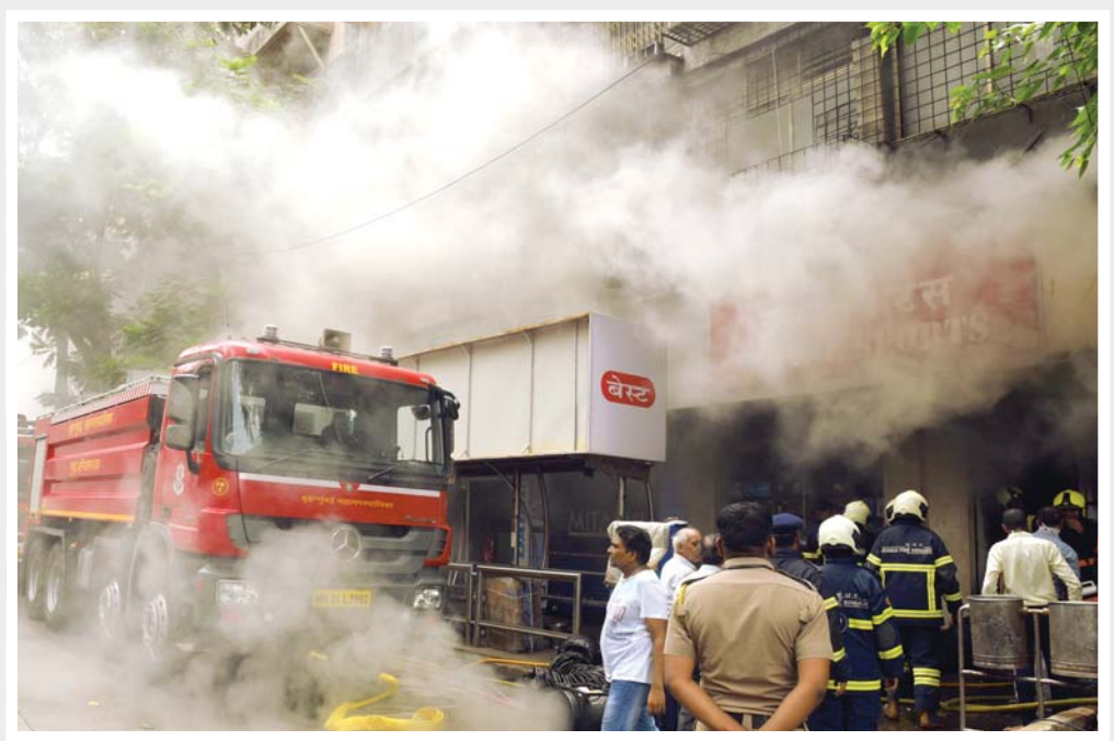
આગ: મુંબઈમાં બુધવારે મેટ્રો સિનેમા નજીક આવેલી રમતગમતના સાધનો વેચતી દુકાનમાં આગ લાગી હતી. (જયપ્રકાશ કેબલ)

મુંબઈ: દક્ષિણ મુંબઈમાં ઘોબી તળાવ પાસે સ્પોર્ટ્સ મટિરિયલની દુકાનમાં બુધવારે સવારના અચાનક આગ ફાટી નીકળી હતી. સદ્દનસીબે આગમાં કોઈ જાનહાનિ થઈ નહોતી. ડિઝાસ્ટર મેનેજમેન્ટના જણાવ્યા મુજબ ઘોબી તળાવ વિસ્તારમાં મેટ્રો સિનેમા પાસે ચમન મેન્શનમાં સ્પોર્ટ્સને લગતા સાધનોનું વેચાણ કરનારી ટાર્ક સ્પોર્ટ્સ નામની દુકાન આવેલી છે. બુધવારે સવારના લગભગ ૧૧.૧૭ વાગ્યાની આસપાસ દુકાનમાં અચાનક આગ ફાટી નીકળી હતી. ઘટના સ્થળે ફાયરબ્રિગેડ પહોંચી ગઈ હતી અને આગ બુઝાવવાની કામગીરી હાથ ધરી હતી. આગમાં દુકાનને નુકસાન થયું હતું. પરંતુ સદ્દનસીબે કોઈ જાનમી થયું નહોતું. આગનું ચોક્કસ કારણ જાણી શકાયું નહોતું. પરંતુ પ્રાથમિક તપાસમાં શોર્ટ સર્કિટને કારણે આગ લાગી હોવાનું માનવામાં આવે છે. ■