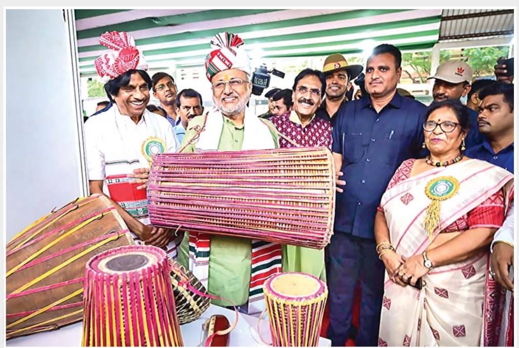
દમ દમ હોત ખાણે: રાંચી યુનિવર્સિટીએ 'વર્લ્ડ ટ્રાઈબલ ડે' નિમિત્તે યોજેલા કાર્યક્રમમાં ઝારખંડના રાજ્યપાલ સી.પી. રાધાકૃષ્ણને પરંપરાગત ઢોલ પર હાથ અજમાવ્યો હતો. (પીટીઆઈ)

જેસલમેર: રાજસ્થાનના જેસલમેર જિલ્લામાં સરહદી વિસ્તાર નજીક 'પાકિસ્તાન ઇન્ટરનેશનલ એરલાઈન્સ' લખેલો એરોપ્લેન આકારનું બલૂન મળ્યું હતું. સોમવારે સાંજે નાગરાજા ગામમાં કેટલાક સ્થાનિકો એ હવા નીકળેલા લીલા અને સફેદ બલૂન જોયા હતા. 'પાકિસ્તાન ઇન્ટરનેશનલ એરલાઈન્સ', 'એસજીએ' અને ઉર્દૂમાં કેટલાક શબ્દો એરોપ્લેન જેવા આકારના બલૂન પર લખેલા છે. તેઓએ કહ્યું કે બલૂનમાં કોઈ શંકાસ્પદ વસ્તુ મળી નથી અને આ મામલે તપાસ કરવામાં આવી રહી છે. (પીટીઆઈ)■