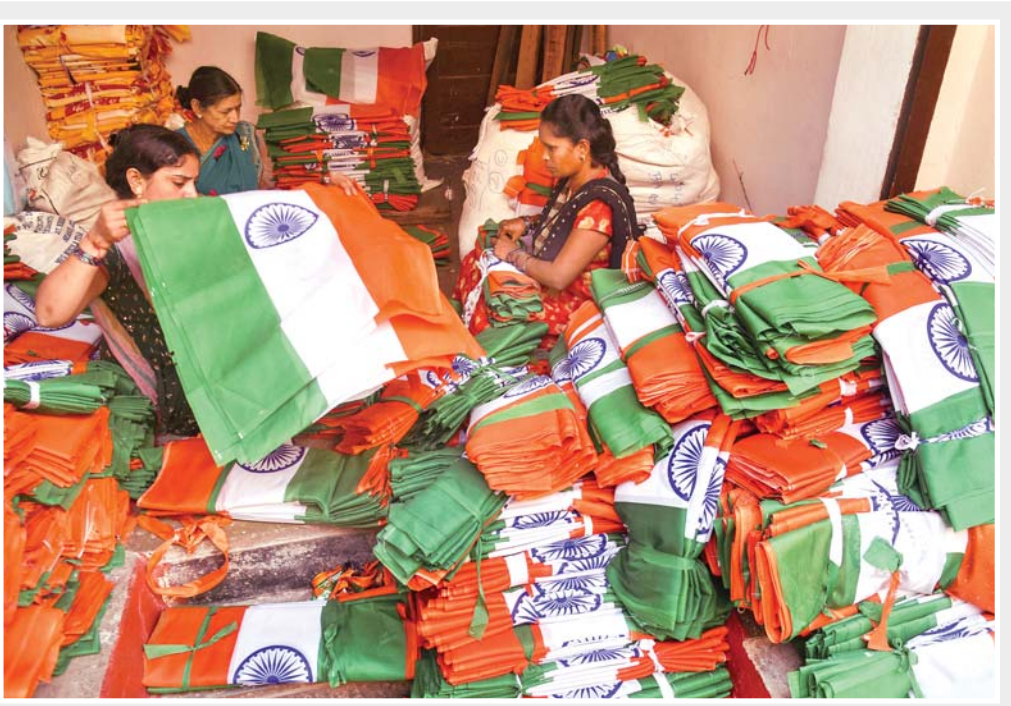
સ્વાતંત્ર્યદિનની પૂર્વ તૈયારી: સ્વાતંત્ર્યદિનની પૂર્વ તૈયારી રૂપે હૈદરાબાદમાં નાના ત્રિરંગા રાષ્ટ્રદંડજોતું પોકિંગ કરતી શ્રમિક મહિલાઓ. (પીટીઆઈ)

અલગ જવાબમાં, તેમણે કહ્યું કે જાન્યુઆરી ૧૯૯૧થી ૩૧ જુલાઈ, ૨૦૨૩ સુધીમાં મંત્રાલય હેઠળ નોંધાયેલા ઉદ્યોગોની કુલ સંખ્યા ૧,૧૦,૫૨૫ છે. ઓપન નેટવર્ક ફોર ડિજિટલ કોમર્સ પરના એક પ્રશ્નના જવાબમાં વાણિજ્ય અને ઉદ્યોગ મંત્રી પીયુષ ગોયલે જણાવ્યું હતું કે ઓપન નેટવર્ક ફોર ડિજિટલ એ ૮૦ ફીટ ઓન સ્ટ્રીટ સંસાધનો સમાવતા પ્રોગ્રામ શરૂ કર્યો છે, જે તેના લાભો વિશે વિકેતાઓને જાણકારી આપવા અને શિક્ષિત કરવામાં નેટવર્ક સહભાગીઓને ટેકો આપે છે. ઓપન નેટવર્ક ફોર ડિજિટલ એ એક પ્રોટોકોલ છે જે નેટવર્ક સહભાગીઓને સામાન અને સેવાઓની કાર્યક્ષમતાથી આપલે કરવા સક્ષમ બનાવે છે. (પીટીઆઈ)■