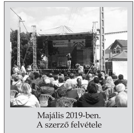
Majális 2019-ben.

Május első vasárnapján az édesanyákat köszöntjük. Az amerikai eredetű hagyományt Magyarorszá-