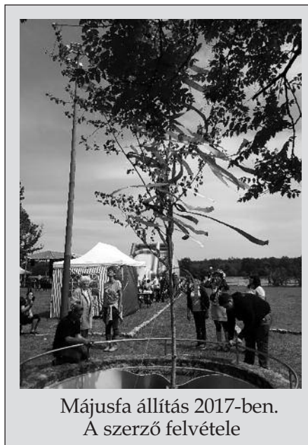
Májusfa állítás 2017-ben.

talában színes szalagokkal, étellel-itallal is díszítették. Legtöbbször az udvarló legény vezetésével állították a fát, de egyes területeken a legények a rokonlányoknak is állították. Gyakran a közösségeknek is volt egy közös fája, aminek a kidöntését ünnepély, és táncmulatság kísérte. A májusfák kidöntése járt együtt általában nagyobb ünnepélyességgel, táncmulatsággal. A májusfa ledöntésének szertartásos mozzanata volt a fa körüljárása, a májusfára mászás. Különösen nehéz volt a lehúzott kérgű, magas fát megmászni. Azé lett a tetejére erősített ital, akinek ez sikerült. A legények gyakran megtréfálták egymást azzal, hogy az üvegbe paprikás vizet tettek.