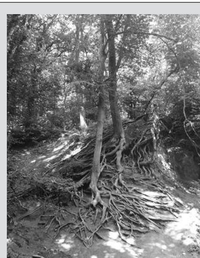
A természet csodája. Rám-szakadék.

Április 22-én a Föld Napját tartjuk. 1970. április 22-én Denis Hayes