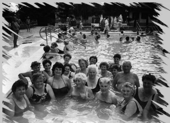
Búcsújáró kirándulók 1996-ban a mezőkövesdi „Jézus Szíve” napi búcsú után a bogácsi fürdőben