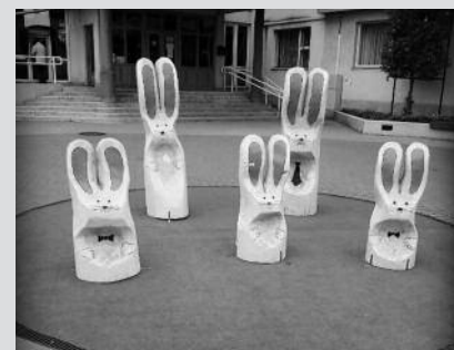
A húsvéti ünnepkör kellékei.

megújító erejébe vetett hit az alapja ennek a szokásnak, mely aztán idővel, mint kölnivel vagy vízzel való locsolás maradt fenn napjainkig. Bibliai eredetű is tulajdonítanak a locsolkodás hagyományának, eszerint a Krisztus sírját őrző katonák a feltámadás hírére vevő, ujjongó asszonyokat igyekeztek lecsendesíteni úgy, hogy lelocsolták őket. Régi korokban a piros színnek védőerőt tulajdonítottak. A húsvéti tojások piros színe egyes feltételezések szerint Krisztus vérének jelképezi. A tojásfestés szokása és a tojások díszítése az egész világon elterjedt. Más vélekedések szerint a húsvét eredetileg a termékenység ünnepe, amely segítségével szerették volna az emberek a bő termést, és a háziállatok szaporulatát kívánni. Így kötődik a nyúl a tojáshoz, mivel a nyúl szapora állat, a tojás pedig magában hordozza az élet ígétetét. A locsolkodás is az öntözés utánzásával a bő termést hivatott jelképezni.