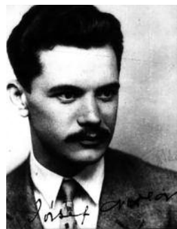
József Attila e képpen ír 1924-ben a Tavasz van! Gyönyörű' című versében:

Nincsen olyan költőnk, akit ne ihletett volna meg a föld és a természet ébredése. Egyik legnagyobb költőnk születésnapját a Magyar Költészet Napjává nyilvánították 1964-ben.