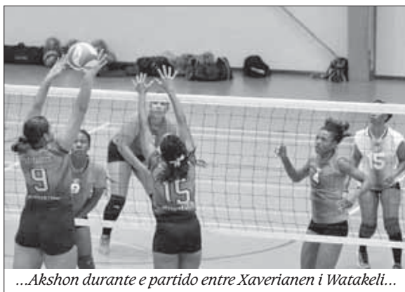
...Akshon durante e partido entre Xaverianen i Watakeli...