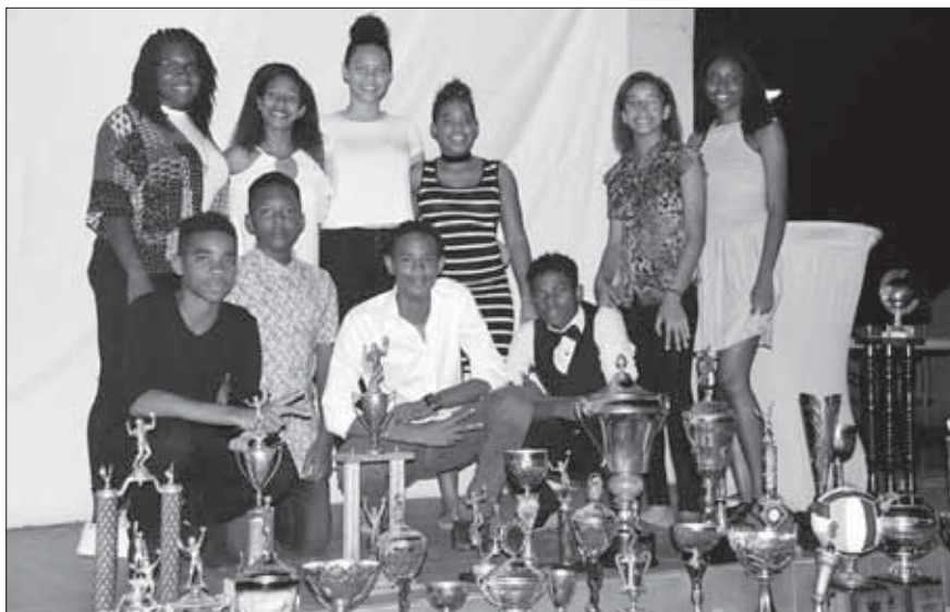
...Algun dje hóbenan ku ta representá e futuro generashon di Stakamahakchi, durante e brándis di ayera nochi...