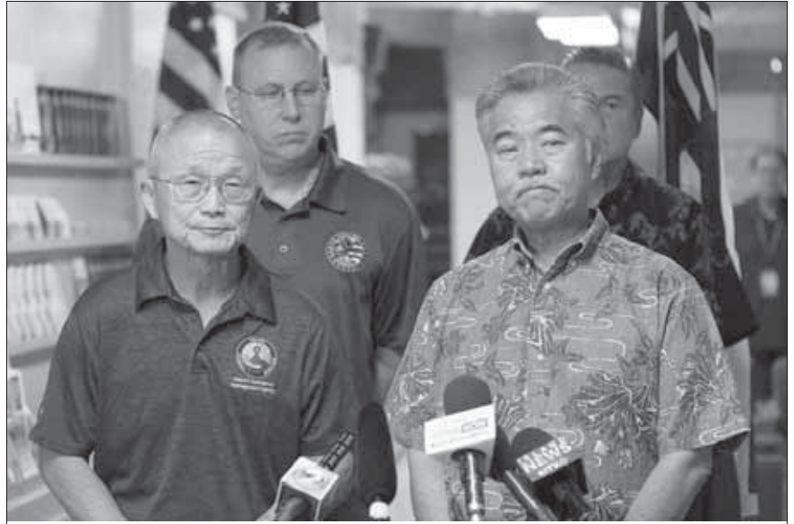
...Outoridat di Hawaii den un konferensia di prensa papiando riba e alerta falsu...