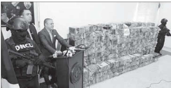
...31 di desèmber 502 pakete...