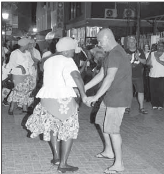
Kontinuashon di pagina 13 Sint Maarten a konosé

eksonerashon di impuesto tur kaminda na Kòrsou. Esei ta e úniko manera pa por kompetí ku e sentronan di kompra na bordo.