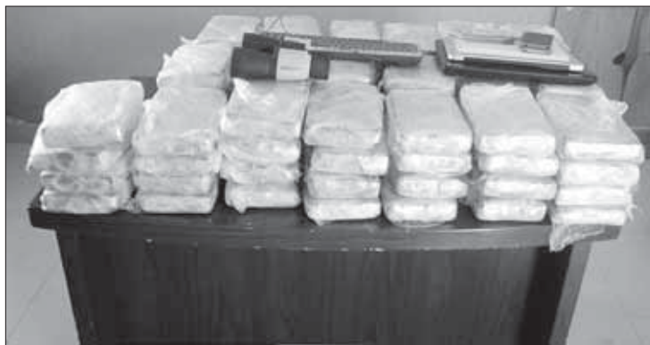
...19 di desèmber 76 pakete...