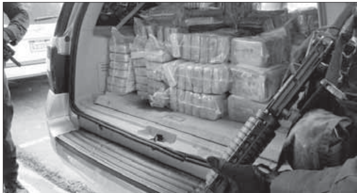
...17 di desèmber 394 pakete ...