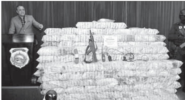
...14 di desèmber 1026 pakete...

E esfuersonan pa sigui kombatimentu di trafikashon di droga ta kontinuá.