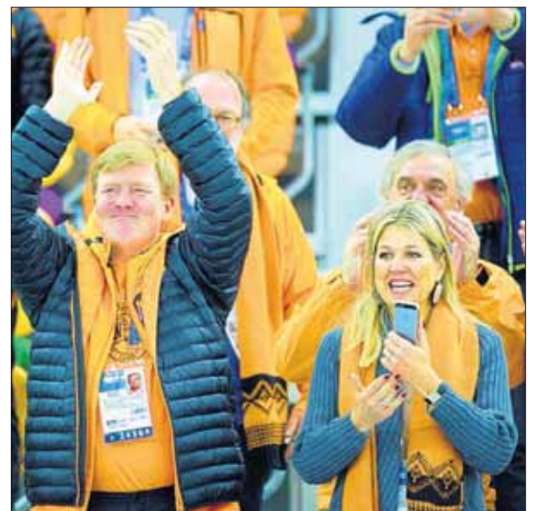
...Rei Willem-Alexander i reina Maxima...

Dembélé 20 na komienso di temporada a bini for di Borussia Dortmund pa 100 mion euro. Despues di algun wega el a leshoná di forma grave. Ta na kuminsamentu di aña aki el a bolbe hasi su entrada pa su promé minütan di wega.