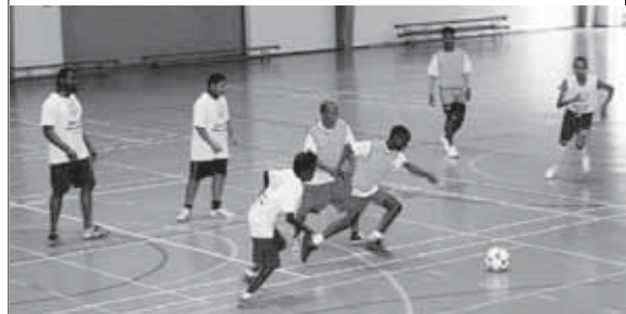
WILLEMSTAD.- Atletanan di Special Olympics durante fin di siman di 13 i 14 di yanüari tabatin un programa kargá relashoná ku weganan nashonal. E atletanan a kompetí den diferente disiplina deportivo, dunando lo máksimo komo resultado di lunanan largu di preparashon. Sigur un felisitashon na e organisashon i na e atletanan.