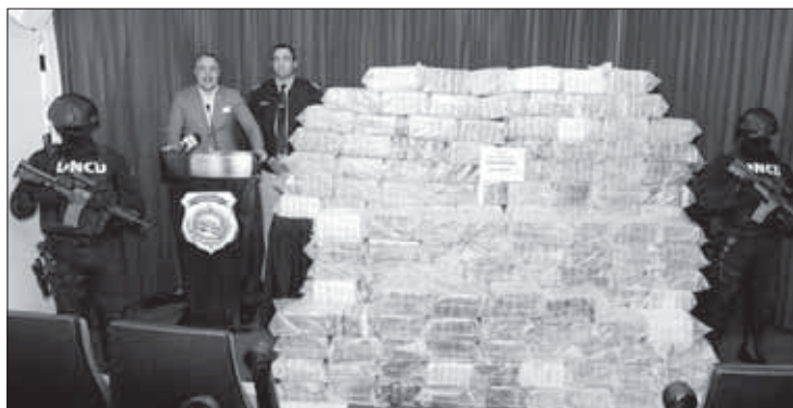
...29 di desèmber 850 pakete...