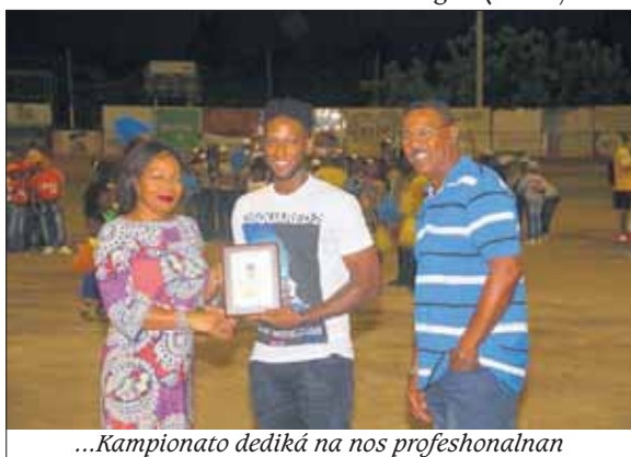
...Kampionato dediká na nos profeshonalnan