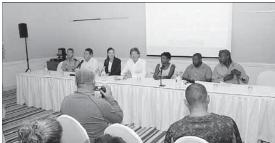
...Konferensia di prensa ayera tardi na Curaçao Hilton Hotel...