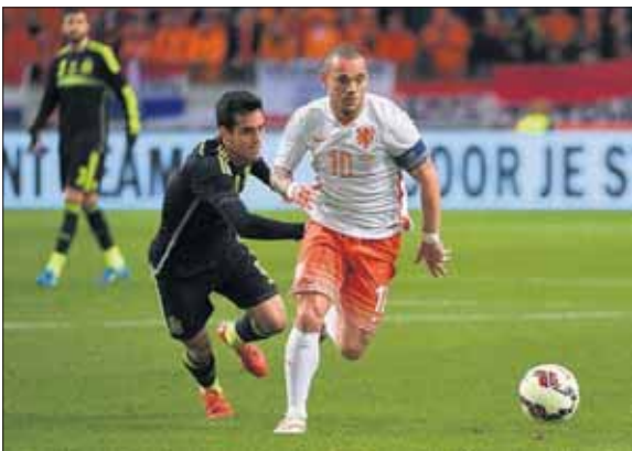
...Spaña i Ulanda...

Djabièrnè 23 mart Ulanda ta enfrentá Inglatera den Arena. Si e wega kontra Spaña no ta sigui mas, no ta muchu kla ainda si Ulanda ta hunga kontra un otro pais.