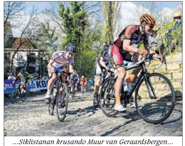
...Siklistanan krusando Muur van Geraardsbergen...