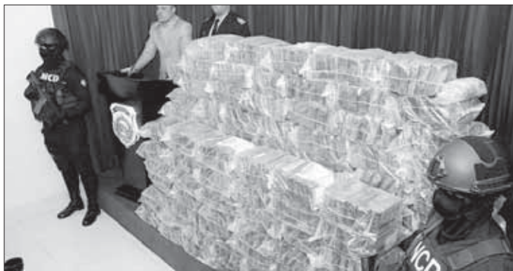
...22 di desèmber 499 pakete...