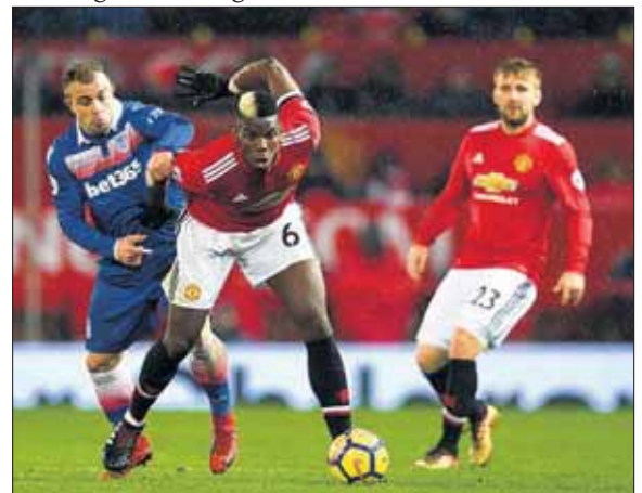
...Paul Pogba ku e bala...

Manchester no a hasi uso di e chènsnan ku nan a krea. Awor United tin tres punto di bentaha riba number tres i kuater, esta Liverpool i Chelsea.