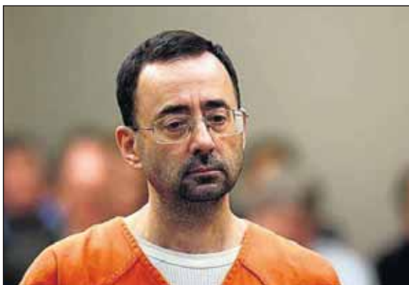
... Larry Nassar.