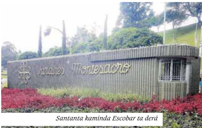
Santana kaminda Escobar ta derá

Medellín ku e diferente karanan ku esaki tin. Ku esaki tambe mi a yega na final di e serie aki i mi ta gradisié tur hende pa nan komentario ku mi a haña den kurso di último simannan aki. Pa reakshon: Anthonyhaile@yahoo.com / 5126220