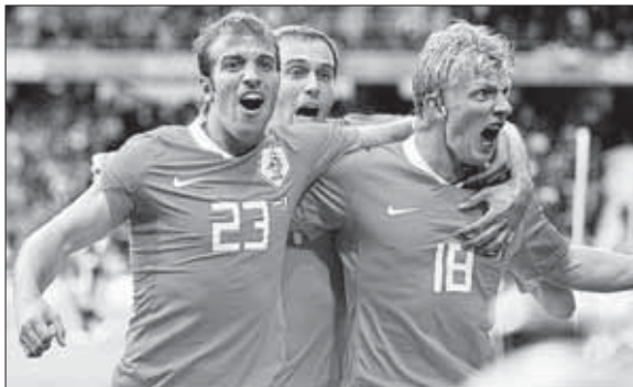
...Kuyt i Van der Vaart den nan tempu ku selekshon...

AMSTERDAM.- Federashon di futbòl di Ulanda a duna di konosé ku lo tuma despedida di Dirk Kuyt i Rafael van der Vaart ora ku Ulanda enfrentá Alemania dia 13 di òktober. KNVB a anunsiá ku tur aña nan lo skohe un dia pa tuma despedida di hungadónan ku a nifiká hopi pa futbòl ulandes.