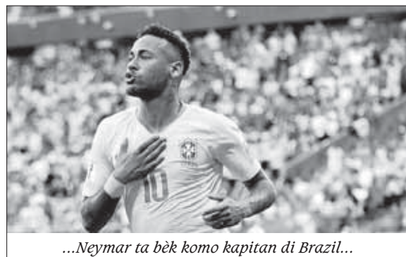
...Neymar ta bèk komo kapitan di Brazil...

Neymar a risibí basta crítica pa su aktuashon na Rusia pa motibu ku e tabata parse di ta eksagerá tur kos. Despues di e torneo e futbolista no kier a papia tokante di esaki. Awor e ta kere ku komo kapitan e ta haña e oportunidat pa kaba ku e krítikanan aki.