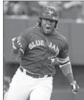
...Vladimir Guerrero Jr....

Blue Jays a sigui bisa ku nan ta hasiendo lo máksimo pa Guerrero desaroyá mas mihó defensivamente, su preparashon i rutina pa wega i tambe pa komprondé su impakto komo un lider di ekipo.