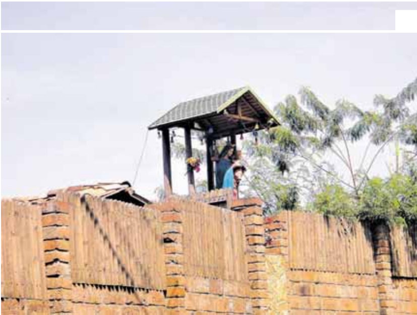
Entrada di Catedral

Tambe e a traha skol i lugánan di rekreashon pa e pueblo. Esaki a hasié natural mas popular i e echo ku e tabata hasi tur esaki ku sèn di droga, pa e poblashon esaki no tabata importante. En bèrdat e a wòrdu skohe komo miembro di kongreso. Sinembargo den e promé reunion ku e mester tabata presente e minister di Hustisia, Lara Bonilla a bini Parlamento i a deklará ku Pablo Escobar imposibel por forma parti di Senado. E palabranan famoso di dje tabata: “Un bandido komo ese Señor no puede ser miembro de nuestro congreso” Ku e palabranan aki Lara Bonilla, si ku e a realista esaki, a firma su sentensia di morto ya ku algun siman despues, Lara Bonilla a wòrdu asesiná dor di kominchinan di Pablo Escobar. Nan ta bisa ku ta Pablo Escobar mes a duna instrukshon pa mata Bonilla.