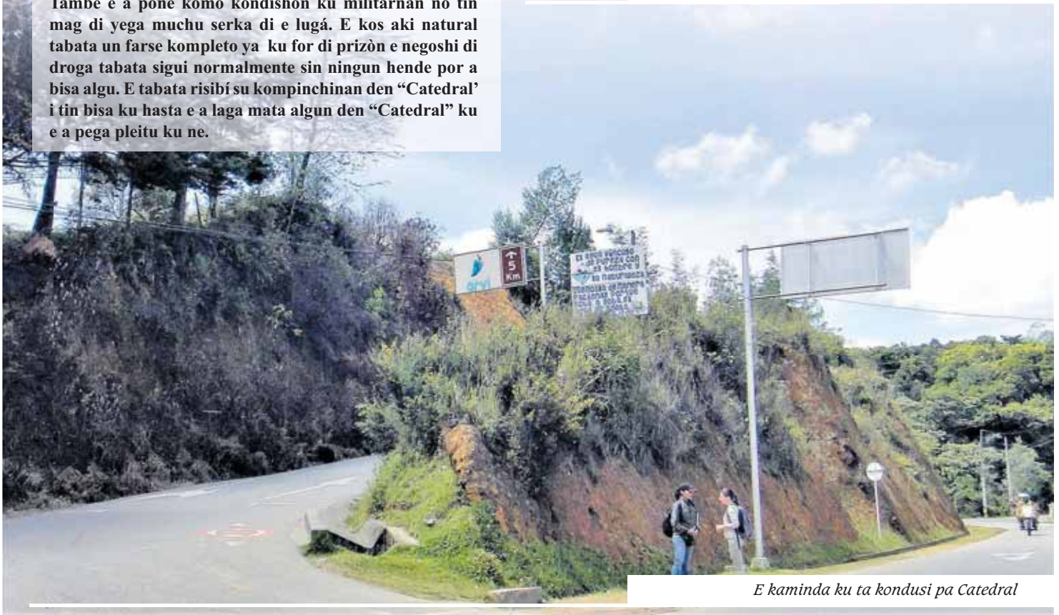
E kaminda ku ta kondusi pa Catedral