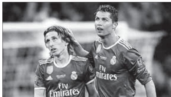
...Ronaldo i Modric a gana tres Champions League konsekutibo huntu...

Ronaldo su agente tabata hopi rabiá despues di e seremonia i a bisa ku ta un bèrgwensa ku e delantero no a gana mirando tur loke el a hasi den e temporada tras di lomba. Djumars último e tékniko di Croasia, Zlatko Dalic, a bisa ku e no lo kier Ronaldo den su ekipo pa motibu di su ego. Pero djaweps el a akclará i bisa ku e no tabata kier a zona negativo. El a haña ku tabata un tiki egoista di Ronaldo su parti pa no bai e seremonia, pero a saka su palabranan for di konteksto.