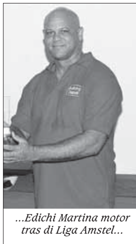
...Edichi Martina motor tras di Liga Amstel...

kontinuá i finalisá ku esnan ku si ke hunga bala."