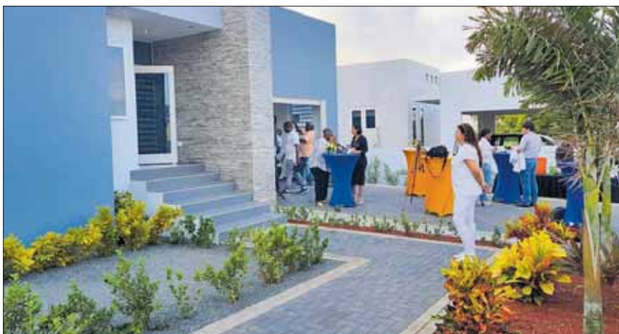
...Riba e fotonan momentu ku ta presentá e kas na prensa...