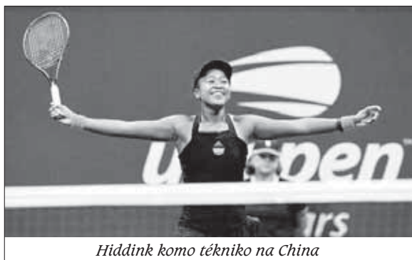
Hiddink komo tékniko na China

Awor e tin un otro oportunidat pa gana Williams despues ku el a drenta su promé final di Grand Slam na New York, un siudat ku ta importante pa e number 20 di mundu. Despues ku el a nanse na Hapon el a move pa New York na edat di tres aña i pasa gran parti di su bida einan.