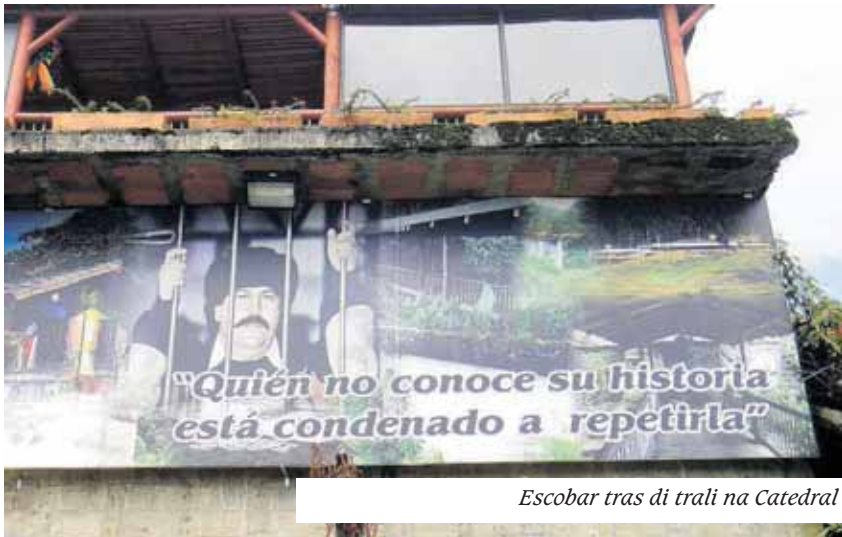
Escobar tras di trali na Catedral

di Robin Hood ku a lo ménos tabata preokupá pa esun di ménos rekursu. Despues di morto di Pablo Escobar kosnan a keda basta tempu ketu pero manera ta sosodé tur kaminda, morto di un ta bida pa otro. Mi ta spera ku mi por a duna abo lesadó un bista di