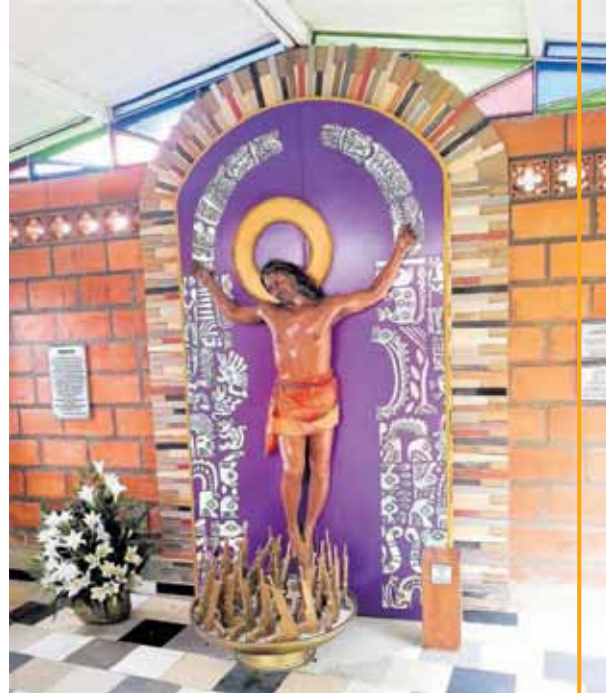
den Catedral tabata tin un misa ku un kristu di kolo