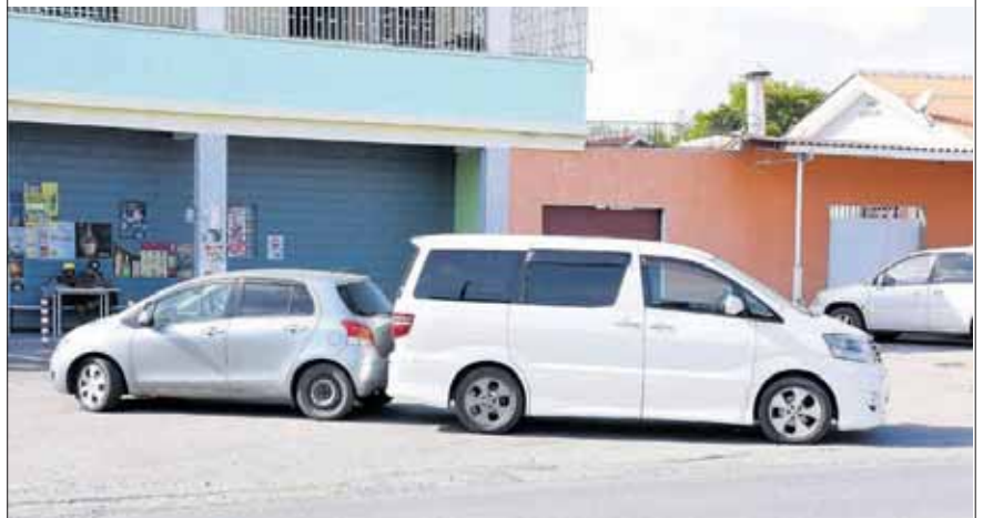
WILLEMSTAD.- Riba Gosieweg a registrá un aksidente poko pekuñar. Tabata nèt riba tereno di un estableimentu ku dos shofùr a bèk sin paga tinu. Ambos a bèk na mes momentu pero no a tuma nota di e otro ku tambe tabata bèk parti patras. A registrá algu di daño di kual Forensys a atendé ku esaki.