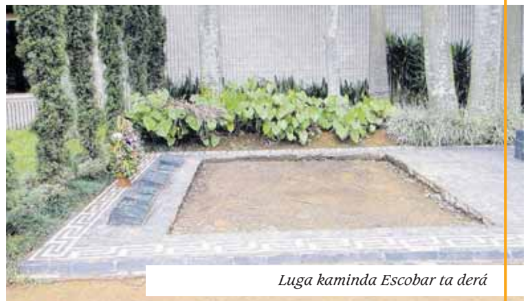
Luga kaminda Escobar ta derá