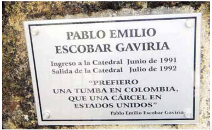
Estadia di Escobar den Catedral

E ora ei gobièrnu a disidí di forma un grupo “Elite” pa kaptura Escobar. Esaki tampoko a logra pero Pablo Escobar kada biaha tabata sinti ku su dianan ta kontata. Pa e motibu ei e a disidí di boluntariamente entrega su mes pero ku e kondishon ku e lo wòrdu pone den un prizòn ku e mes a laga traha i ku nan a yama “Catedral”. Tambe e a pone komo kondishon ku militarnan no tin mag di yega muchu serka di e lugá. E kos aki natural tabata un farse kompleto ya ku for di prizòn e negoshi di droga tabata sigui normalmente sin ningun hende por a bisa algu. E tabata risibí su kominchinan den “Catedral” i tin bisa ku hasta e a laga mata algun den “Catedral” ku e a pega pleitu ku ne.