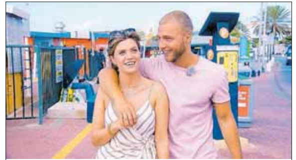
...Algun imágen di e episodio di The Bachelorette grabá na Kòrsou...

ku un bista espektakular di Willemstad for di altura. E pareha a sigui ku nan trep den e famoso Volkswagen bús 'Betty', pa haña un bista mas amplio di Kòrsou su naturalesa i paisahenan. E protagonistanan a hasi un parada pa disfrutá di un piknik romántiko na un playa privá serka di Porto Marie. E date a terminá ku un sena eksklusivo na Baoase Luxury Resort, kaminda nan a pasa anochi.