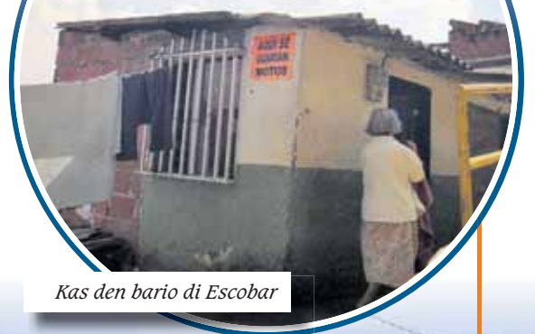
Kas den barío di Escobar

Manera nos a indiká siman pasa Medellín ta un siudat ku hopi kara. Un di e aspektonan ku Medellín pa hopi aña tabata masha konosí pe ta e asuntu di droga ku Pablo Escobar Gaviria komo e figura prinsipal. Nos no kier terminá e serie aki di Medellín sin dediká un artikulo na e persona ku a hasi Medellín sumamente popular no den e sentido positivo pero ku a pone ku henter e país tabata pa hopi tempu den gara di un persona ku a sembra hopi pánico spesial den gobièrnu i personahenan ku tabata bringa kontra di dje. Komo mi kier a sa mas di e figura aki mi a bai bishita e barío ku e a kumpra, tambe mi a bishita e lugá ku e tabata sera ku yama Catedral i por último e santana kaminda su restonan ta dera. Hopi interesante.