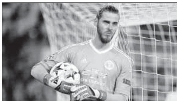
...David de Gea...

Luis Enrique a selektá ámbos portero pa e weganen kontra di Inglatera i Croasia den Nations League, pero el a sostené De Gea ora ku e tópiko a bin dilanti durante di un rueda di prensa. El a bisa ku e no sa kiko ta bai pasa den futuro, pero esei ta un posishon ku nunca e tabatin duda den dje.