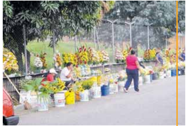
Benta di flor dilanti di e Santana

suela. Riba e enlase eksakto di su morto tin hopi historia pero ku e tabata tur na sanger na suela tur hende por a mira esaki via di potrèt di Internet. Pablo Escobar ta dera den santana Jardines Montesarco. Riba su graf tin un plaka sensio ku su nòmber i dia di nasementu. Nos a bai personalmente bishita su tumba i nos tin ku bisa ku nos a mira diferente hende ku hasta dia di awe ta bini pa pone flor na tumba di Pablo Escobar. Apesar ku e tabata e trafikante di droga mas grandi di Colombia i ku e ta responsabel pa morto di diferente Politiko ku tabata oponé, ta parse ku te awe tin un grupo di Kolombiano ku ta stim’e ya ku nan ta konsider’é komo un sorto