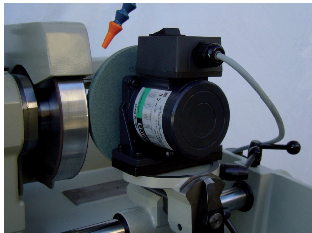
Nr. 6.24 Abrichtgerät für Diamantschleifscheiben Dresser for diamond wheels