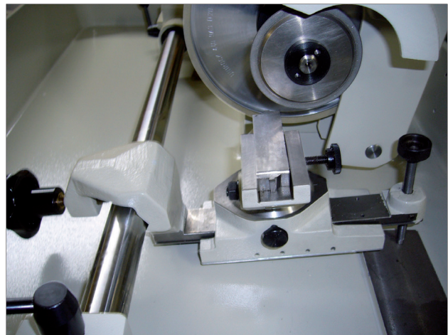
Nr. 6.21 Spanbrechnuten- Schleifapparat chip breaking groove grinder