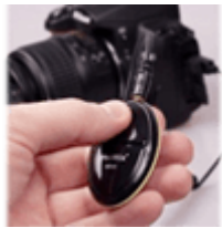
Пульты ДУ и пусковые тросики