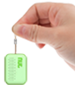
Поисковые брелки и GPS- трекеры