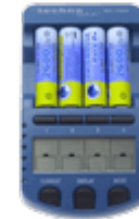
Зарядные устройства AA, AAA, ...