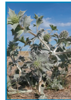
Die Stranddistel ist auf Sylt selten geworden. In Kampen wurden vorgezogene Pflänzchen in die Dünen gepflanzt.