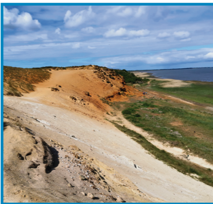
Das Morsum Kliff ist eines der ältesten Naturschutzgebiete der Insel.