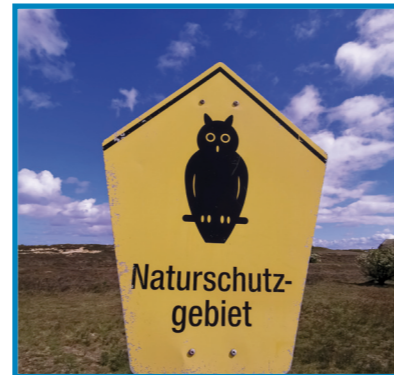
Die schwarze Waldohreule im gelben Fünfeck ist das offizielle Naturschutzgebietsschild.