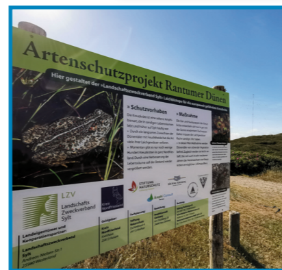
In Rantum gibt es ein Projekt, um den Lebensraum für die Kreuzkröte zu verbessern.