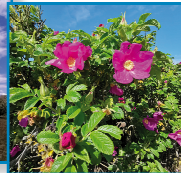
Die „Syltrose“ breitet sich auch in den Naturschutzgebieten aus: Segen oder Fluch?

Die eingereichten Arbeiten werden in folgenden Kategorien bewertet: