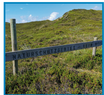
Besucherlenkung ist ein großes Anliegen in der Sylt Natur.