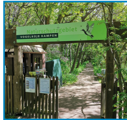
Die Vogelkoje Kampen ist eine historische Entenfanganlage mit Naturpfad.