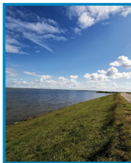
Das Rantum-Becken ist ein Eldorado für Vögel.

Das C. P. Hansen-Kuratorium vermittelt die Zusammenarbeit mit Experten und Kooperationspartnern . Bücher sind zu finden in der Sylt-Bibliothek, im Sylter Buchhandel und im Sylter Archiv.