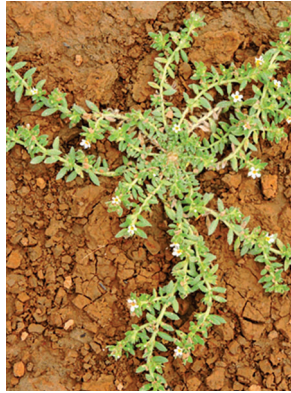
3 Euploca lagoensis