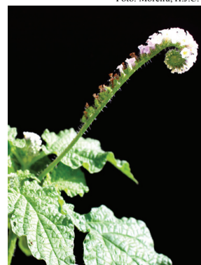
19 Heliotropium elongatum