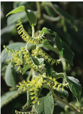
31 Myriopus salzmannii