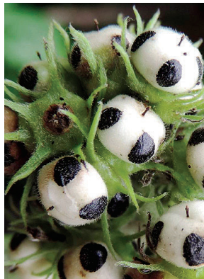
27 Myriopus candidulus