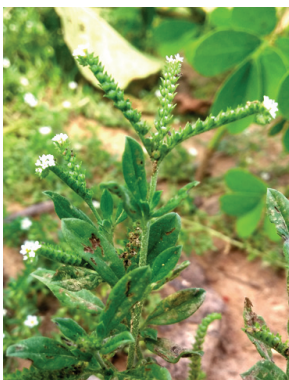
11 Euploca procumbens