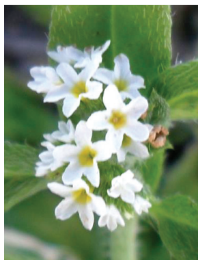
12 Euploca procumbens