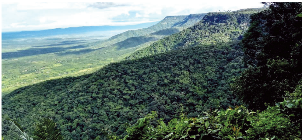
Floresta Estacional Sempre-Verde – Parque Nacional de Ubajara, Ubajara