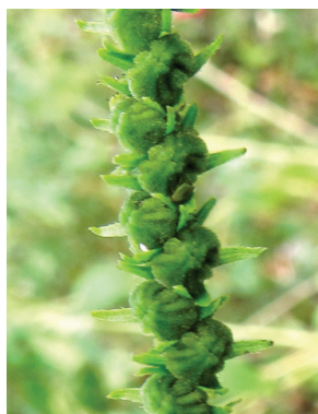
18 Heliotropium angiospermum