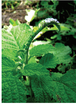
22 Heliotropium indicum