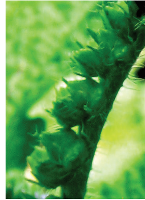
24 Heliotropium indicum