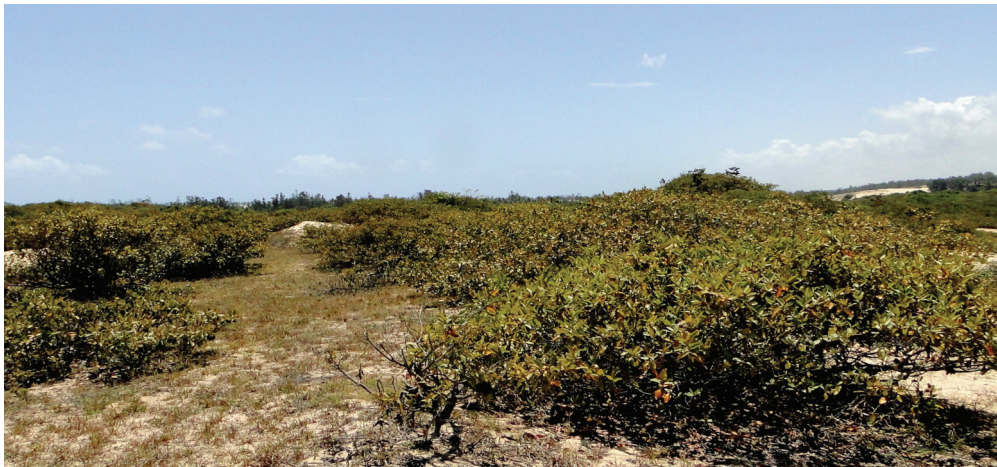
Mata de Tabuleiro – Lagoa do Cauípe, Caucaia