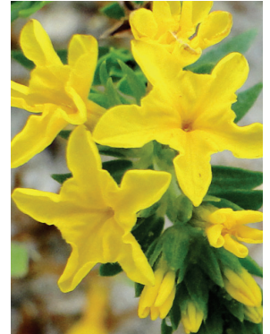
10 Euploca polyphylla