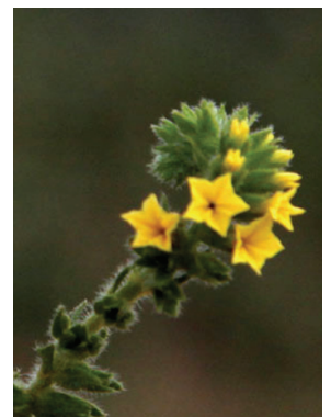
15 Euploca salicoides