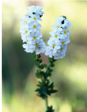
7 Euploca polyphylla