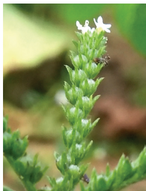
13 Euploca procumbens