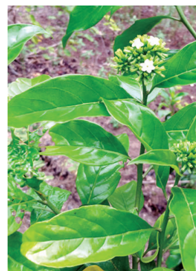
34 Tournefortia bicolor