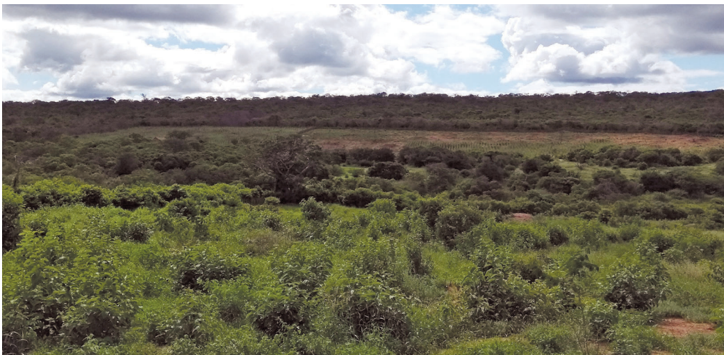
Savana estépica – Estação Ecológica de Aiuaba, Aiuaba