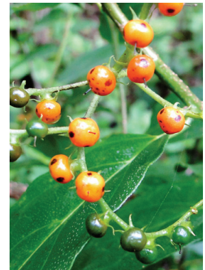
30 Myriopus rubicundus