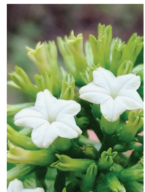
35 Tournefortia bicolor