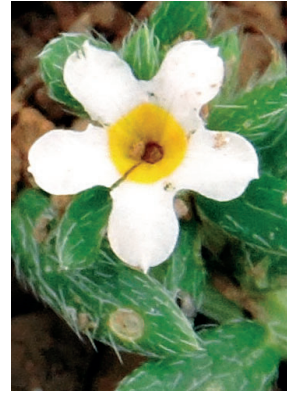
4 Euploca lagoensis