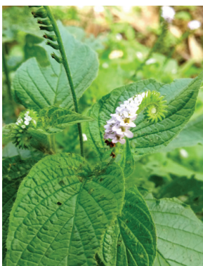
16 Heliotropium angiospermum