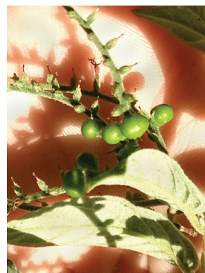
33 Myriopus salzmannii