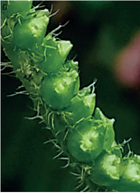
21 Heliotropium elongatum