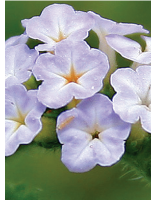
23 Heliotropium indicum