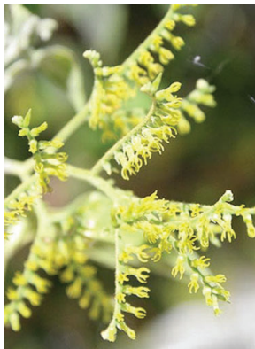
32 Myriopus salzmannii