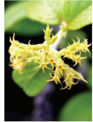
25 Myriopus candidulus