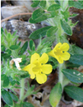
6 Euploca paradoxa