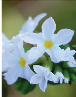
8 Euploca polyphylla