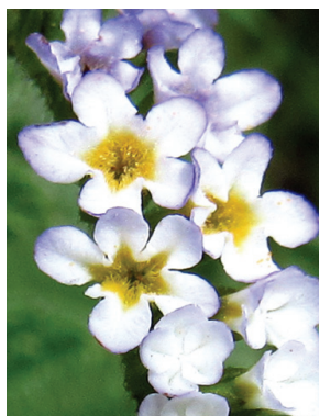
17 Heliotropium angiospermum