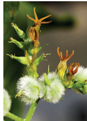
29 Myriopus rubicundus