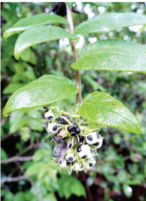
26 Myriopus candidulus