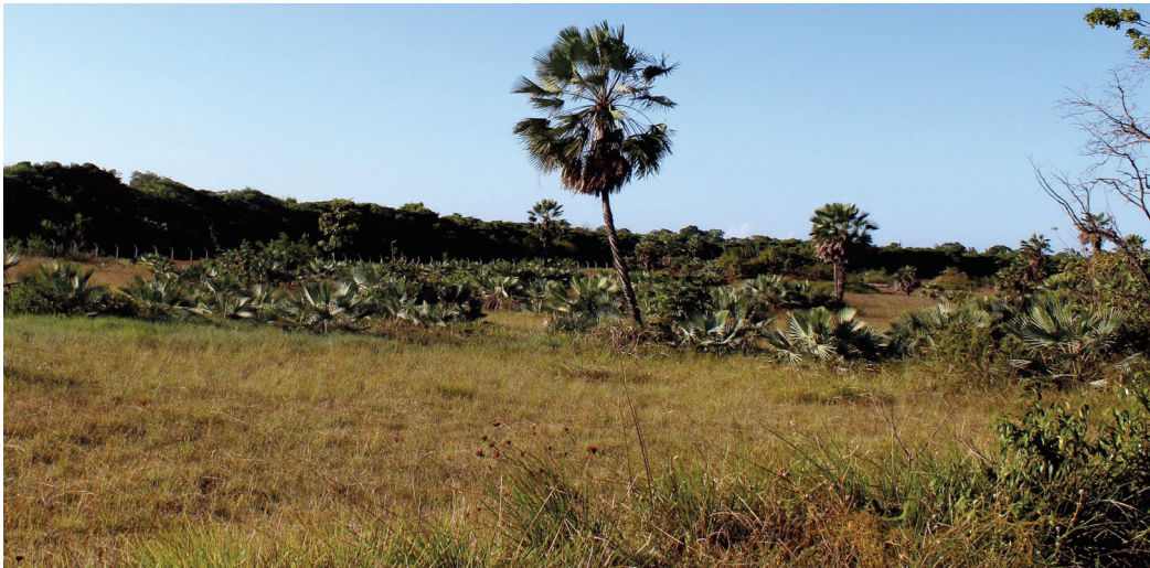
Mata de Tabuleiro – Parque Botânico do Ceará, Caucaia