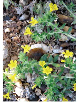
5 Euploca paradoxa