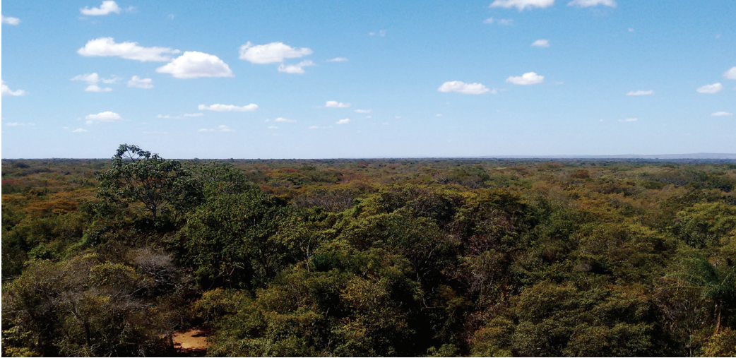
Savana - Floresta Nacional do Araripe-Apodi, Crato