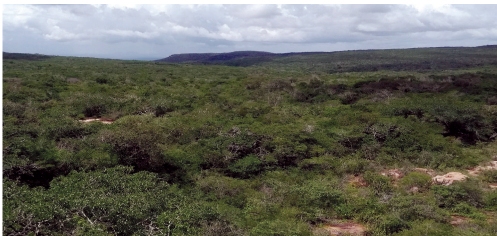
Carrasco arbustivo – Serra das Almas, Crateús