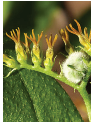
28 Myriopus rubicundus