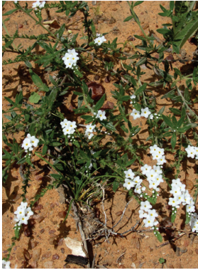
1 Euploca humilis