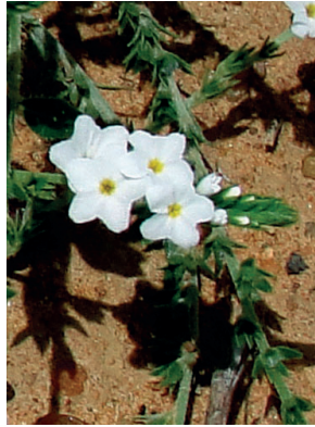
2 Euploca humilis