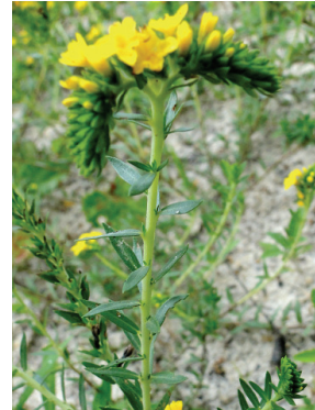
9 Euploca polyphylla