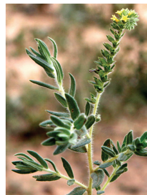
14 Euploca salicoides