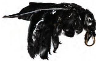
22 Xylocopa fimbriata APIDAE