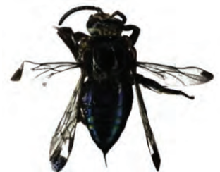
28 Mesocheira bicolor APIDAE