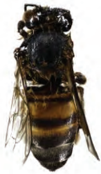
1 Apis mellifera APIDAE

[fieldguides.fieldmuseum.org] [1157] versión 1 5/2019