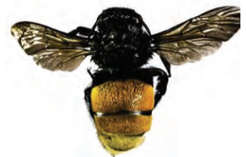
12 Eulaema polychroma APIDAE foto FCR