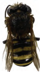
14 Melipona favosa APIDAE