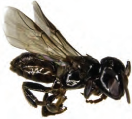
17 Lestrimelitta limao APIDAE

[fieldguides.fieldmuseum.org] [1137] versión 1 5/2019