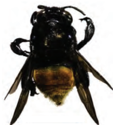
26 Eufriesea sp. APIDAE