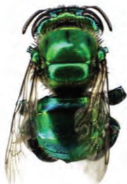
9 Euglossa dressleri APIDAE