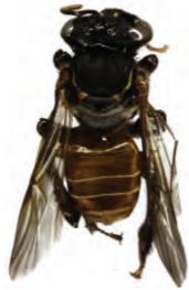
5 Cephalotrigona zexmeniae APIDAE