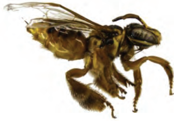
18 Paratetrapedia calcarata APIDAE