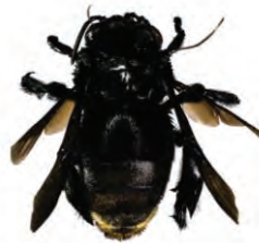
11 Eulaema nigrita APIDAE