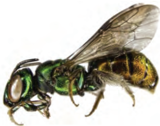
25 Ceratina sp. APIDAE