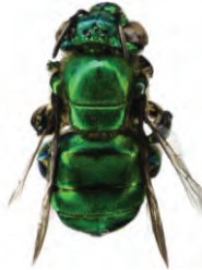
10 Euglossa modestior APIDAE