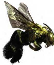
3 Centris geminata APIDAE