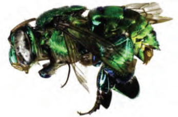
8 Euglossa cyanaspis APIDAE