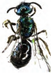
2 Augochlora sp. HALICTIDAE