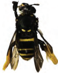
6 Epicharis sp. APIDAE