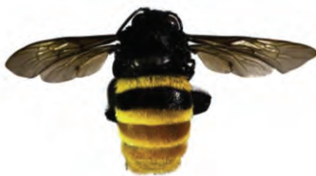
13 Eulaema cingulata APIDAE