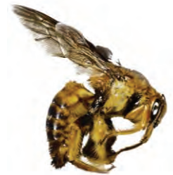
24 Xylocopa frontalis ♂ APIDAE