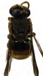
15 Nannotrigona mellaria APIDAE