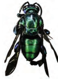
27 Exaerete smaragdina APIDAE