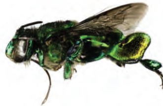
7 Euglossa chlorina APIDAE