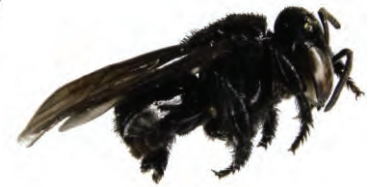
20 Trigona corvina APIDAE