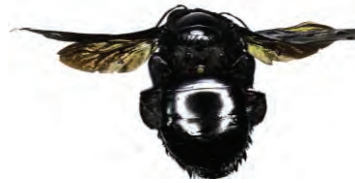
23 Xylocopa frontalis APIDAE