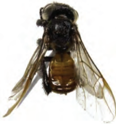
21 Trigona fulviventris APIDAE