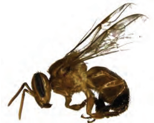
16 Partamona cupira APIDAE