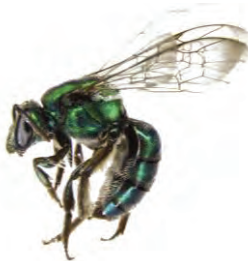
29 Pseudaugochlora graminea APIDAE