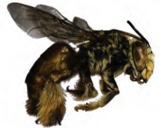
4 Centris tarsata APIDAE