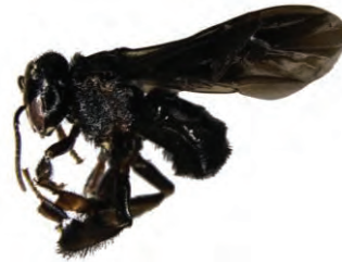
19 Trigona amalthea APIDAE