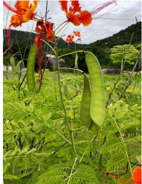
22 Caesalpinia pulcherrima FABACEAE