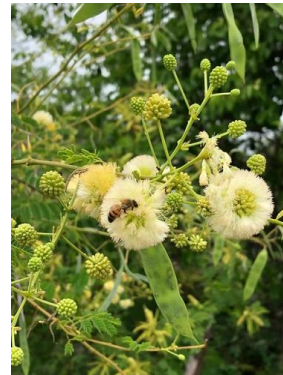
18 Anadenanthera colubrina FABACEAE