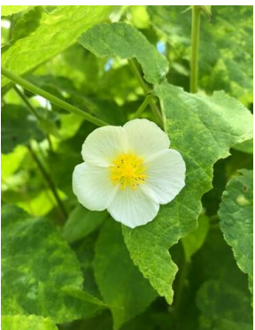
31 Herissantia tiubae MALVACEAE