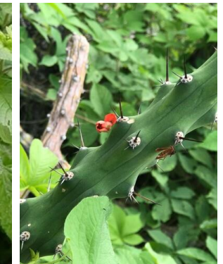
5 Harrisia adscendens CACTACEAE