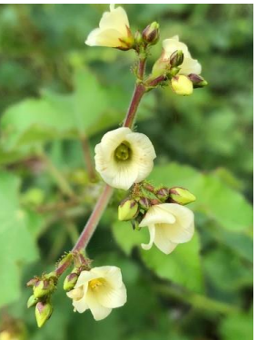
16 Jatropha mollissima EUPHORBIACEAE