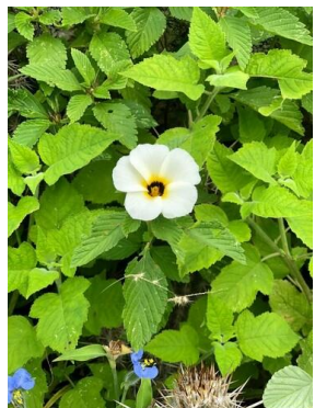
39 Turnera subulata PASSIFLORACEAE