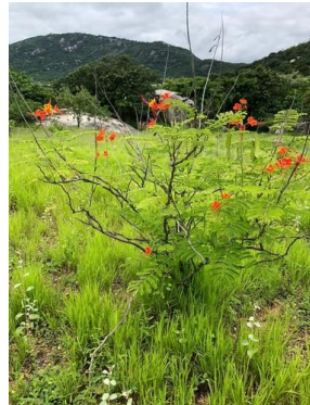
23 Caesalpinia pulcherrima FABACEAE