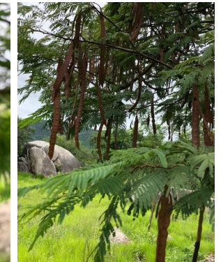
20 Anadenanthera colubrina FABACEAE