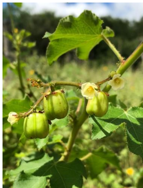
17 Jatropha mollissima EUPHORBIACEAE