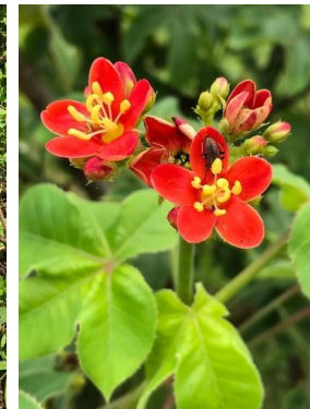
14 Jatropha mollissima EUPHORBIACEAE