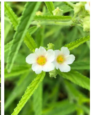
35 Sida rhombifolia MALVACEAE