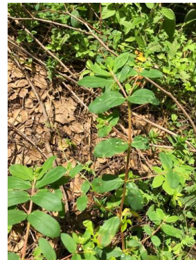
13 Euphorbia hyssopifolia EUPHORBIACEAE