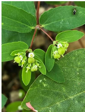
12 Euphorbia hyssopifolia EUPHORBIACEAE