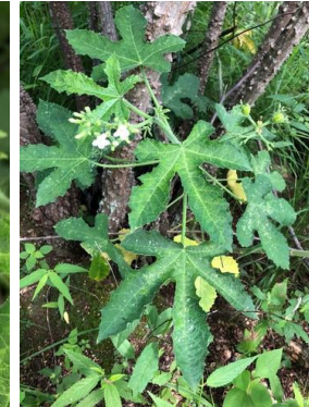
9 Cnidoscolus urens EUPHORBIACEAE