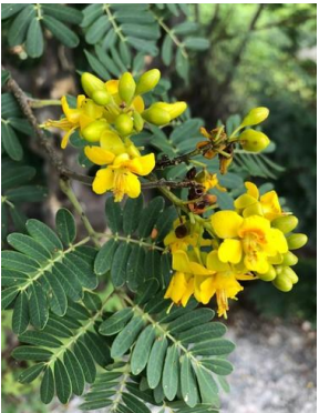
26 Libidibia ferrea FABACEAE