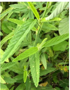
36 Sida rhombifolia MALVACEAE