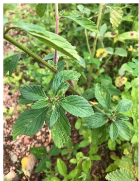
40 Turnera subulata PASSIFLORACEAE