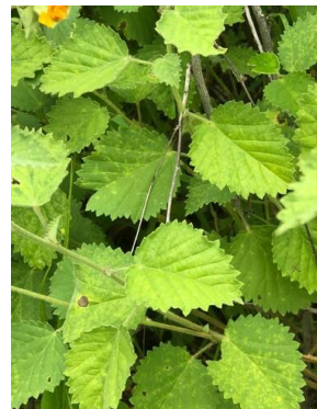
34 Sida galheirensis MALVACEAE