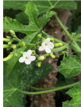
8 Cnidoscolus urens EUPHORBIACEAE