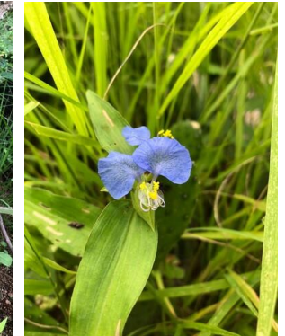
10 Commelina erecta COMMELINACEAE