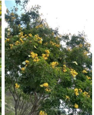
25 Cenostigma pyramidale FABACEAE