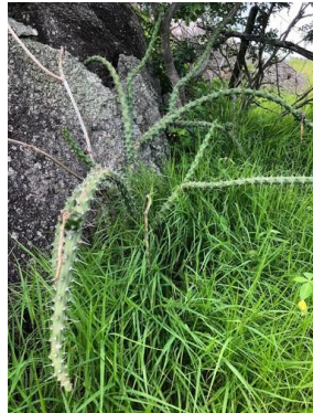
7 Harrisia adscendens CACTACEAE