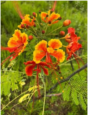
21 Caesalpinia pulcherrima FABACEAE