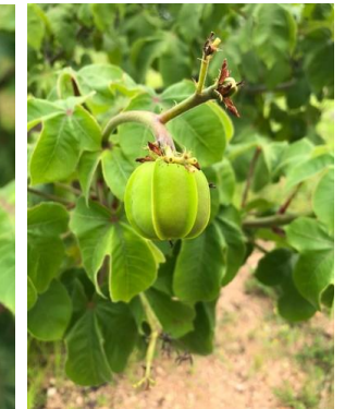
15 Jatropha mollissima EUPHORBIACEAE