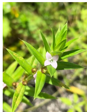
37 Diodella apiculata RUBIACEAE