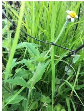
2 Tridax procumbens ASTERACEAE