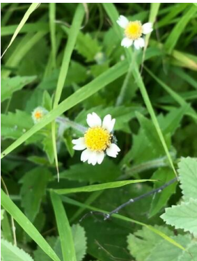
1 Tridax procumbens ASTERACEAE