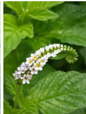
3 Heliotropium angiospermum BORAGINACEAE