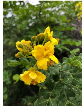
24 Cenostigma pyramidale FABACEAE