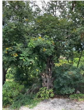
28 Libidibia ferrea FABACEAE