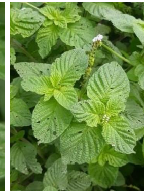
4 Heliotropium angiospermum BORAGINACEAE