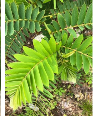
30 Senna martiana FABACEAE