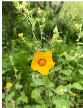
33 Sida galheirensis MALVACEAE