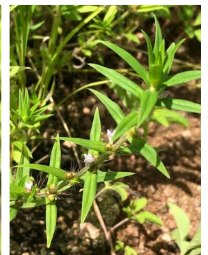
38 Diodella apiculata RUBIACEAE