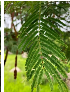
19 Anadenanthera colubrina FABACEAE