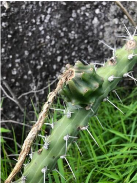
6 Harrisia adscendens CACTACEAE