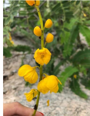
29 Senna martiana FABACEAE