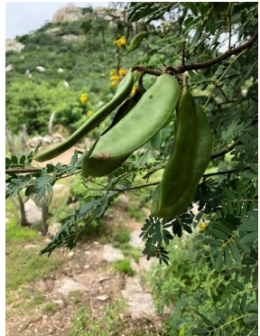
27 Libidibia ferrea FABACEAE