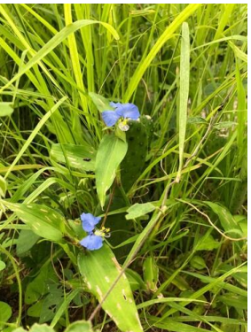
11 Commelina erecta COMMELINACEAE