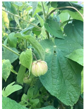
32 Herissantia tiubae MALVACEAE