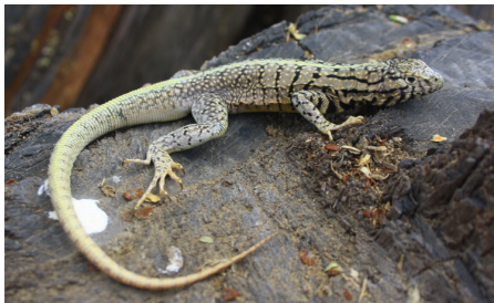
37 Microlophus peruvianus (M) TROPIDURIDAE IW