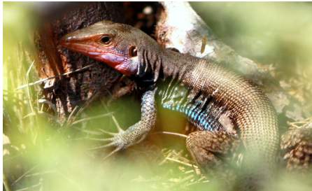
31 Dicrodon heterolepis TEIIDAE IW