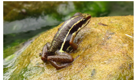
6 Epipeobates anthonyi DENDROBATIDAE Kárlom Herrera