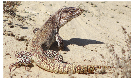
27 Callopistes flavipunctatus TEIIDAE IW