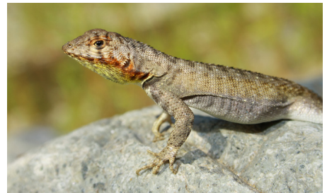
36 Microlophus koepckeorum (H) TROPIDURIDAE IW