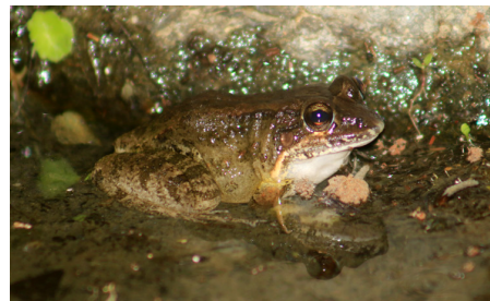
11 Leptodactylus labrosus LEPTODACTYLIDAE IW