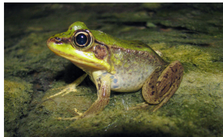
14 Lithobates bwana RANIDAE Jorge Novoa