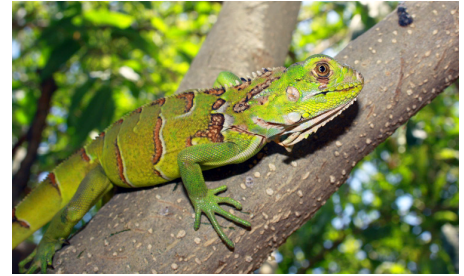
18 Iguana iguana (Juv.) IGUANIDAE IW