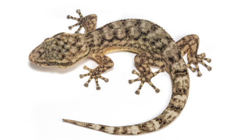
24 Phyllodactylus reissii PHYLLODACTYLIDAE IW