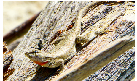
39 Microlophus occipitalis (H) TROPIDURIDAE IW