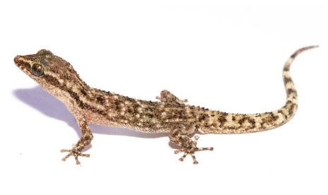
21 Phyllodactylus kofordi PHYLLODACTYLIDAE IW