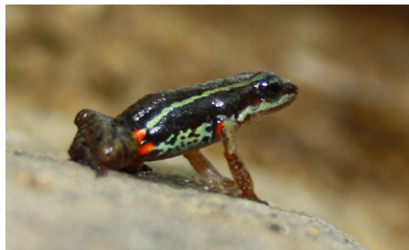
7 Epipeobates anthonyi DENDROBATIDAE IW