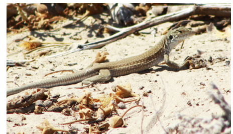
30 Dicrodon guttulatum (H) TEIIDAE IW