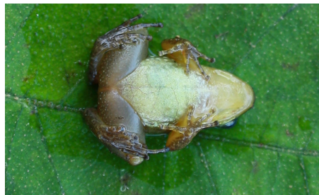
10 Hyloxalus elachyhistus DENDROBATIDAE IW