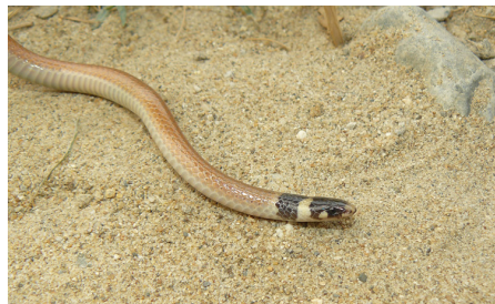
59 Tantilla capistrata COLUBRIDAE Diego Vásquez