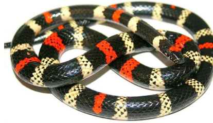
62 Micrurus tschudii olsoni ELAPIDAE IW