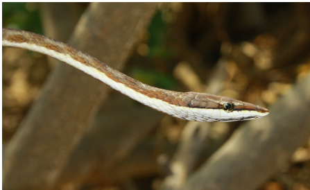
55 Oxybelis cf. transandinus COLUBRIDAE IW