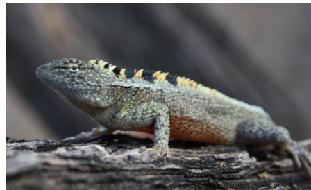
41 Microlophus occipitalis (M) TROPIDURIDAE IW