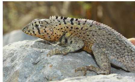
35 Microlophus koepckeorum (M) TROPIDURIDAE IW