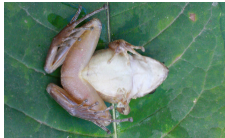
5 Pristimantis lymani CRAUGASTORIDAE IW