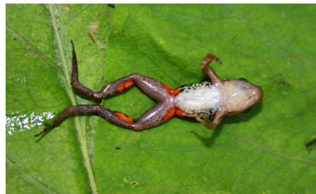
8 Epipeobates anthonyi DENDROBATIDAE IW