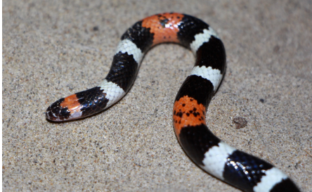
61 Micrurus tschudii olsoni ELAPIDAE IW