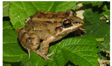
12 Leptodactylus labrosus LEPTODACTYLIDAE IW