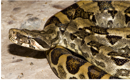
46 Boa constrictor ortonii BOIDAE IW