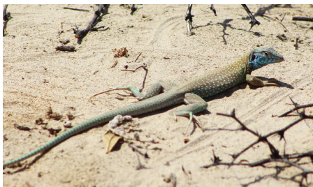
28 Dicrodon guttulatum (M) TEIIDAE IW