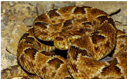
64 Bothrops barnetti VIPERIDAE IW