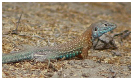
29 Dicrodon guttulatum (M) TEIIDAE IW