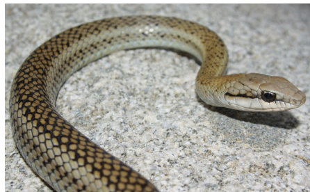
53 Mastigodryas heathii COLUBRIDAE IW