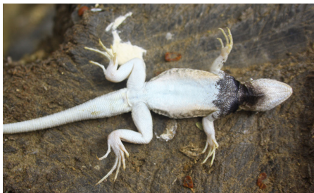
43 Microlophus thoracicus TROPIDURIDAE IW