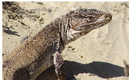
26 Callopistes flavipunctatus TEIIDAE IW