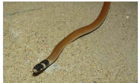
60 Tantilla capistrata COLUBRIDAE Diego Vásquez