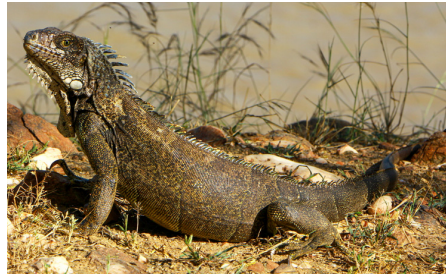
17 Iguana iguana IGUANIDAE IW