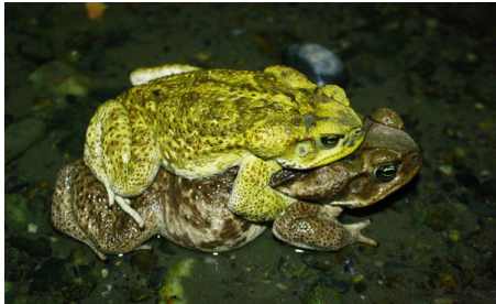
1 Rhinella horribilis BUFONIDAE IW