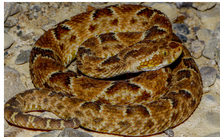
65 Bothrops barnetti VIPERIDAE IW