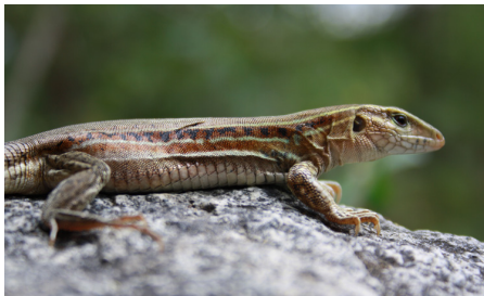
34 Medopheos edracanthus TEIIDAE IW