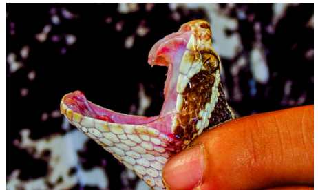
66 Bothrops barnetti VIPERIDAE Kárlom Herrera