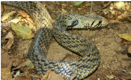
49 Drymarchon melanurus COLUBRIDAE IW