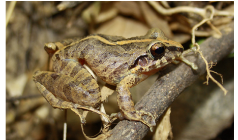
3 Pristimantis lymani CRAUGASTORIDAE IW