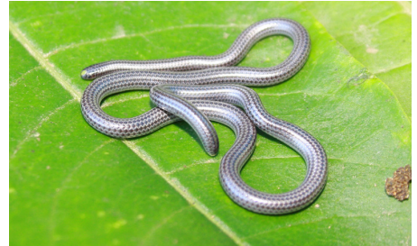
63 Epictia subcrotilla LEPTOTYPHLOPIDAE IW