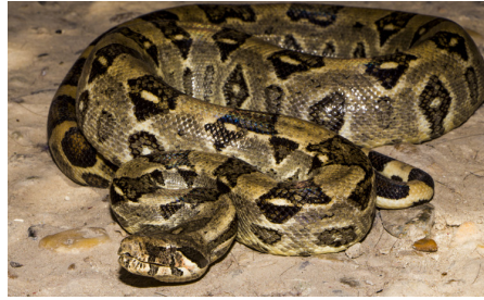
47 Boa constrictor ortonii BOIDAE IW