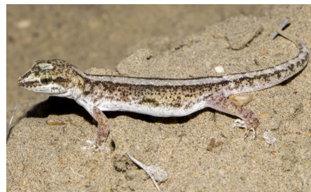
23 Phyllodactylus microphyllus PHYLLODACTYLIDAE IW