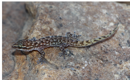
20 Phyllodactylus kofordi PHYLLODACTYLIDAE IW