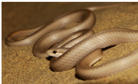
58 Pseudalsophis elegans COLUBRIDAE IW