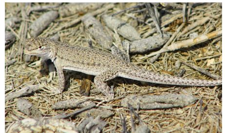
42 Microlophus thoracicus TROPIDURIDAE IW