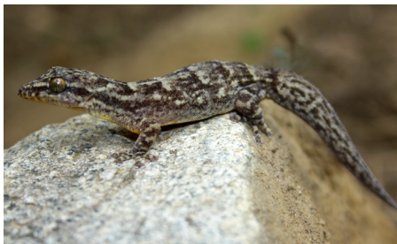
25 Phyllodactylus reissii PHYLLODACTYLIDAE IW