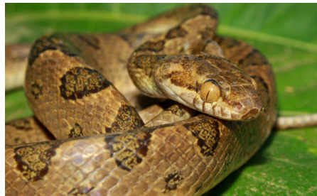
50 Leptodeira septentrionalis COLUBRIDAE IW