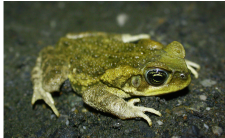
2 Rhinella horribilis BUFONIDAE IW