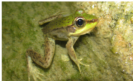
13 Lithobates bwana RANIDAE Jorge Novoa