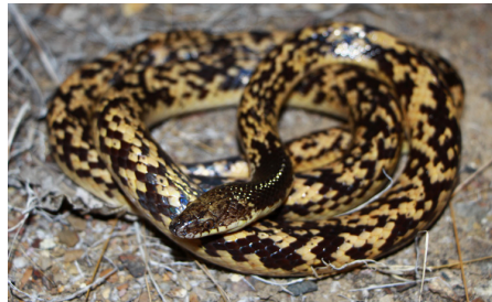
56 Oxyrhopus fitzingeri COLUBRIDAE IW