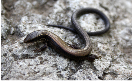
16 Macropholidus ruthveni GYMNOPHTHALMIDAE IW