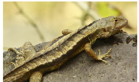
45 Stenocercus puyango TROPIDURIDAE IW