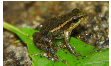
9 Hyloxalus elachyhistus DENDROBATIDAE IW