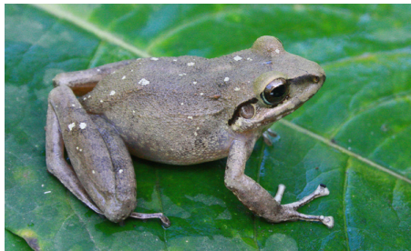
4 Pristimantis lymani CRAUGASTORIDAE IW