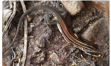
33 Medopheos edracanthus TEIIDAE IW