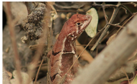
44 Stenocercus puyango TROPIDURIDAE IW