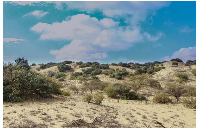
Desierto Costero de Piura