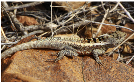
40 Microlophus occipitalis (M) TROPIDURIDAE IW