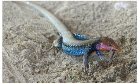
32 Dicrodon heterolepis TEIIDAE IW