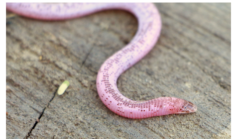
15 Amphisbaena occidentalis AMPHISBAENIDAE IW