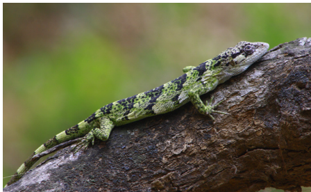
19 Polychrus femoralis IGUANIDAE IW