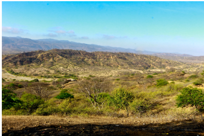
Bosque Seco de Piura