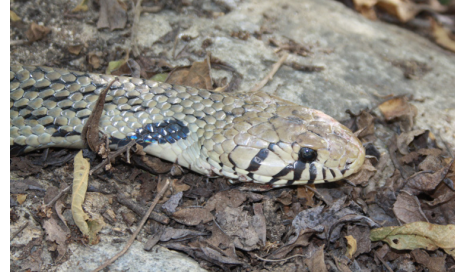
48 Drymarchon melanurus COLUBRIDAE IW