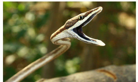
54 Oxybelis cf. transandinus COLUBRIDAE IW