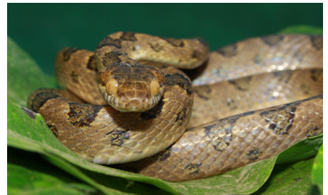
51 Leptodeira septentrionalis COLUBRIDAE IW