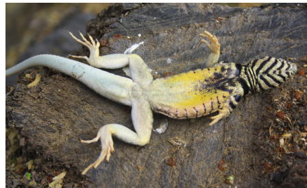
38 Microlophus peruvianus (M) TROPIDURIDAE IW