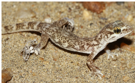
22 Phyllodactylus microphyllus PHYLLODACTYLIDAE IW