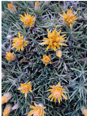
8 Chuquiraga aurea ASTERACEAE