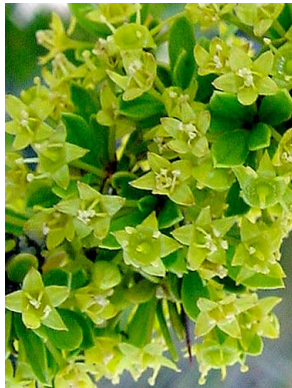
47 Condalia microphylla RHAMNACEAE