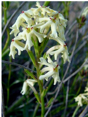
57 Glandularia flava VERBENACEAE