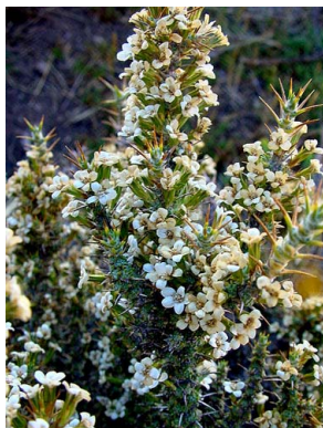
17 Nassauvia glomerulosa ASTERACEAE