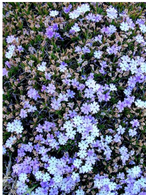
58 Junellia mulinoides VERBENACEAE