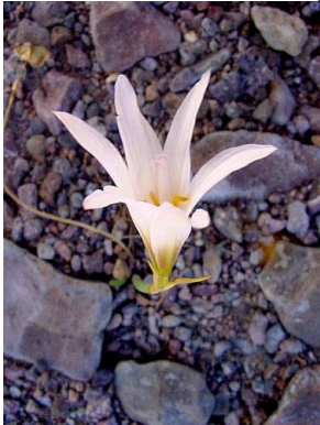
1 Habranthus jamesonii AMARYLLIDACEAE

© Environmental & Conservation Programs, The Field Museum, Chicago, IL 60605 USA. [www.fmn.org/plantguides] [RRC@fmnh.org] Rapid Color Guide # 199 versión 1. 07/2006