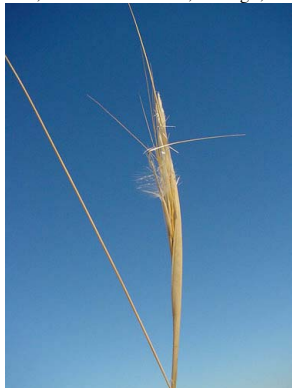
42 Jarava patagonica POACEAE