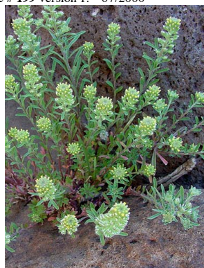
25 Alyssum alyssoides BRASSICACEAE