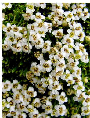
26 Onuris graminifolia BRASSICACEAE