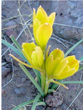
2 Rhodophiala mendocina AMARYLLIDACEAE