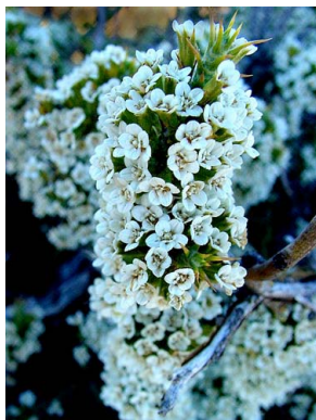
18 Nassauvia ulicina ASTERACEAE