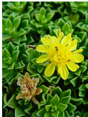
14 Gutierrezia baccharoides ASTERACEAE