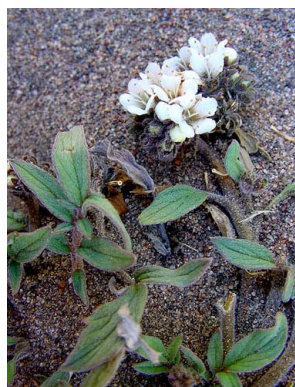
38 Phacelia secunda HYDROPHYLLACEAE