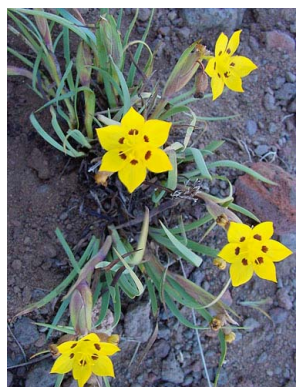
39 Sisyrinchium somuncurensis IRIDACEAE