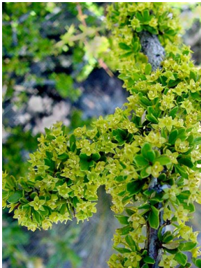
46 Condalia microphylla RHAMNACEAE