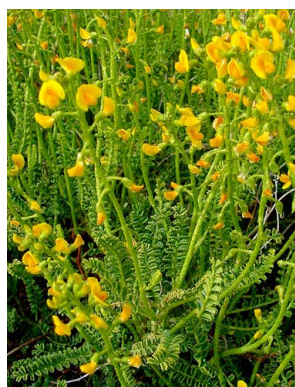
31 Adesmia boronioides FABACEAE