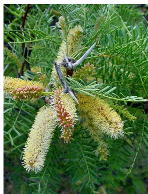
37 Prosopis flexuosa FABACEAE