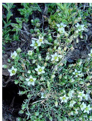
30 Arenaria serpens CARYOPHYLLACEAE