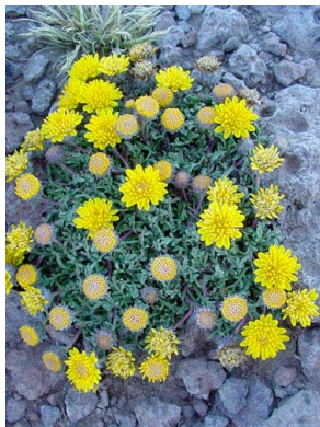
12 Grindelia pygmaea ASTERACEAE