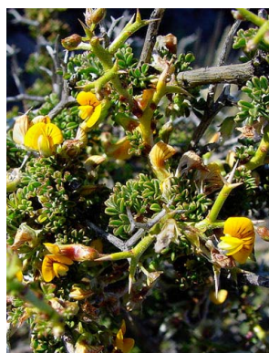
33 Adesmia volckmannii FABACEAE