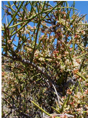
48 Discaria articulata RHAMNACEAE