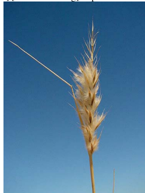
44 Leymus erianthus POACEAE