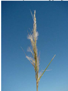
43 Jarava vaginata POACEAE