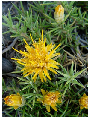
9 Chuquiraga aurea ASTERACEAE