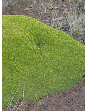
4 Azorella monantha APIACEAE