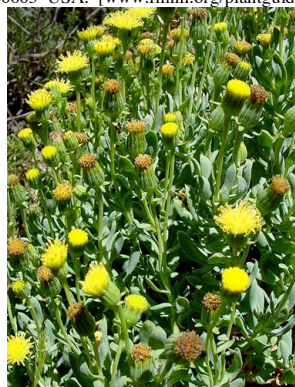
23 Senecio megaoreinus ASTERACEAE