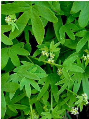
6 Bowlesia tropaeolifolia APIACEAE