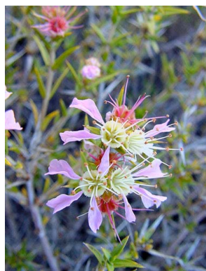
40 Pleurophora patagonica LYTHRACEAE