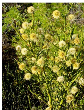
35 Prosopidastrum globosum FABACEAE