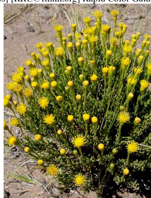
24 Senecio miser ASTERACEAE