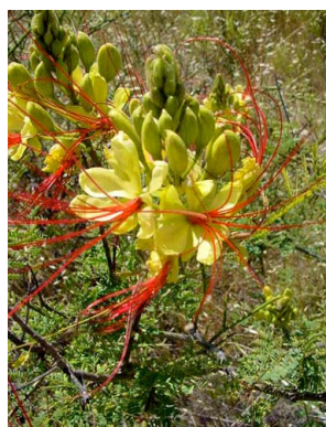
34 Caesalpinia gilliesii FABACEAE