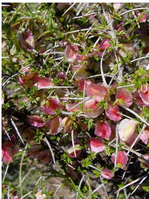
51 Tetraglochin alatum ROSACEAE