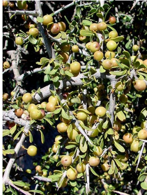
3 Schinus johnstonii ANACARDIACEAE