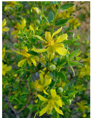
60 Larrea cuneifolia ZYGOPHYLLACEAE