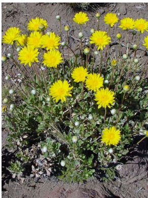
11 Grindelia coronensis ASTERACEAE