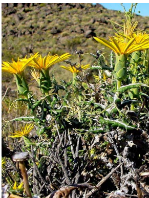
16 Mutisia retrorsa ASTERACEAE