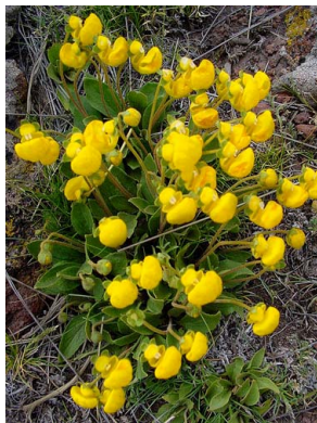
52 Calceolaria biflora SCROPHULARIACEAE