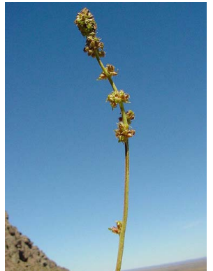
50 Acaena splendens ROSACEAE