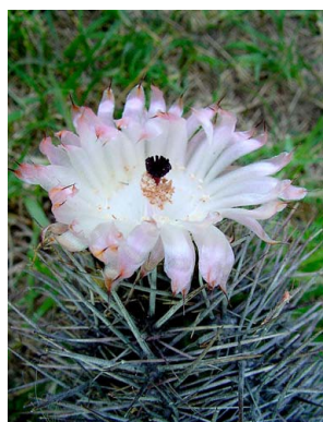
27 Austrocactus patagonicus CACTACEAE