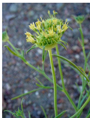
29 Boopis anthemoides CALYCERACEAE