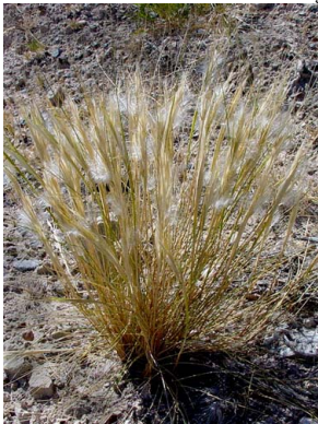
41 Jarava patagonica POACEAE

[www.fmh.org/plantguides] [RRC@fmnh.org] Rapid Color Guide # 199 versión 1. 07/2006