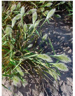
45 Polygomon monspeliensis POACEAE