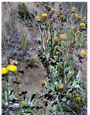
20 Senecio gilliesii ASTERACEAE