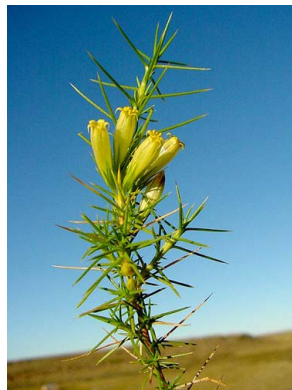
54 Pantacantha ameghinoi SOLANACEAE