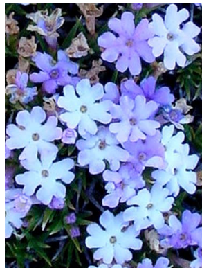
59 Junellia mulinoides VERBENACEAE