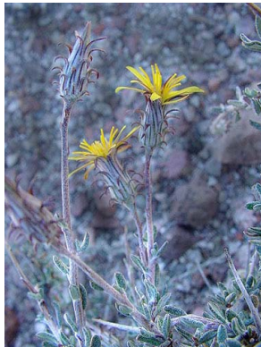
7 Brachyclados lycioides ASTERACEAE