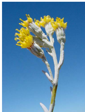
19 Senecio filaginoides ASTERACEAE