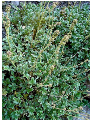
49 Acaena splendens ROSACEAE