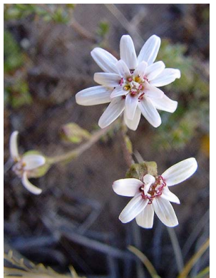
15 Leucheria achillaeifolia ASTERACEAE