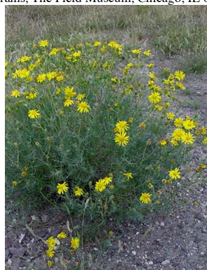
22 Senecio goldsackii ASTERACEAE