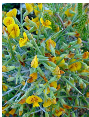
32 Adesmia patagonica FABACEAE