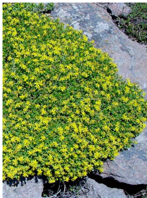
13 Gutierrezia baccharoides ASTERACEAE