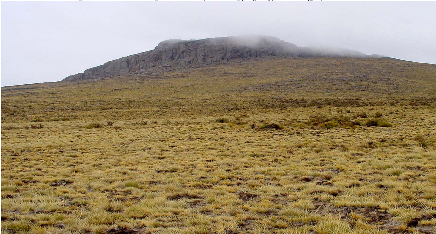
Cerro Corona, cerca 1.900 m.

© Environmental & Conservation Programs, The Field Museum, Chicago, IL 60605 USA. [www.fmnh.org/plantguides] [RRC@fmnh.org] Rapid Color Guide # 199 versión 1. 07/2006