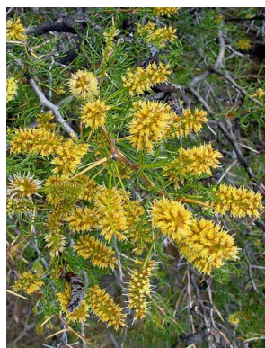
36 Prosopis denudans FABACEAE