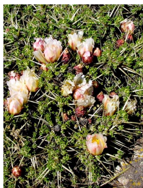
28 Maihuenia patagonica CACTACEAE