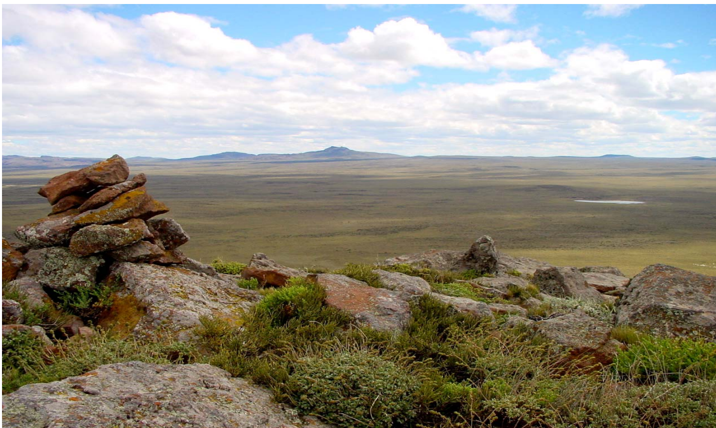
Vista desde el Cerro Corona. Una altiplanicie basáltica.