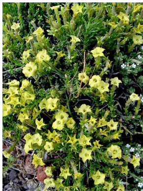
53 Fabiana patagonica SOLANACEAE