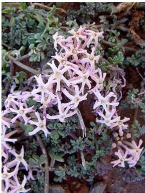
56 Glandularia araucana VERBENACEAE