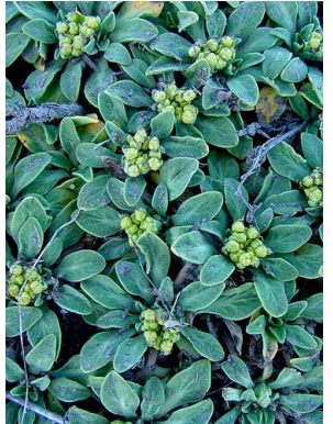
5 Azorella patagonica APIACEAE