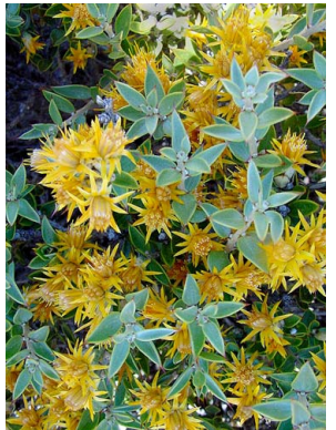
10 Chuquiraga avellaneda ASTERACEAE