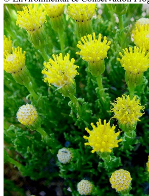
21 Senecio gnidioides ASTERACEAE

© Environmental & Conservation Programs, The Field Museum, Chicago, IL 60605 USA. [www.fmnh.org/plantguides] [RRC@fmnh.org] Rapid Color Guide # 199 versión 1. 07/2006